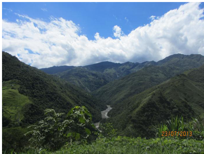
Figura 2: Cañón del Cauca

Las obras principales del proyecto hidroeléctrico se ubican en una zona conocida como El Cañón del Cauca, caracterizado por unas agrestes condiciones ambientales, como se observa en la Figura 2.