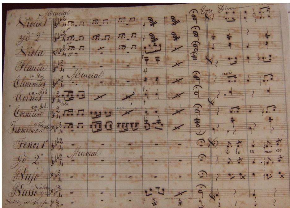
FIGURA 1. Introducción del Himno del Santo Padre Pío Nono arreglado por Rafael Rojas, Archivo, Iglesia de la Merced, La Habana.

Una de estas obras arregladas por Rojas es el Himno al Santo Padre Pío Nono 10 , de autoría desconocida y firmada como propiedad de José Rosario Pacheco el 8 de agosto de 1875. Está instrumentada para tres voces (dos tenores y bajo), dos violines, viola, violonchelo, contrabajo, flauta, dos clarinetes, dos trompas, cornetín, dos trombones, figle y timbales 11 (fig. 1).