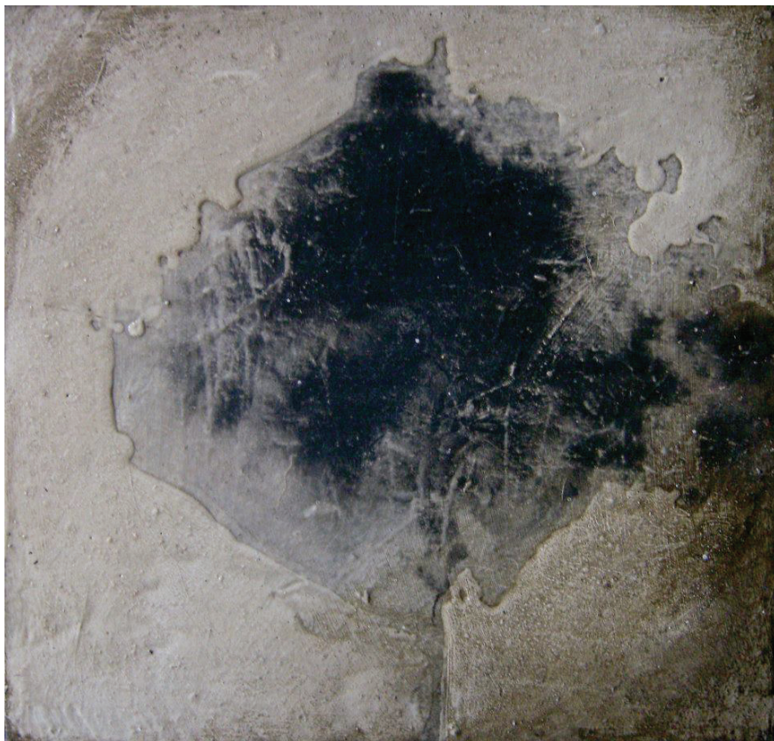
Figura 8. Sin título. 2012. Acrílico sobre lienzo, 24 x 25 cms