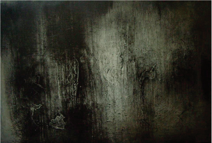
Figura 6. Borrasca . 2012. Acrílico sobre lienzo, 65 x 95 cms

Me interesan las visiones de los recuerdos, las afecciones que el espacio ha dejado en mí. Poder reconocerlas en una simple mancha, en un cruce de líneas. Establecer un diálogo entre esas imágenes que dejan las afecciones, con las imágenes que aparecen en el proceso mismo como configuraciones del carácter, del temperamento, a partir del gesto pictórico, a partir de lo que el cuerpo percibe.