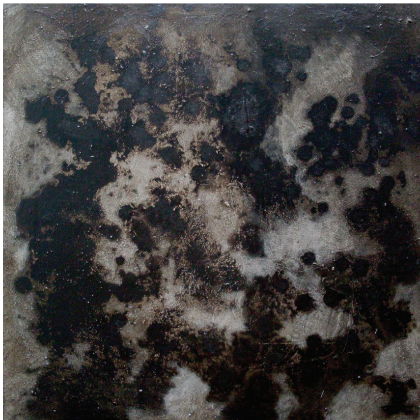
Figura 2. De las nubes negras . 2013. Acrílico sobre lienzo, 45 x 45 cms