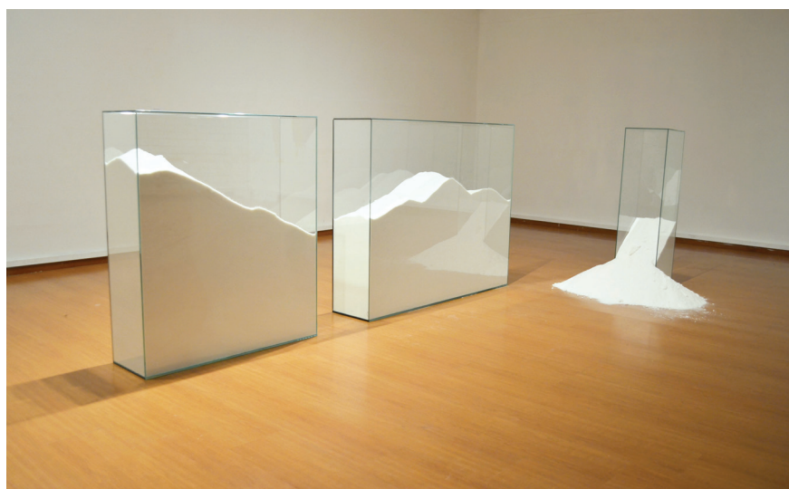
Figura 2. Contener el llanto . Natalia Giraldo, 2014. Instalación con tres urnas de vidrio de 96x82x25 cm., 96x30x25cm y 400 Kg. de sal

El llanto y su condición salobre dibujan el paisaje de mis emociones. Primero contengo mis lagrimas, luego las derramo. En el transcurso de mi vida he llorado mas que un mar de sal; no solo de aflicción si no también de alegría.