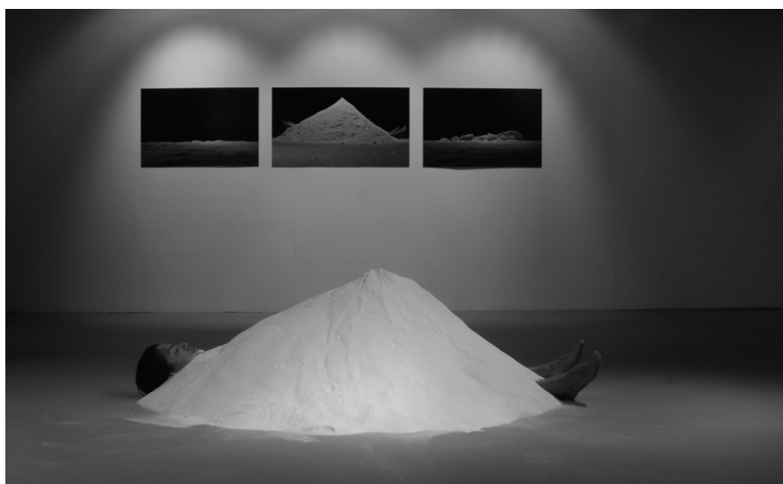
Figura 3. Estancia. Natalia Giraldo, 2013. Tríptico fotográfico (2 fotos de 60x90cm, y otra de 60x100cm) y 250Kg. de sal que deja una huella en el espacio a modo de escultura