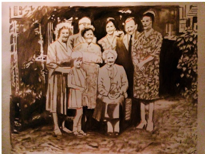
Figura 7. Más mujeres, menos hombres (pintura en proceso)

Título: de la serie Los colores escondidos. Técnica: óleo sobre lienzo, 90 x 60 cm, 2020.