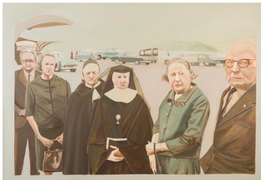
Figura 10. Seis (en el Olaya Herrera)

Título: de la serie FamiliaFotoFantasma.