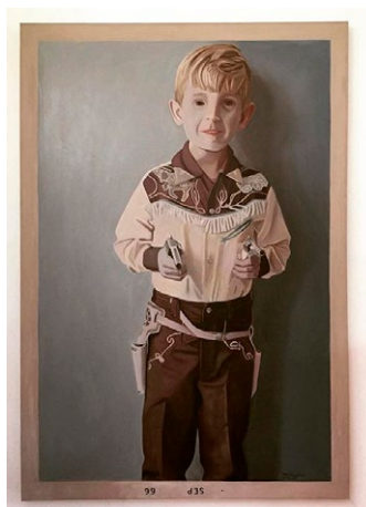
Figura 3. Septiembre

Título: de la serie FamiliaFotoFantasma.