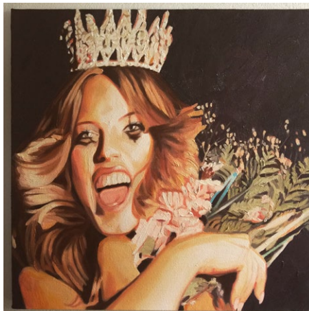
Figura 2. Hueco (retrato de la reina)