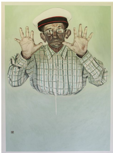
Figura 12. Todo

Técnica: óleo sobre lienzo, 160 x 110 cm, 2016.