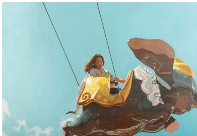
Figura 11. Plástico (retrato de mi madre)

Título: de la serie A lo que hemos llegado.