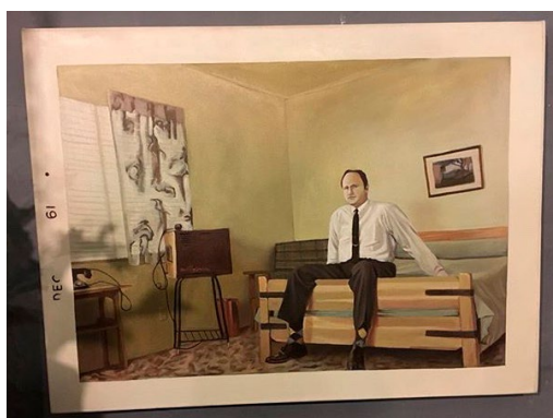
Figura 4. Diciembre (retrato de mi abuelo)

Título: de la serie FamiliaFotoFantasma.