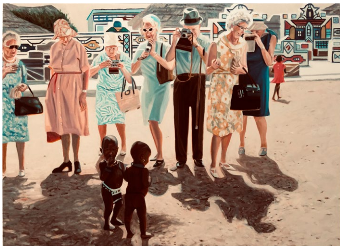
Figura 8. Lo desconocido; los pobres y los ricos

Técnica: óleo sobre lienzo, 120 x 90 cm, 2019.