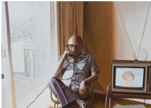
Figura 6. Madre luz (retrato de mi abuelo)

Título: de la serie A lo que hemos llegado.