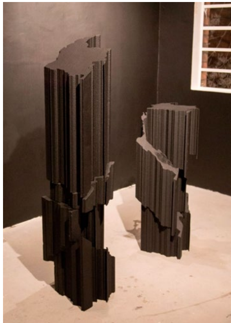
Figura 4. Yosman Botero, Landscape . Poliuretano expandido. 160x 50 x 50 centímetros. 2015

tria Colombiana de Porosos , estas piezas podrían entenderse como elementos de un paisaje –traducción al español del término landscape – en el que se arremete contra la ilusión triunfante de un proyecto nacional cuyas columnas vertebrales hace rato han sido fracturadas. Lo que a su vez suscita la sospecha de que con estas piezas, Botero ha hecho uso de aquel modo alegórico de significación que lanza su turbia luz sobre un panorama en el que “se yerguen las facies hippocratica (mascarillas funerarias) de la historia” (Buck-Morss, 1995, p. 34). Así, ha dibujado en tres dimensiones un paisaje escultórico fragmentado y en constante disolución, en donde el tiempo ha ido ejerciendo su violencia erosiva contra toda representación de la eternidad. Aunque, no toda la culpa hay que echársela al tiempo, ya que esta desgracia también puede atribuírsele a todos aquellos bárbaros que han intentado derribar los frágiles pilares de la democracia colombiana. Y que, por alguna extraña razón, vinculada a la asociación no causal de las imágenes, podría remitirse a las columnas del incinerado Palacio de Justicia, cubiertas de hollín negro como sedimento de aquella catástrofe ocurrida en aquel fatídico año de 1985.