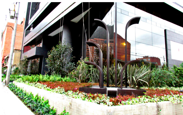
Edificio Kaiwa. 4 metros de altura. Carrea 7 calle 125. Bogotá, Colombia.