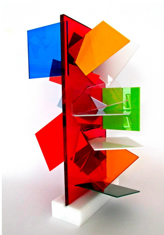
Figura 4. Colores

Picasso, Duchamp, Beuys, Malevitch, Richard Serra, Sol Lewitt, Donald Judd y Chillida. De ninguno de estos artistas que he citado tomo algo en particular, me interesa su pensamiento, su actitud, que los ha conducido a construir un lenguaje determinante en la historia del arte.