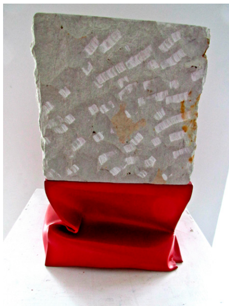
Piedra metal. 40 x 20 x 20 cm. 1990

3. En su obra la geometría es esencial y absoluta, aparece de forma contundente en sus obras, aunque la variedad de texturas como el metal, el cartón, o la roca me parece que le da también algo de orgánico a sus esculturas. ¿Por qué lo geométrico?