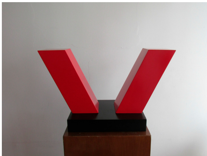
Metal. Módulo. 30 x 8 x 10 cm. 2015.