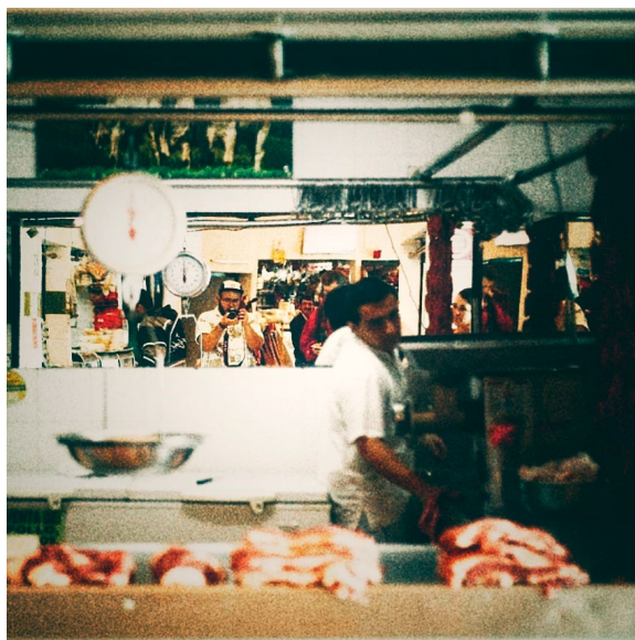
Figura 1. Autorretrato con intervención digital

Búsqueda de imágenes para usos artísticos en local de carnicería, plaza minorista de Medellín, 2019.