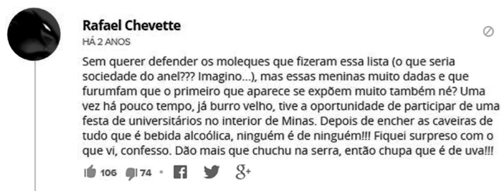
Figura 2. Comentário publicado no g1

pelos adultos na educação das crianças, inscrita como sintoma de mau comportamento. Assim, o sujeito discursivo busca marcar um posicionamento de defesa dos valores educacionais inscritos socialmente pela sanção a partir de um substantivo que, de fato, adjetiva os autores do cartaz.