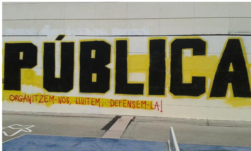
Pública por siempre 2015, Universidad Autónoma de Barcelona.

aliados y que, frecuentemente, provocan discordias, hostilidades, enemistades y pugnas entre quienes nos ubicamos en el sur. Con esto evitan que entre las sociedades del sur se establezcan relaciones de concordia, mancomunidad, amistad y armonía que ayuden a dignificar la condición humana.