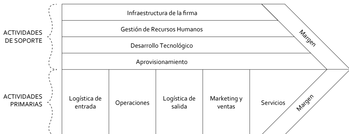
Figura 1. La cadena de valor genérica

El análisis PESTEL permite evaluar el entorno externo en el que opera la organización, permitiendo identificar y comprender los diversos aspectos