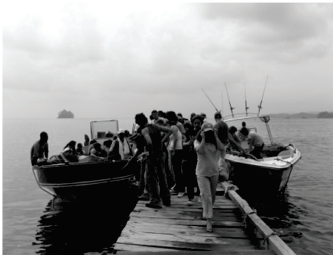
Foto 7. Llegada desordenada de turistas en el muelle de la vereda Triganá.