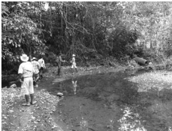
Foto 4. Caminatas por algunos caminos veredales en el corregimiento de San Francisco de Asís.