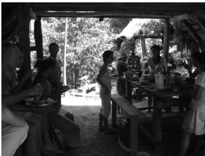
Foto 6. Taller de la organización UNGANDÍ para impulsar prácticas sostenibles de agroecoturismo. Autor: Carlos Daniel Roldán.

De acuerdo con los registros del trabajo de campo, varios pobladores locales de este corregimiento se dedican a conservar el entorno natural y voluntariamente mantienen sus predios en muy buen estado de conservación, con prácticas que contribuyen considerablemente a la sostenibilidad ambiental de este territorio. Varios miembros de la comunidad local, impulsados por la ONG UNGANDÍ (Foto 6), implementan prácticas responsables tales como la producción agropecuaria sostenible, la protección de los ecosistemas, la autosuficiencia alimentaria, las relaciones solidarias entre habitantes locales, la educación ambiental con proyección comunitaria hacia los niños, entre otras actividades que, integradas bajo la modalidad de agroecoturismo, ayudan a fortalecer el tejido social y contribuyen a mantener una conservación ambiental integral en el territorio (Registros Diario de Campo, 2008).