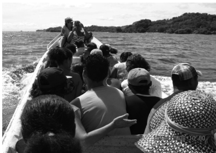
Foto 1. Actividades de transporte marítimo en el corregimiento de San Francisco de Asís.

El desarrollo turístico en este corregimiento ha sido poco planificado (Vera, 2005) y por ahora sólo cuenta con un manejo individual e informal de sus principales actividades, entre las que sobresalen el transporte marítimo (Foto 1), el alojamiento, la alimentación (Foto 2), la libre recreación en la playa y en el mar (Foto 3) y las eventuales caminatas por algunos caminos veredales (Foto 4). Esta situación ya ha logrado generar impactos socio-ambientales considerables sobre este territorio y sus consecuencias negativas son evidentes sobre distintos aspectos como el mal funcionamiento del saneamiento básico, los altos costos de vida, la descontrolada venta de tierras, el ingreso desordenado de nuevas personas a la zona, la insuficiencia en los servicios públicos, el deterioro social y ambiental, entre otros (Vera y Tamayo, 2000; Vera, 2005; Upegüi y Noreña, 2006).