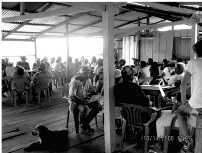
Foto 5. Taller con la comunidad local en el corregimiento de San Francisco de Asís. Autor: Carlos Daniel Roldán.

Es importante resaltar que las técnicas etnográficas utilizadas, además de ser herramientas adecuadas para recopilar la información primaria, se convirtieron en valiosos instrumentos para entablar una relación de confianza entre el investigador y la comunidad local durante el trabajo de campo. Igualmente, los talleres fueron un espacio de construcción colectiva donde se combinó teoría y práctica alrededor del tema investigado (Foto 5). Esta concepción metodológica se llevó a cabo siguiendo las recomendaciones de autores como Sandoval (2002); Candelo, Ortiz y Unger (2003); Cerda (2005); Hernández, Fernández y Baptista (2006).