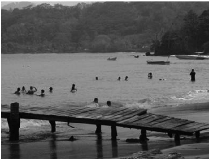
Foto 3. Actividades de libre recreación en la playa y en el mar en el corregimiento de San Francisco de Asís.