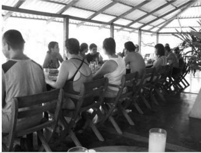
Foto 2. Actividades de alimentación en el corregimiento de San Francisco de Asís.