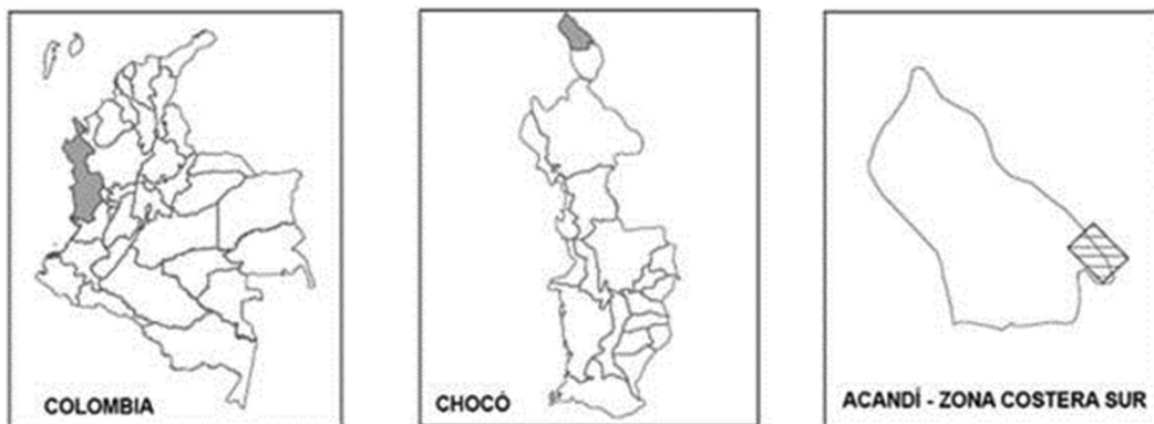
Figura 1. Localización del corregimiento de San Francisco de Asís.

2. El turismo alternativo que no pasa por operadores, es un flujo que obedece a otras lógicas y conforma un mercado actual y potencial de gran importancia (Negrete y Velut, 2005).