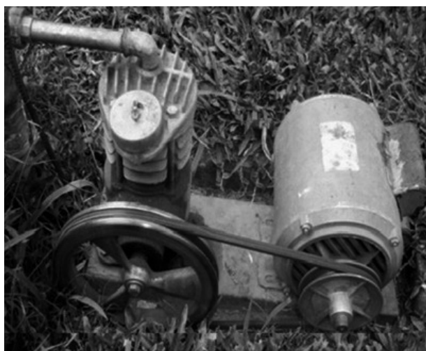
Figura 3. Motobombeador.