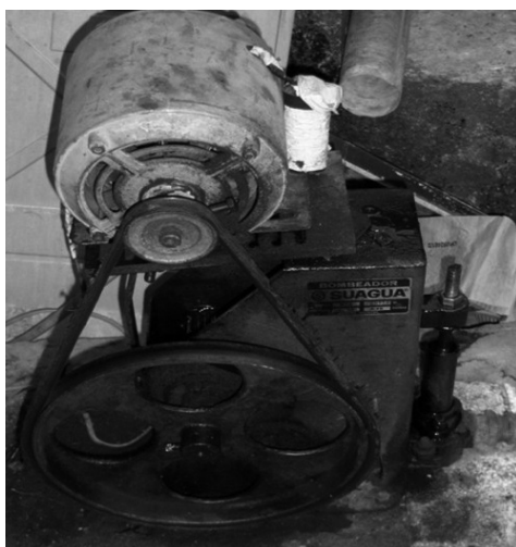
Figura 2. “Bombas mamut” (compresores).

Es decir, las empresas perforistas no conforman el núcleo de acumulación del circuito sino que participan de forma marginal en la distribución del excedente, ya que tienen baja dotación del capital, situación que afecta la formación de precios. También son totalmente dependientes de proveedores externos para brindar los servicios postventa y constituyen el último tramo de un eslabón en el que se cruzan distintas fases de producción,