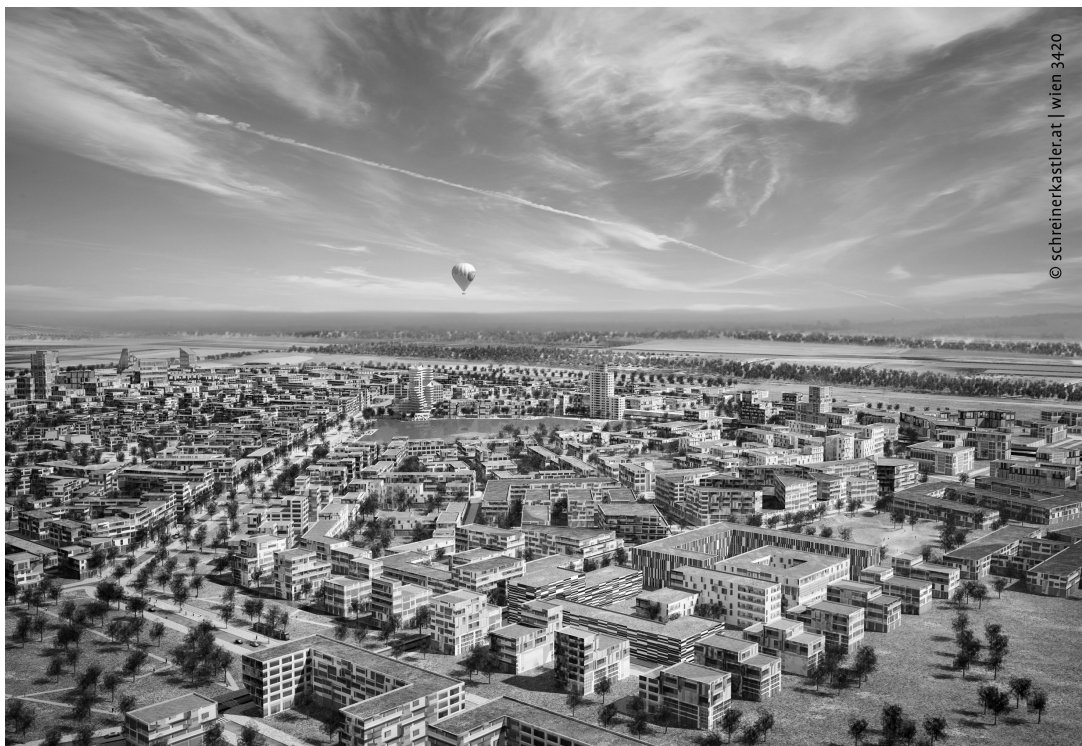
FIGURA 4. Visión urbanística (schreinerkastler 2012: < http://www.aspern-seestadt.at/presse >)

Este pretende ser un proyecto innovador con carácter de modelo. Finalmente, cabe preguntarse si cumplirá con estos requerimientos. Lo que se puede observar es que se perfila como una innovación ecológica y esto permite tener a priori una visión optimista.