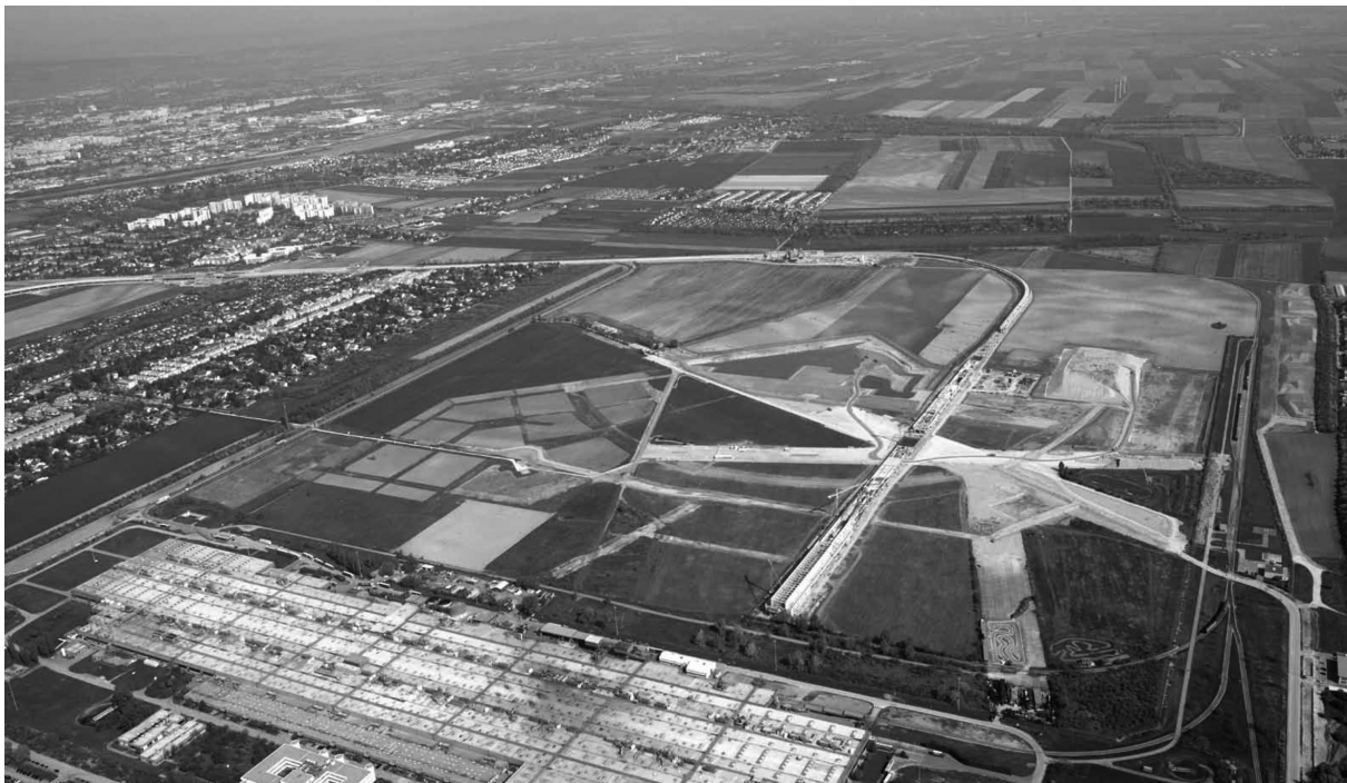
FIGURA 1. Imagen aérea del área de desarrollo urbano en Aspern (Fiedler 2011, 1)

1). En el StEP05 se fijó como objetivo para esta zona el desarrollo de un distrito de carácter urbano independiente, innovador y bien conectado a través del transporte público. La “Corporación Wien 3420 Aspern Development AG” (una empresa semiestatal) fue la encargada de iniciar y coordinar el proceso de desarrollo. En 2005 se realizó un concurso urbanístico en diálogo con los ciudadanos, lo cual llevó a que en 2007 se creara el Masterplan por parte del equipo sueco de Tovatt Architects and Planners. Con base en el Masterplan se implementó en 2008 una evaluación medioambiental determinando 63 criterios con respecto al medio ambiente, la sostenibilidad y la garantía de calidad para el proyecto de desarrollo urbano. Durante el mismo período se elaboró el branding de la Seestadt Aspern con el eslogan “Toda la vida” refiriéndose a las dimensiones sociales e incluyendo aspectos de sostenibilidad.