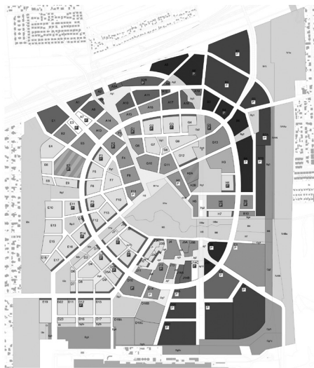
FIGURA 2. Plan regulador urbano de Tovatt Architects and Planners (Fiedler 2011, 6).

La Partitura presenta las visiones y los desafíos de cada una y define tipologías considerando distintas opciones de diseño más concretas para la primera fase de obra. Además, da directrices urbanísticas respecto a la jerarquía de las calles y de los espacios públicos, así como del diseño de la zona de planta baja y del mobiliario urbano.