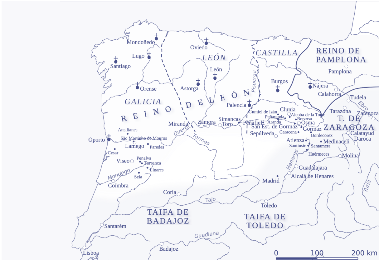
[MAPA 2, REINO DE LEÓN AL FINAL DEL REINADO DE FERNANDO I (1065)] 14

conquista: el poblamiento inmediato de los territorios conquistados 12 , dicho procedimiento llamado «presura» consistía en entregar un título de propiedad al poblador cristiano que roturara y cultivara a la brevedad la tierra 13 . Por medio de esta estrategia, los castellanos avanzaron hasta el valle del Tajo, río que parte Toledo.