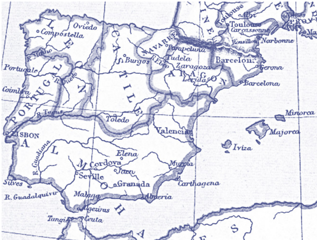
[MAPA 3, SITUACIÓN DE LA PENÍNSULA IBÉRICA HACIA 1210] 34

Esta misma separación hizo que los musulmanes temieran la conquista de las taifas de Badajoz, Toledo, Zaragoza y Valencia, ya que, si lograban