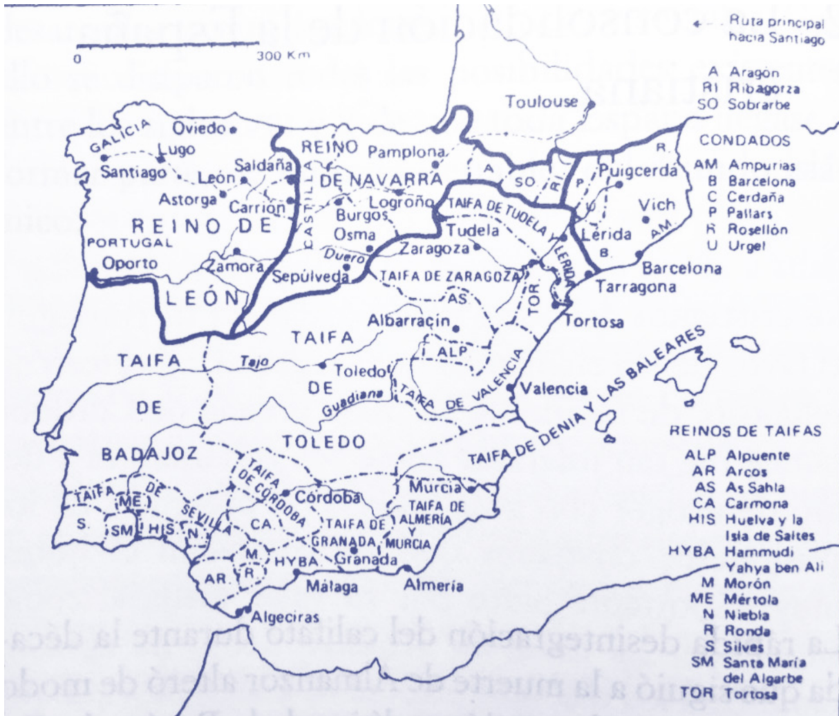
[MAPA 1, PENÍNSULA IBÉRICA TRAS LA FRAGMENTACIÓN DEL CALIFATO DE CÓRDOBA (1031)] 3

Córdoba fue el epicentro de las luchas desde la deposición de Hishmán II, en 1009, hasta 1031, cuando se anunció la abolición del califato y comenzó la era de las taifas. Esta fragmentación facilitó a los reinos cristianos del norte sus