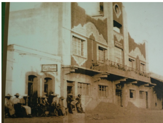
Ilustración 6. Vista del Palacio Municipal de Progreso de Obregón (en construcción)

Es importante decir que la dinámica generada a partir del comercio, el desarrollo del transporte y la ultimación de vías alternas como el Camino Viejo dieron como resultado, a largo plazo, un desarrollo micro regional mayor de este lugar en relación con sus comunidades y municipios vecinos.