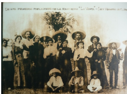
Ilustración 2. Los primeros pobladores de La Venta ahora Progreso, Hidalgo.

Pese a la existencia de un solo mesón a principios de siglo XX, para inicios de la década de 1930, se había convertido en el reflejo de otros negocios y locales de venta; pulquerías, tiendas de abarrotes y comidas, así como un pequeño tianguis establecido en lo que son ahora son las inmediaciones de la plaza cívica. Existen dos versiones del por qué de su nombre. Una hace alusión a aquel primer mesón como pionero de los negocios de comida, alojamiento y vendimia de víveres; la otra versión habla de la alusión a la actividad que se generó tiempo después de la creación de los mesones (y aun según relatos ya cuando estos no existían), en la que comerciantes de varias comunidades aledañas se reunían en las inmediaciones de lo que fue el Camino Viejo, para vender diversos productos, principalmente abarrotes, comida y forraje.