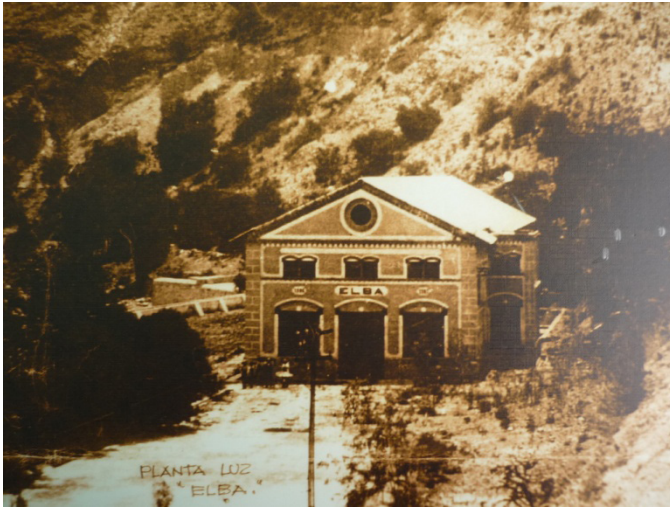
Ilustración 3. Hidroeléctrica Elba.

Cabe mencionar que la instalación de esta hidroeléctrica obedeció al carácter estratégico que presenta esta región y a que, por su naturaleza orográfica, se ubica en una zona rica en manantiales y fuentes hídricas naturales. Este acontecimiento dio más dinamismo a la localidad, a partir de la migración de trabajadores que se asentaron posteriormente en una colonia muy cercana a la ahora abandonada Planta Elba.