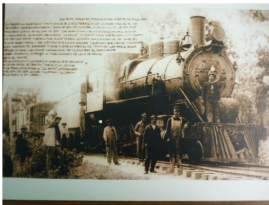
Ilustración 5. El Ferrocarril del Desagüe.

Por lo anterior, y como consecuencia de las gestiones locales, el 8 de noviembre de 1924 El General Álvaro Obregón, Presidente de la República, arriba al barrio de La Venta (elevado a categoría de pueblo para aquel entonces) para inaugurar la terminal ferroviaria del ferrocarril del Desagüe del Valle de México; ahí mismo, los líderes locales le ofrecen una recepción memorable cuya consecuencia, según la historia oral, es el indicio más remoto de la creación y separación del pueblo de su cabecera municipal.