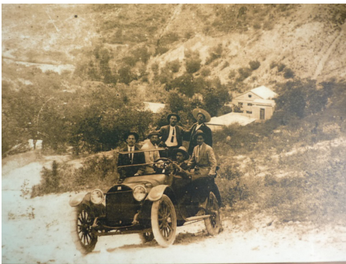
Ilustración 4. Algunos trabajadores y funcionarios locales de regreso de la Planta de Elba.