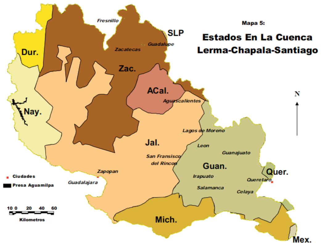
Figura 2. Estados en la cuenca Lerma-Chapala-Santiago

Fuente: Brown, Douglas. 2003. "Impactos Potenciales de la Cuenca Rio Lerma-Lago Chapala-Rio Santiago en la Pesquería de la Presa de Aguamilpa. Informe Provisional", http://www.dcbrown.org/cuenca%20report%20es.pdf