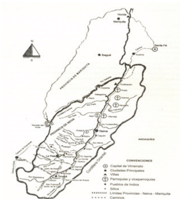
Figura 2. Mapa Provincias de Neiva y Mariquita