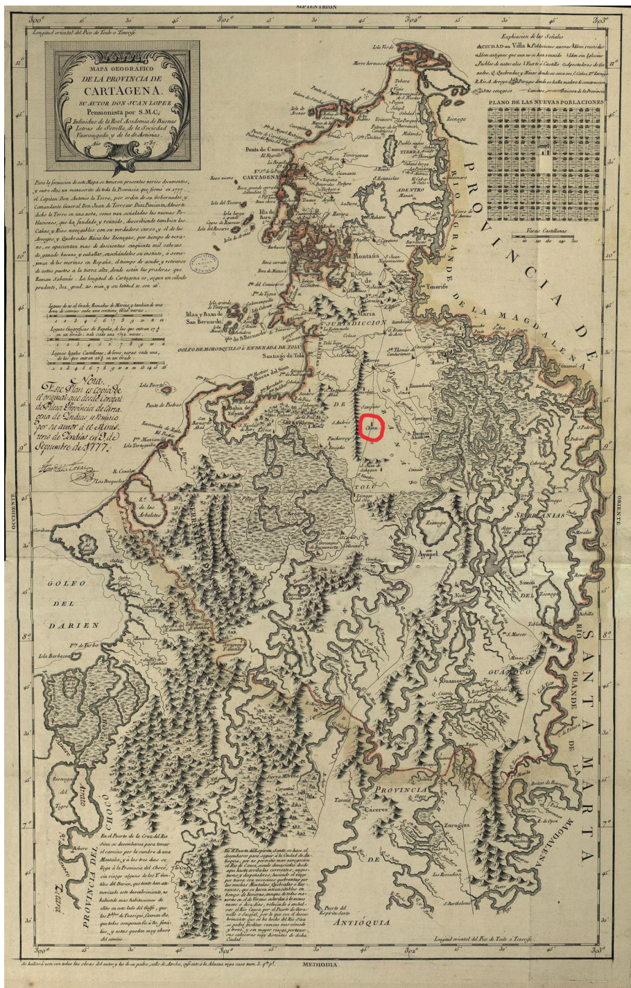
Figura 1. Mapa Geográfico de la Provincia de Cartagena

Fuente: Archivo General de Indias (AGI), MP, Panamá 339, "Mapa de la Provincia de Cartagena 1787" por Juan López.