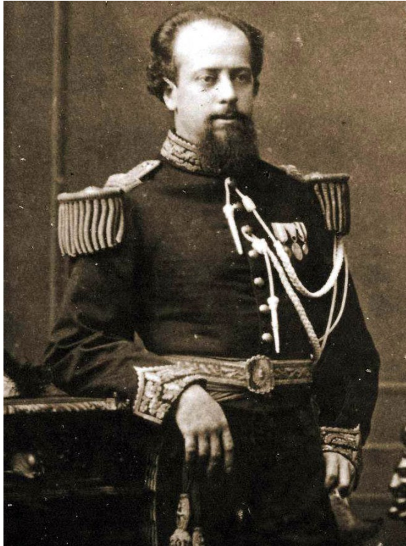
Figura 1. Julio A. Roca, 1878