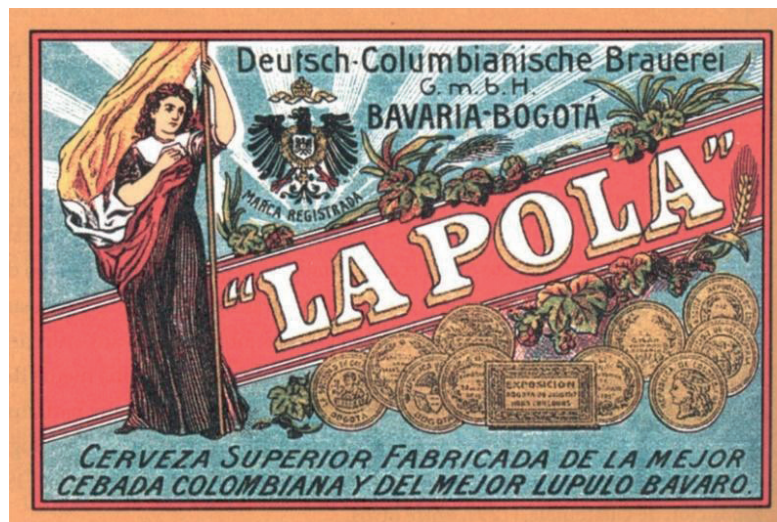
Figura 5. Etiqueta cerveza La Pola, 1911

En uno de los tantos discursos pronunciados en esos días, el gobernador de Boyacá insiste en que la mujer es “el despertador del amortecido sentimiento patrio”, que alienta la civilización y el progreso, inspira las ideas del espíritu, purifica el corazón de las violentas pasiones y eleva y dignifica el alma de la Patria, razón por la cual se da, además, una amnistía a las mujeres que purgaban su condena en las cárceles colombianas, la gracia de justicia que ella misma no obtuvo en similar trance.