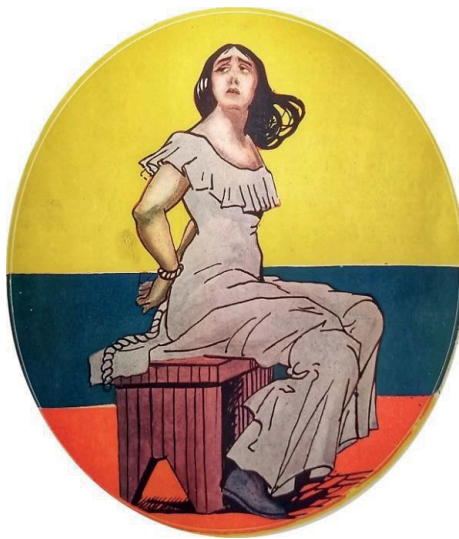
Figura 1. Portada de la revista Cromos 91

de la fiesta patria, los cuales incluyeron el desfile del batallón Guardia Presidencial y la retreta, así como los discursos frente a la estatua de la mártir en Las Aguas, 12 con lo cual se confirma el espacio que iba ganando esta estatua como lugar de la memoria urbana de la capital (Vanegas 2017, 18). Igualmente, se llevó a cabo una sesión solemne de las escuelas públicas femeninas en el salón Olimpia ; un desfile con un carro alegórico tirado por dos caballos blancos, con una niña vestida de La Pola al centro y otras dos niñas representando a la Libertad y a la República, precedidas por otro símbolo patrio, el Escudo Nacional con un gran cóndor. Acompañaron este desfile las niñas de las escuelas y sus profesoras, que desfilaron desde el Museo Nacional hasta la Plaza de Bolívar. 13