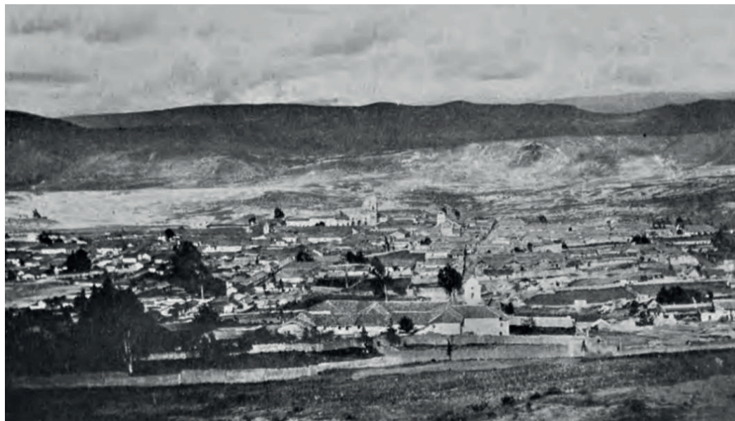
Figura 2. Vista de la ciudad de Tunja desde el occidente, 1917