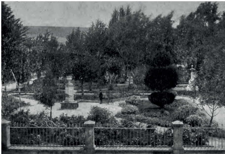
Figura 3. Parque Pinzón

A las 3 p.m., a beneficio de las obras de caridad del Club Noel para niños pobres, se realizaron los juegos florales en el parque Pinzón recientemente inaugurado y cuidadosamente arbolado y enrejado con motivo de la celebración del centenario de la muerte de Ricaurte en 1914 (ver figura 3).