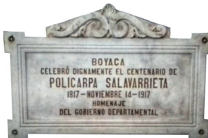
Figura 4. Placa en la Gobernación de Boyacá en honor al centenario de La Pola celebrado en Tunja, en 1917