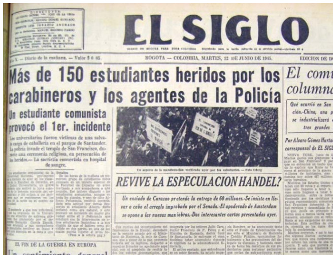
Titular de El Siglo refiriéndose a los enfrentamientos entre los estudiantes y la policía en Bogotá en junio de 1945.

Fuente: El Siglo , Bogotá, 12 de junio de 1945, 1.