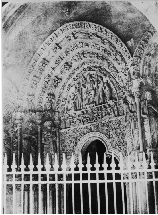
Imagen 10. Fuente: Gustave Le Gray et Mestral. Portail sud, église Saint-Seurin, Bordeaux (Gironde) . 1851. Médiathèque de l'architecture et du patrimoine. Reg. 9. Photo (C) Ministère de la Culture - Médiathèque du Patrimoine, Dist. RMN-Grand Palais / Gustave Le Gray / Auguste Mestral

Cada imagen tomada en los recorridos de la Misión logró capturar un momento, un lugar, una cultura, una geografía y una historia diferentes. En la medida en que se observan estas imágenes, se siente una nostalgia hacia un remoto pasado, pero también un anhelo por su subsistencia y permanencia en una nueva historia. El pasado más antiguo de la civilización francesa, registrado en imágenes como Dolmen dit "grande allée couverte", Bagneux (Maine-et-Loire) 30 (Imagen 11) de Le Gray y Mestral, o en Vue intérieure du théâtre romain, Orange (Vaucluse) , 31 de Baldus (Imagen 12) y en todas las tomas de edificios medievales, está presente.