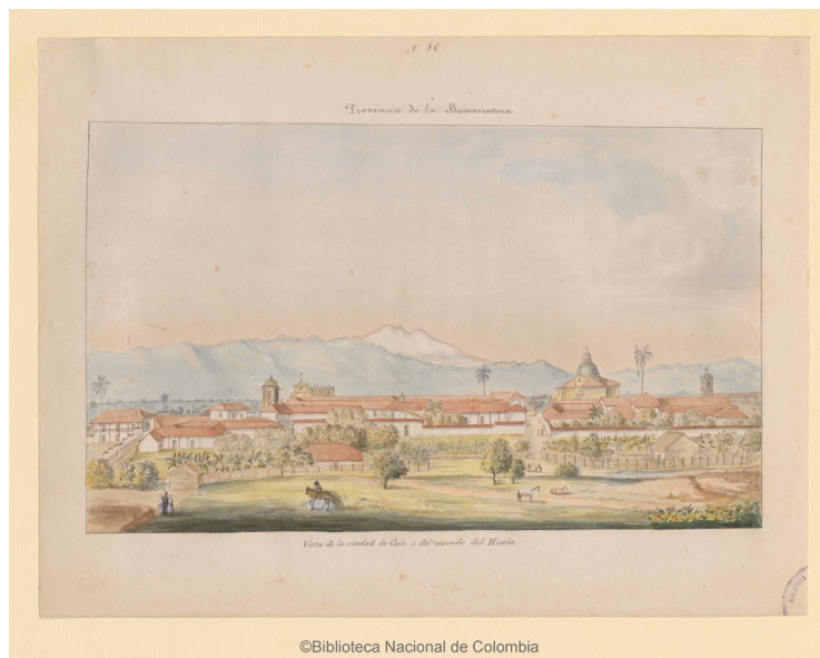
Imagen 5. Fuente: Manuel María Paz. Vista de la ciudad de Cali i nevado del Huila . Acuarela sobre papel. Biblioteca Nacional de Colombia