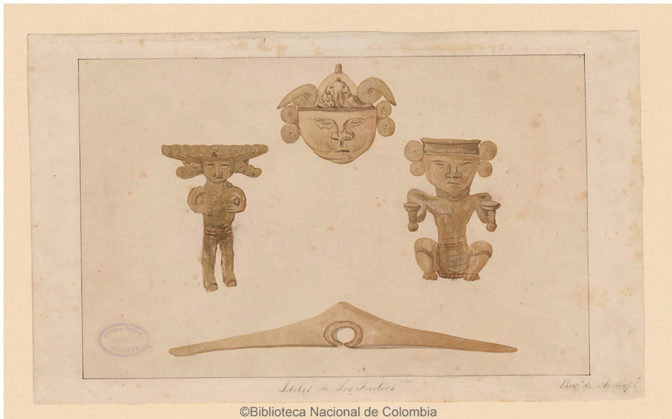
Imagen 3. Fuente: Henry Price. Ídolos de los indios . Acuarela sobre papel. Biblioteca Nacional de Colombia

De la autoría de Henry Price encontramos acuarelas como Ídolos de los indios (Imagen 3), que representa cuatro adornos de oro, objetos que flotan simétricamente en el papel, como si hubieran sido elegidos sin una aparente particularidad. En Santa Rosa de Osos (Imagen 4), Price construyó un lindísimo paisaje de la población antioqueña, desde cuyo primer plano observamos un pequeño campesino apoyado sobre un palo en una alta ribera; en el segundo plano, metidos en lo profundo de una estrecha cañada, aparecen otros dos minúsculos personajes juntos, y en un tercer plano lejano, la población de Santa Rosa con sus tejas de barro y la blanca iglesia que marca la centralidad de la composición.