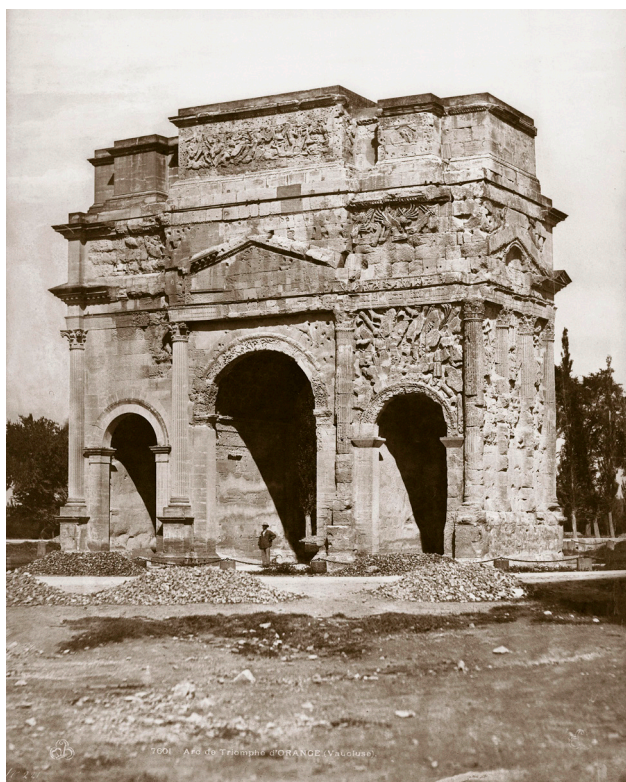
Imagen 7. Fuente: Édouard Baldus. Face sud, arc de triomphe, Orange (Vaucluse) . 1851. Musée d'Orsay. Rép. des photo No. 221. Photo (C) Musée d'Orsay, Dist. RMN-Grand Palais/ Patrice Schmidt

suspendidos en el tiempo. Resulta curioso que aquel objetivo de registrar para llevar a cabo arreglos prácticos no es tan evidente en las láminas. Dice Rosenblum que son imágenes más artísticas que científicas. Muchas de ellas buscaron fuertes contrastes entre luz y sombra, como en Face sud, arc de triomphe, Orange (Vaucluse) 25 (Imagen 7) de Édouard Baldus; en otras, los cambios de luz desaparecen y la imagen completa queda unificada por un mismo matiz, como en Portail ouest, église Saint-Ours, Loches (Indre-et-Loire) 26 (Imagen 8), de Gustave Le Gray y Mestral.