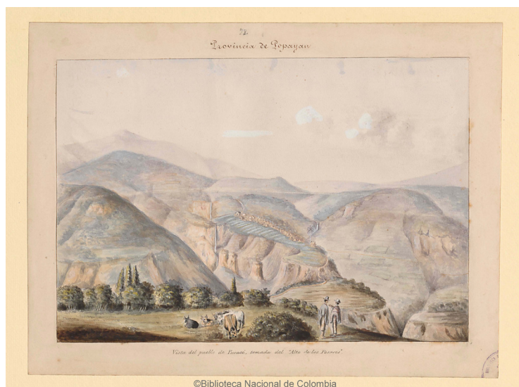
Imagen 6. Fuente: Manuel María Paz. Vista del pueblo de Puracé, tomada del "Alto de los Pesares" . Acuarela sobre papel. Biblioteca Nacional de Colombia