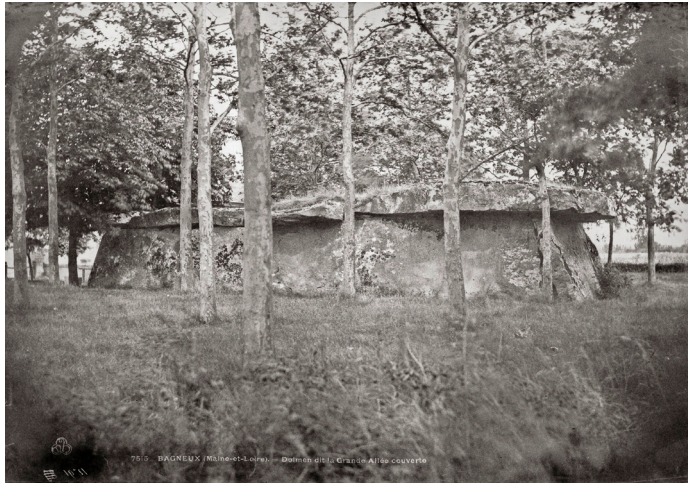
Imagen 11. Fuente: Gustave Le Gray et Mestral. Dolmen dit "grande allée couverte", Bagneux (Maine-et-Loire) . 1851. Musée d'Orsay. Rép. des photo No. 91. Photo (C) Musée d'Orsay, Dist. RMN-Grand Palais / Patrice Schmidt