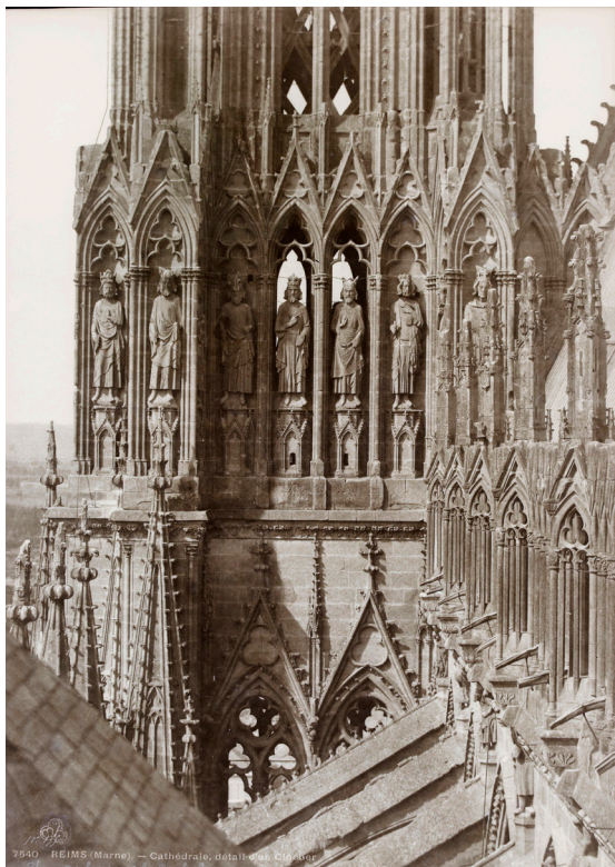
Imagen 9. Fuente: Henri Le Secq. Tour sud, cathédrale Notre-Dame, Reims (Marne) . 1851. Musée d'Orsay. Rép. des photo No. 155. Photo (C) Musée d'Orsay, Dist. RMN-Grand Palais / Patrice Schmidt

Baldus reconoció la importancia de elegir un punto de vista que iluminara la naturaleza tridimensional del sujeto. Además de usar la tradicional vista frontal de sus contemporáneos, en muchos casos prefirió puntos de vista oblicuos. Sus composiciones dependen en balancear planos de espacio pictórico que compiten a través del uso de contrapuntos horizontales y verticales, eliminando así las distracciones, y concentrando el enfoque del observador dentro de la organización pictórica del marco. 29