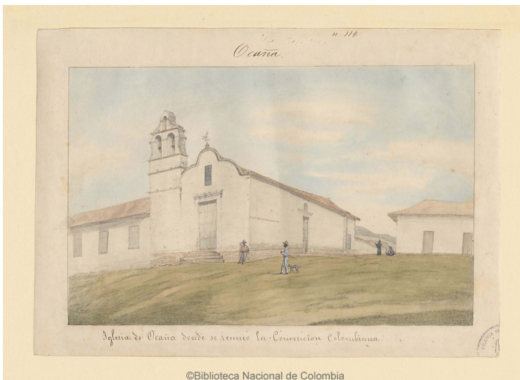
Imagen 2. Fuente: Carmelo Fernández. Iglesia de Ocaña donde se reunió la Convención Colombiana. Acuarela sobre papel. Biblioteca Nacional de Colombia