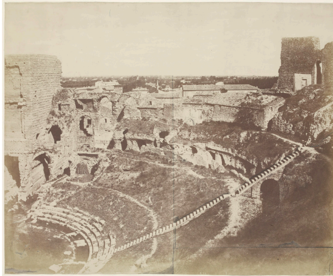
Imagen 12. Fuente: Édouard Baldus. Vue intérieure du théâtre romain, Orange (Vaucluse) . 1851. Musée d'Orsay. Rép. des photo No. 220. Photo (C) Ministère de la Culture - Médiathèque du Patrimoine, Dist. RMN-Grand Palais/Edouard Baldus