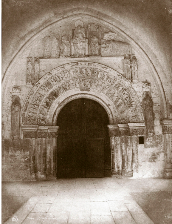
Imagen 8. Fuente: Gustave Le Gray et Mestral. Portail oust, église Saint-Ours, Loches (Indre-et-Loire) . 1851. Musée d'Orsay. Rép. des photo No. 85. Photo (C) Musée d'Orsay, Dist. RMN-Grand Palais / Patrice Schmidt

Los puntos de vista y encuadres desde donde se tomaron las fotografías también fueron variados. En imágenes como Tour sud, cathédrale Notre-Dame, Reims (Marne) 27 (Imagen 9), de Henri Le Secq, el fotógrafo se aventuró a subir a la torre norte o a un posible andamio instalado en el momento, para registrar desde allí la torre sur. En Portail sud, église Saint-Seurin, Bordeaux (Gironde) 28 (Imagen 10), Le Gray y Mestral se acercaron directamente hasta la reja de hierro que protegía el portal para hacer una toma en ángulo de tímpano. Sobre esta elección, acerca del fotógrafo Baldus, Robert Hirsch dice que: