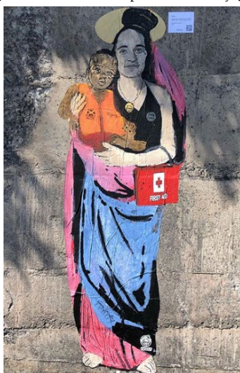
Figura 2. Carola santa protettrice dei rifugiati

Fuente: Tvboy. Mural. Taormina, Italia. Instagram, publicación del 6 de agosto de 2019. Revista Sudestada. https://www.instagram.com/p/B00vUPjg_o9/