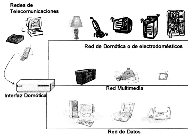
Figura 3. Sistema domótico centralizado para vivienda inteligente (diseño propio)

Así mismo sucede con los sistemas de control de acceso para la casa digital, donde gracias a procesos como digitalización de señales y dispositivos de análisis biométricos (identificación de huellas, retina), es posible administrar y gestionar procesos de vigilancia en cuanto a la seguridad del hogar, como por ejemplo realizar tareas de comparación y/o generación de bases de datos de las características fisiológicas fundamentales de las personas autorizadas para ingresar a áreas comunes restringidas o de la vivienda en general, logrando con ello un sistema inteligente de vigilancia. En la siguiente figura se muestra un sistema domótico centralizado para una vivienda inteligente en el cual se interconectan las distintas redes que hacen parte de los sistemas de telecomunicaciones.