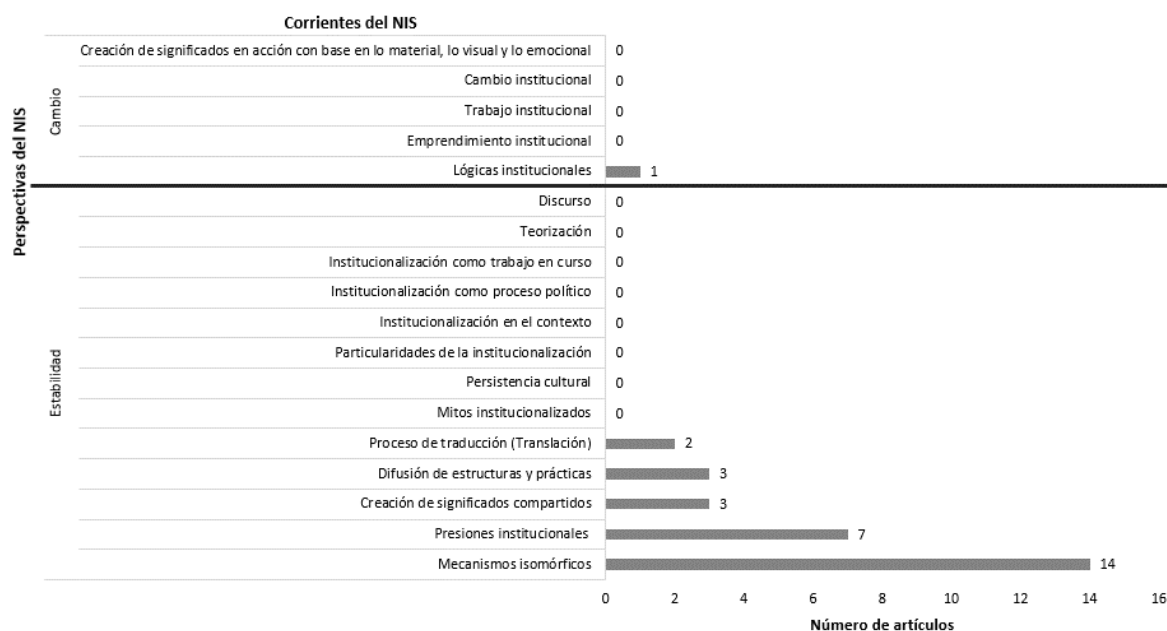
Figura 3. Perspectivas y corrientes del NIS que orientaron los análisis

A partir de la tabla 3 se construyó la figura 3, con el fin de resaltar los vacíos existentes desde las perspectivas y corrientes desde las cuales se ha estudiado la institucionalización de la RSE.