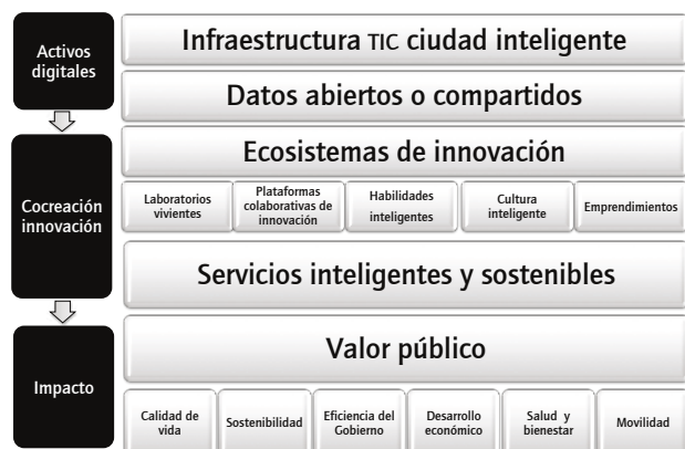
Figura 3. Modelo conceptual de ciudades inteligentes con enfoque en ecosistemas de innovación para la creación de valor público.

partir del análisis de la literatura y la metodología seguida para la sistematización, se obtiene un modelo conceptual general de ciudades inteligentes soportadas sobre ecosistemas de innovación para la creación de valor público. La figura 3 muestra dicho modelo conceptual.