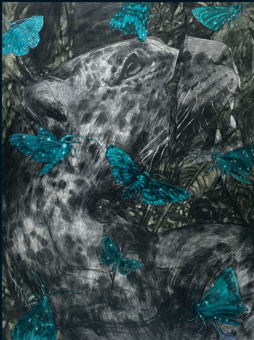
© Sara Herrera Fontán | Jaguar y polillas | Técnica mixta sobre lienzo | 180x120 cm | 2021