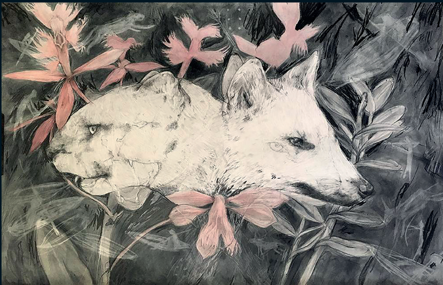
© Sara Herrera Fontán | Sin título. De la serie "Un sueño" | Grafito y acuarela sobre papel | 63x100 cm | 2019