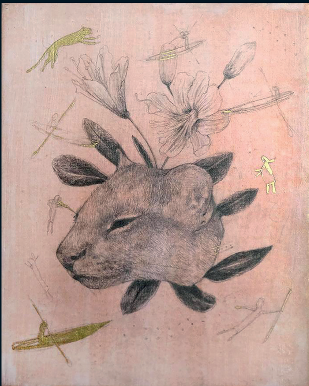
© Sara Herrera Fontán | Sin título | Técnica mixta sobre lienzo | 27 x 18 cm | 2017