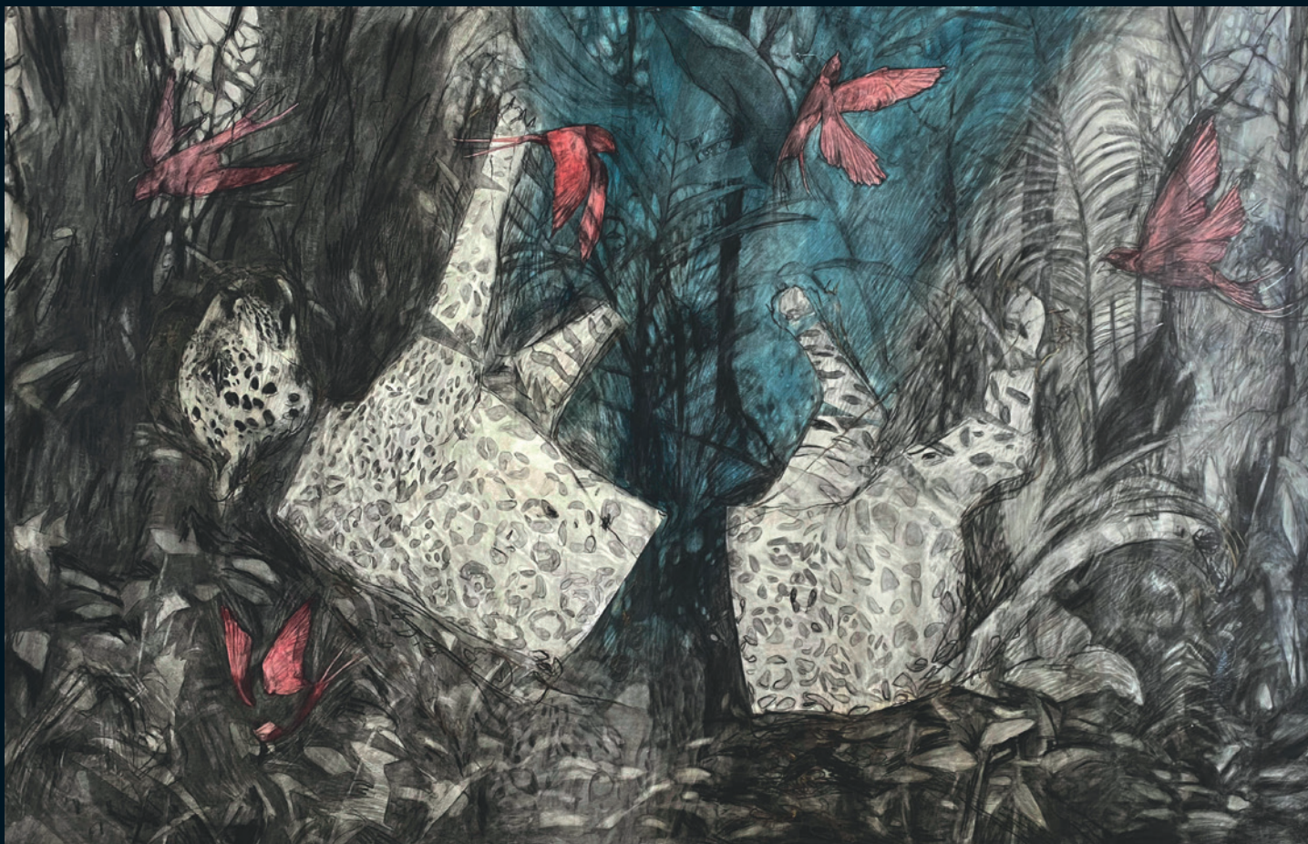
© Sara Herrera Fontán | Sin título | Técnica mixta sobre lienzo | 180x350 | 2021