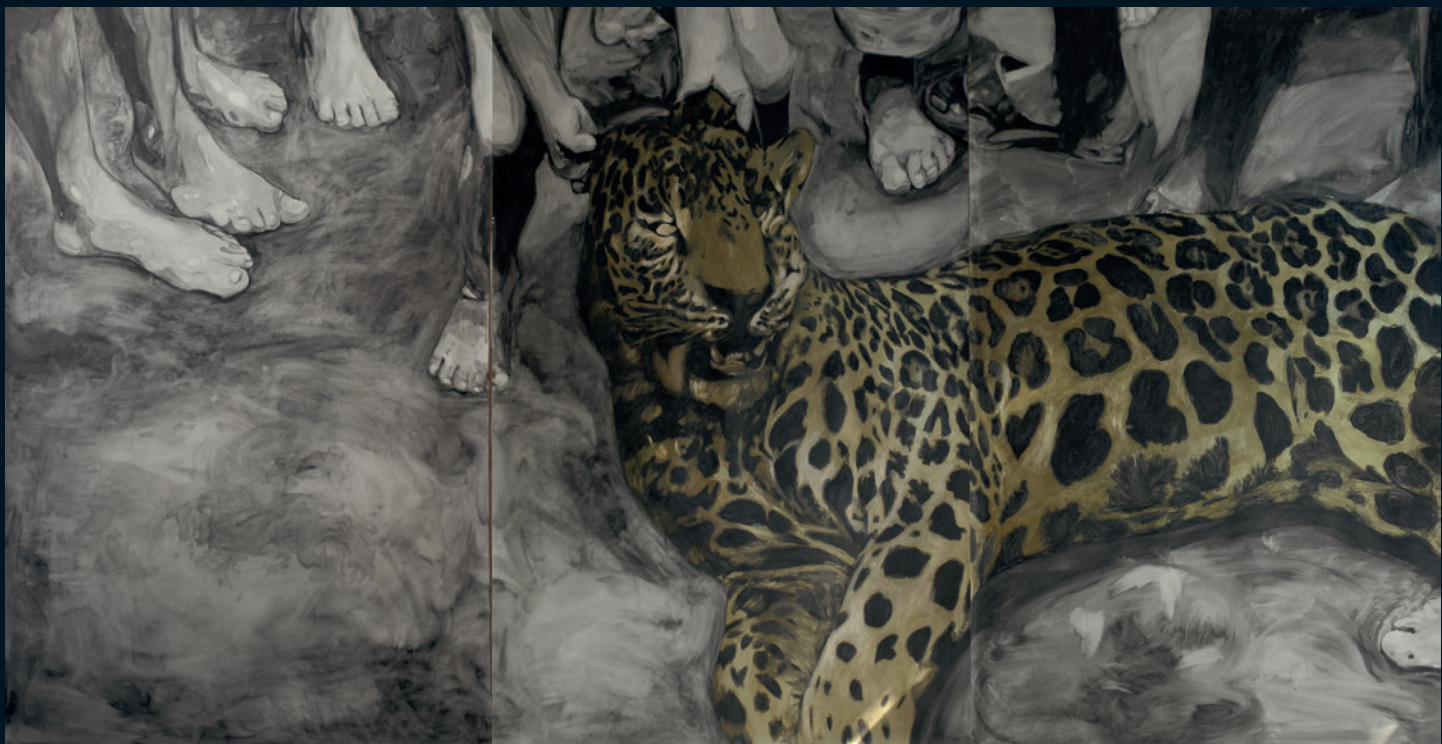
© Sara Herrera Fontán | Animal feroz | Grafito y esmalte sobre papel | 200x400 cm | 2011