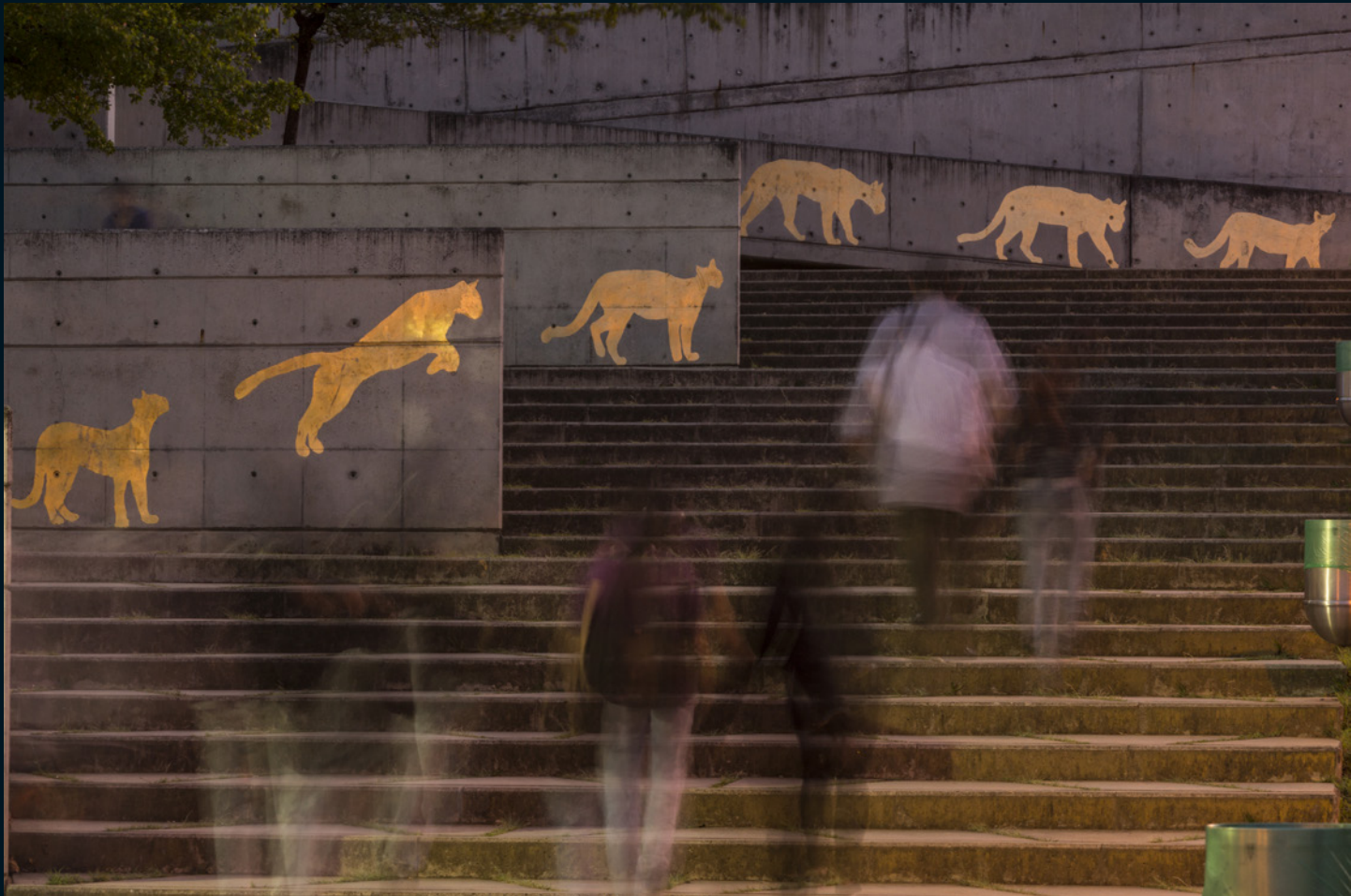
© Sara Herrera Fontán | "Aquí". Intervención en muros de la ciudad de Medellín | Laminilla de oro sobre concreto | 2013