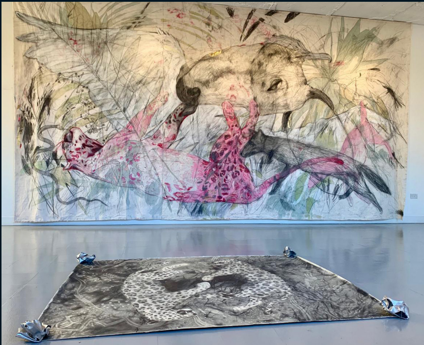
© Sara Herrera Fontán | Obra sin título. Exposición Umbral. Centro de Artes, Universidad EAFIT, Medellín, Colombia, 2018