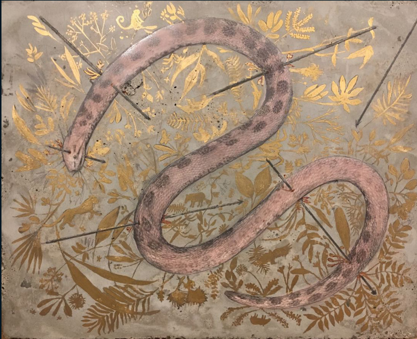
© Sara Herrera Fontán | Sin título | Técnica mixta sobre concreto | 18x23 cm | 2018