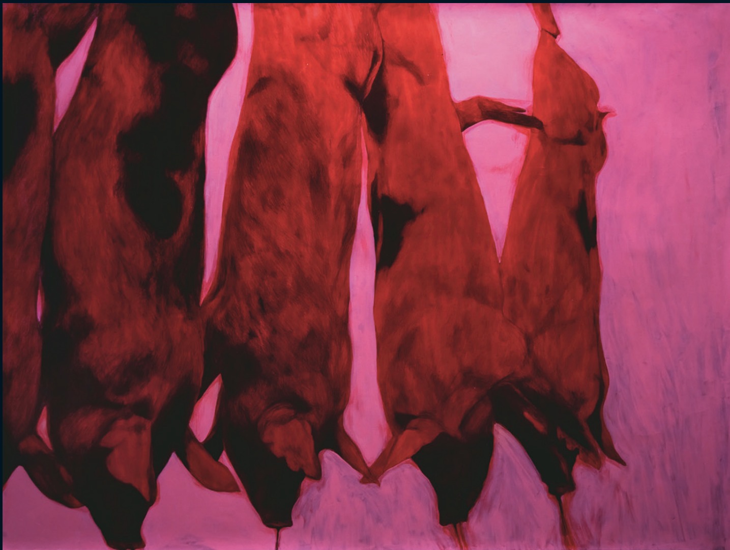
© Sara Herrera Fontán | No es color rosa | Técnica mixta sobre papel | 150x210 cm | 2010