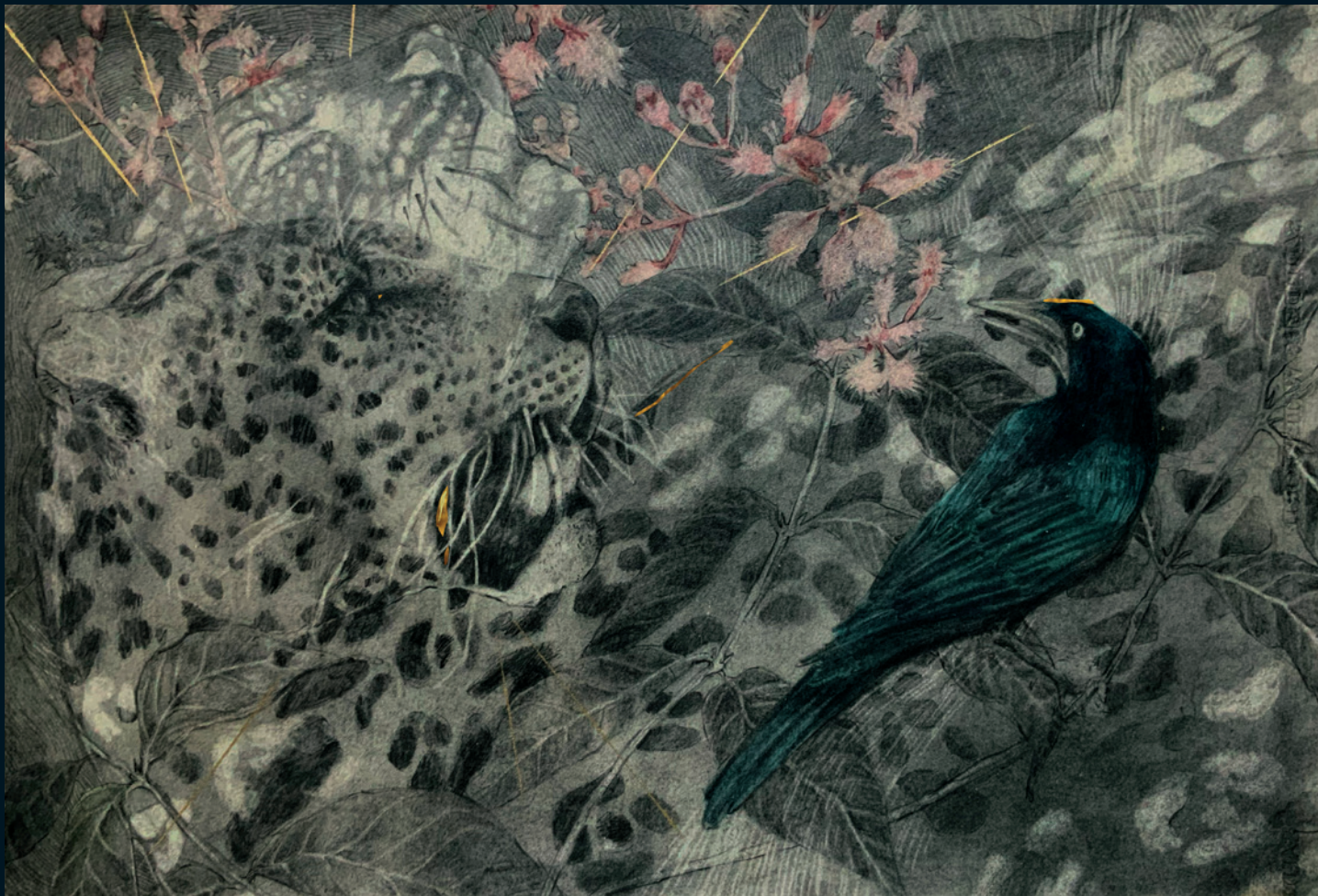
© Sara Herrera Fontán | Sin título | Grafito y acuarela sobre papel | 50X32 cm | 2022