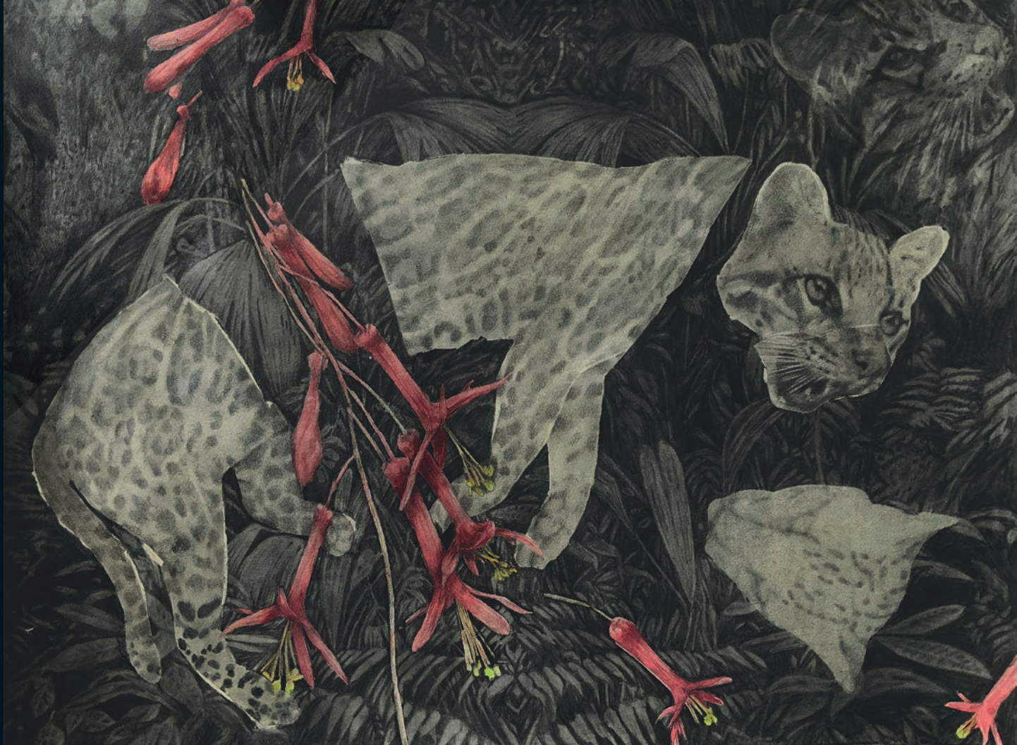
© Sara Herrera Fontán | Sin título | Boceto digital | 2023