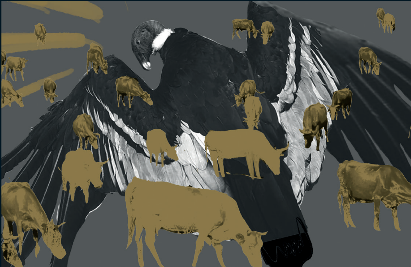
© Sara Herrera Fontán | Sin título | Boceto digital | 2023