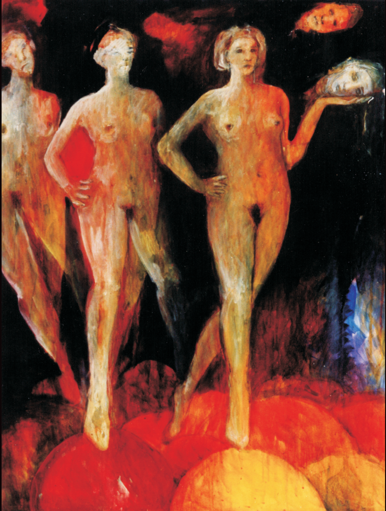
Mundos salomeicos. Tinta china y óleo sobre papel entelado, 100 x 70 cm, 2002.