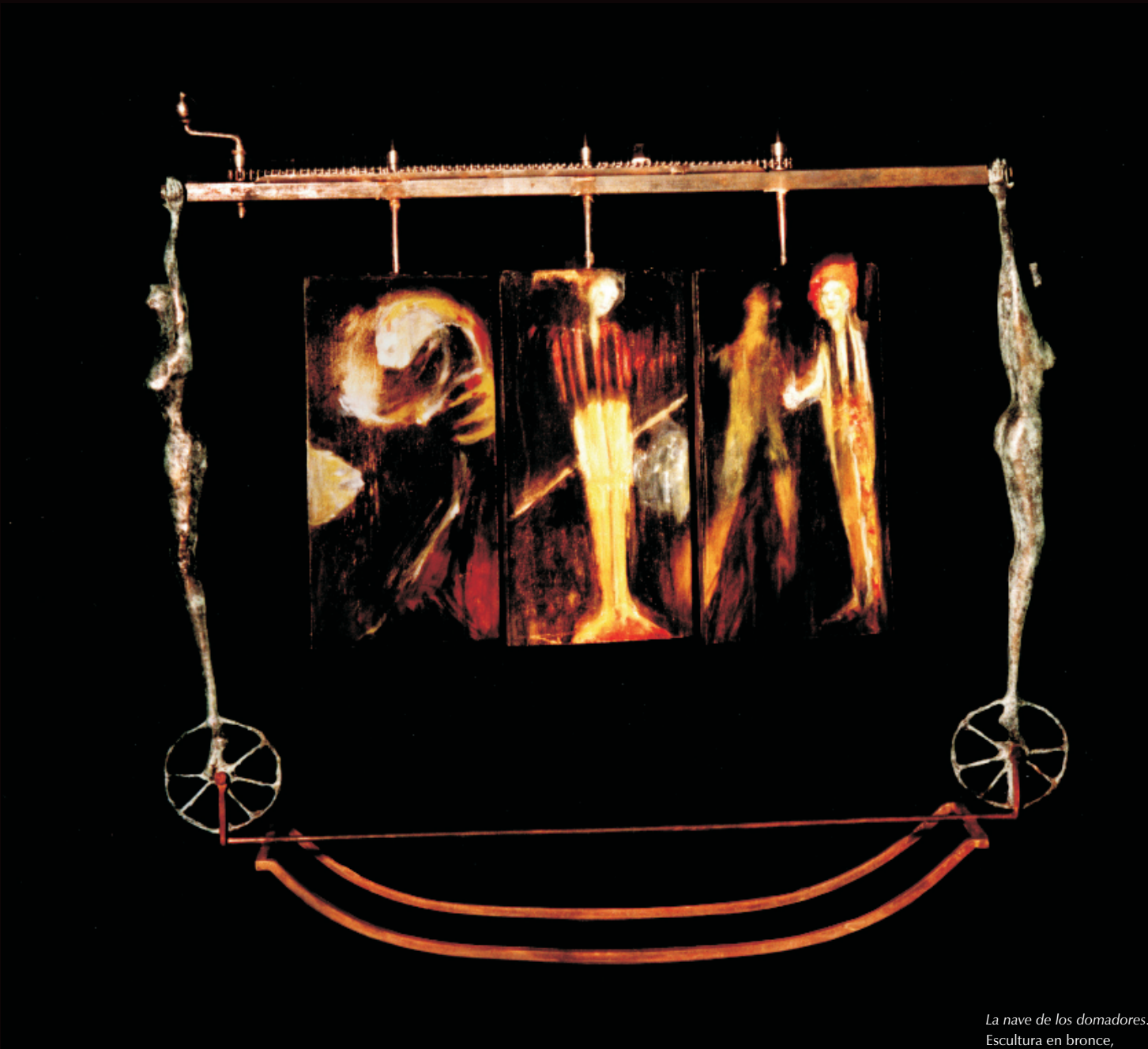
La nave de los domadores. Escultura en bronce, hierro y óleo, 76 x 80 x 20 cm, 2003.