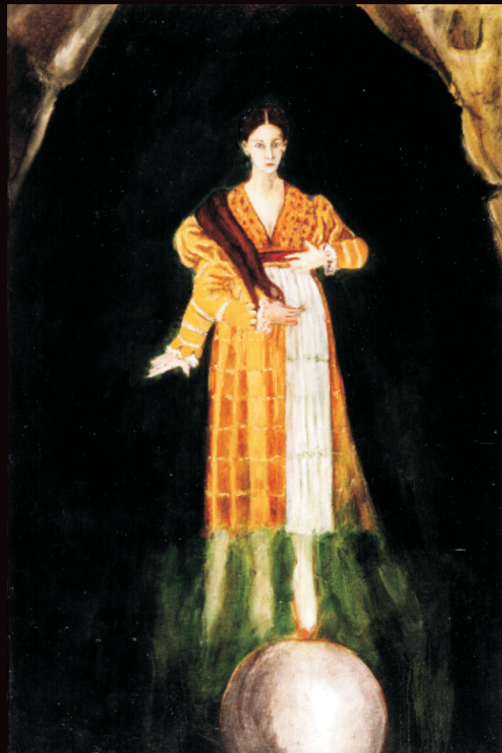
Parmigianino se anima (7). Óleo / tela, 100 x 70 cm, 2002.