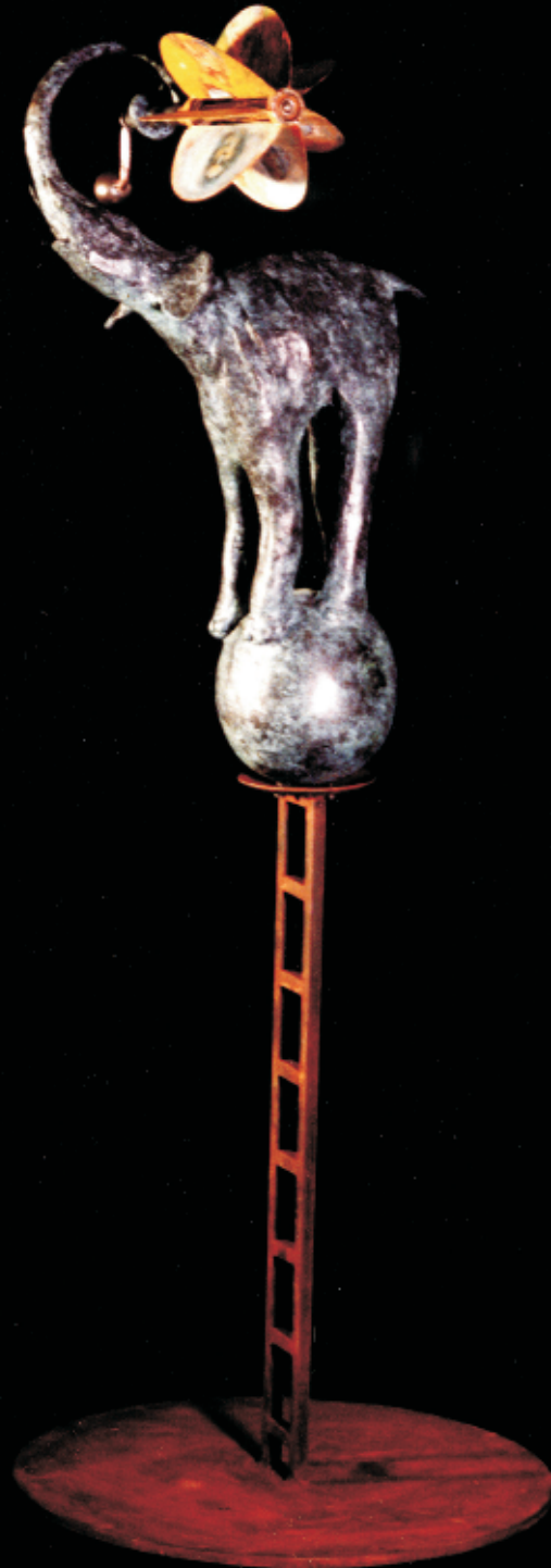
Elemanifante con molino amarillo. Escultura en bronce, hierro y óleo, 92 x 35 x 35 cm, 2003.