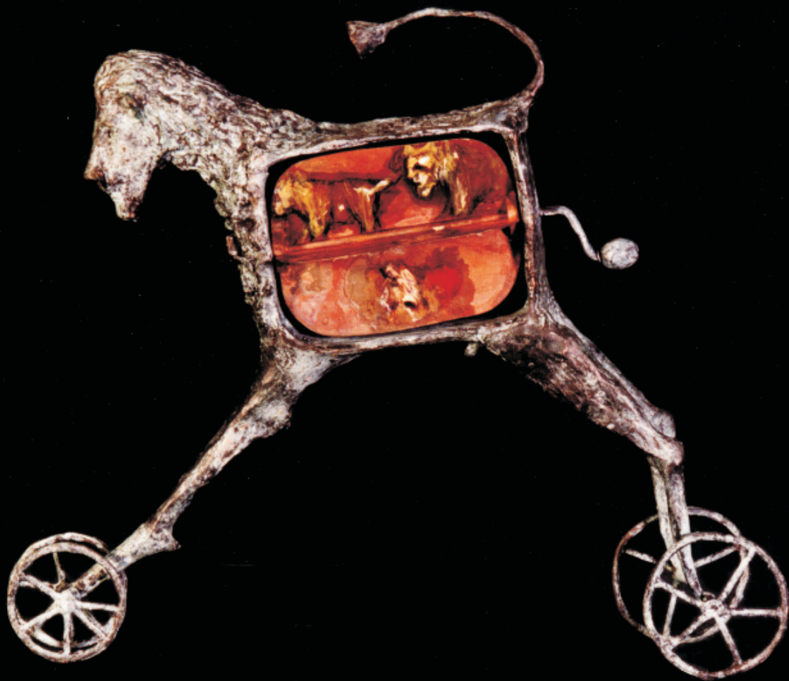
Leónvela. Escultura en bronce, hierro y óleo, 33 x 39 x 9 cm, 2003.