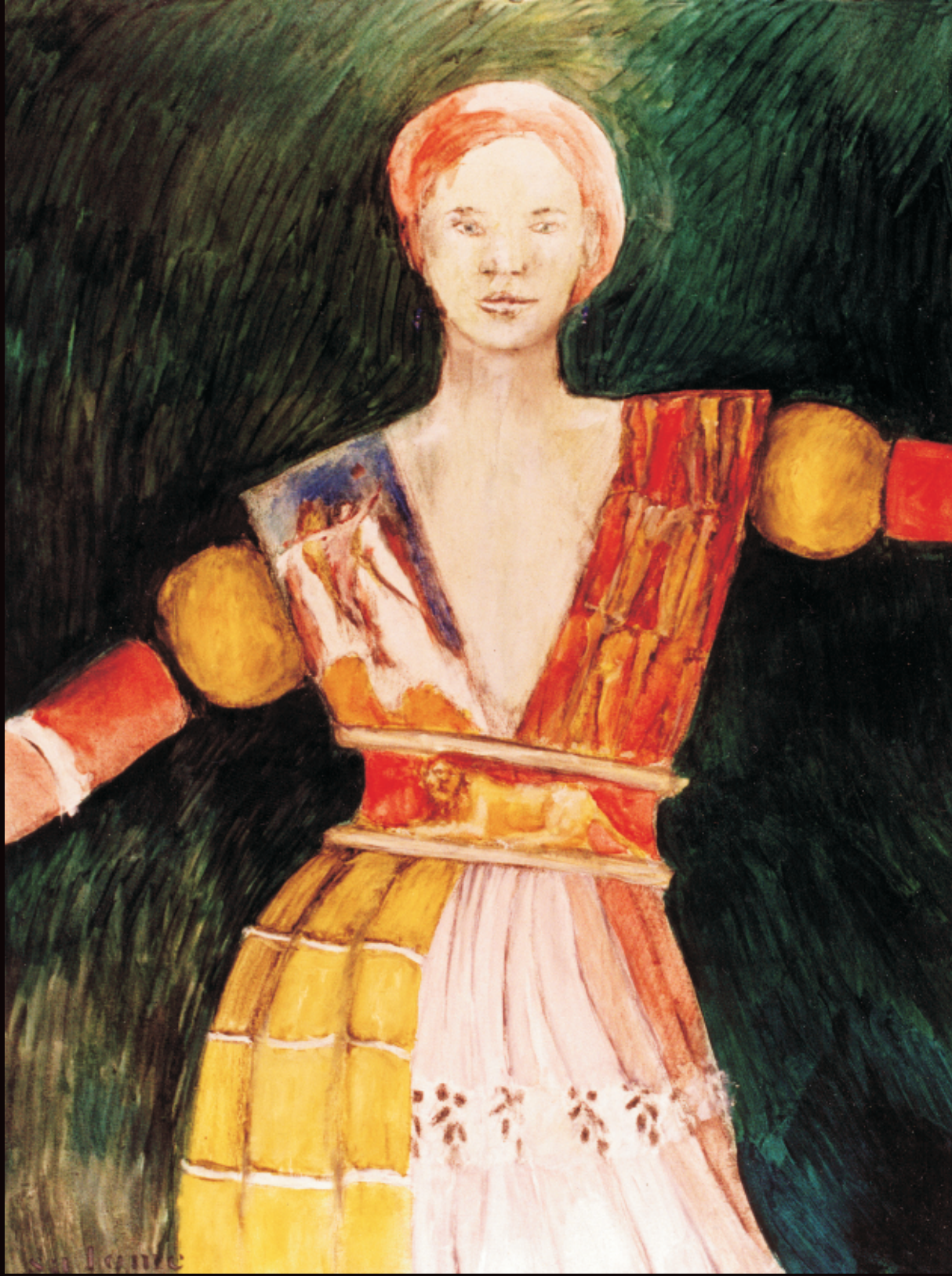
Parmigianino se anima (11). Óleo / tela, 100 x 70 cm, 2002.