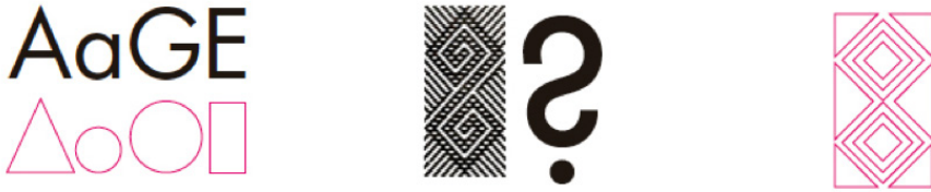
Imagen 4. Comparación de la estructura de la tipografía Futura y del uigsa oso s . Elaboración propia.

está inmerso y sobre eso proponer un diseño”. De esta manera, lo que pone de manifiesto es la posibilidad de entender el diseño como una herramienta para leer las estéticas indígenas y ser, finalmente, un campo también de intercambios interculturales.