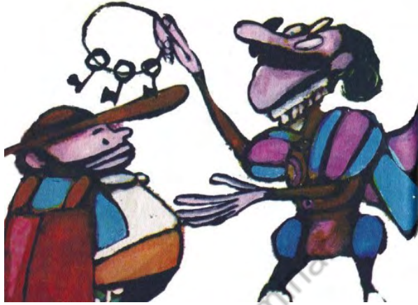
Imagen 21. Sin título. Aventuras de don Quijote. Edición homenaje Cuentos de Polidoro . Por Miguel de Cervantes Saavedra, adaptado por Cristina Gudiño Kieffer e ilustrado por Oscar Grillo, Ciudad Autónoma de Buenos Aires: Ministerio de Educación de la Nación, 2014, pág. 98.

las clases populares. Estas variables, en la década de 1970 estarían aún más potenciadas en ocasión de la segunda edición.