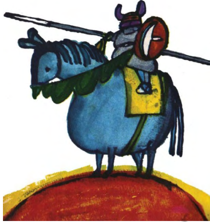
Imagen 35. Sin título. Aventuras de don Quijote. Edición homenaje Cuentos de Polidoro . Por Miguel de Cervantes Saavedra, adaptado por Cristina Gudiño Kieffer e ilustrado por Oscar Grillo, Ciudad Autónoma de Buenos Aires: Ministerio de Educación de la Nación, 2014, pág. 120.

Algo semejante ocurriría, por ejemplo, en el modo de plasmar las escenas de victoria de un paladín sobre otro (ver imágenes 36 y 37) y aquí los pasajes con representaciones de Sansón Carrasco en dos entregas diversas son bien ilustrativas de lo señalado anteriormente y, también, con el quiebre de planos y principios de horizontalidad en la representación para integrar los momentos en que, en determinadas aventuras, la acción progresa hacia el fracaso estrepitoso de los protagonistas: don Quijote revoleado por las aspas del molino; Sancho y su amo siendo sacudidos por las cataratas por donde se despeñará el barco encantado (imagen 38); o Rocinante echado boca arriba, con sus pezuñas apuntando al cielo (imagen 39) tras, según la versión infantil, haber sido arrojado al agua después de quedar malparado en la aventura de los rebaños de ovejas.