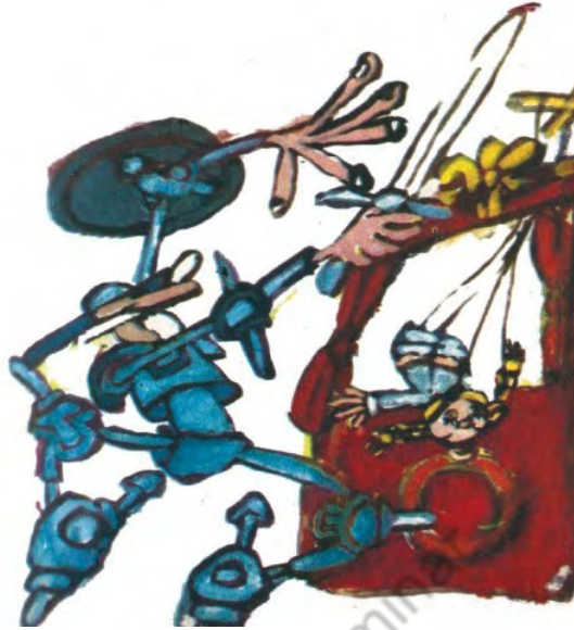
Imagen 46. Sin título. Aventuras de don Quijote . Edición homenaje Cuentos de Polidoro . Por Miguel de Cervantes Saavedra, adaptado por Cristina Gudiño Kieffer e ilustrado por Oscar Grillo, Ciudad Autónoma de Buenos Aires: Ministerio de Educación de la Nación, 2014, pág. 83.

Grillo, al igual que Gudiño Kieffer, fue un finísimo conocedor del Quijote . Y un aspecto que asombra, al compulsarse las ilustraciones que elabora para la aventura de los rebaños de ovejas, es cómo logra transmitir, con tres ilustraciones sobre la misma escena, las complejidades y magias narrativas que encerraba el texto. Pues el lugar en la cumbre desde el cual se contempla el paso de los rebaños (imagen 47) se complementa con una ilustración inversa en la cual, desde el llano, se registra el perfil a contraluz de los protagonistas en la distancia elevada (imagen 48). y a ello le suma, finalmente, la ilustración de las ovejas metamorfoseadas (imagen 49). Gracias a esas tres ilustraciones, toda la complejidad del perspectivismo autoral, junto con la puesta en entredicho de la noción de realidad son fácilmente transmitidas en imágenes.