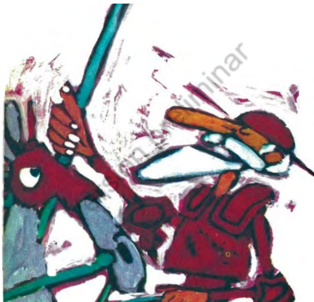
Imagen 30. Sin título. Aventuras de don Quijote. Edición homenaje Cuentos de Polidoro. Por Miguel de Cervantes Saavedra, adaptado por Cristina Gudiño Kieffer e ilustrado por Oscar Grillo, Ciudad Autónoma de Buenos Aires: Ministerio de Educación de la Nación, 2014, pág. 64.

reconocible o familiar el texto. Ello explicaría no solo la reiteración de imágenes de los protagonistas —algo que, en sí mismo, podría resultar previsible y perfectamente comprensible (imágenes 30 a 33, en las que se remarca que don Quijote debería ser un anciano de gran nariz y, además, con barba y bigote canoso, al tiempo que Sancho destaca por ser más bajo, gordo y de labios muy anchos)— sino también el apego a, por ejemplo, imágenes de caballeros cuya fisonomía, al estar homogéneamente armados, propendería a potenciar la intuición de que esa figura es, necesariamente, la de algún rival del paladín —como ocurre con el caballero de los Espejos y, más tarde, con el de la Blanca Luna (imágenes 34 a 35).