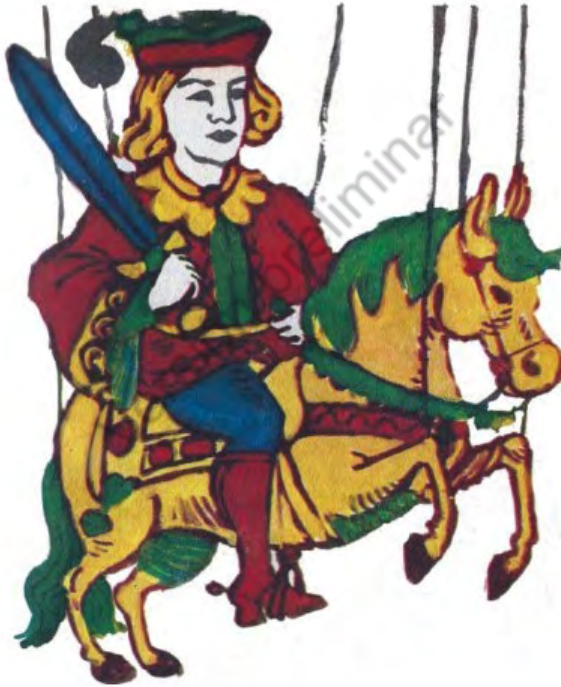
Imagen 43. Sin título. Aventuras de don Quijote. Edición homenaje Cuentos de Polidoro . Por Miguel de Cervantes Saavedra, adaptado por Cristina Gudiño Kieffer e ilustrado por Oscar Grillo, Ciudad Autónoma de Buenos Aires: Ministerio de Educación de la Nación, 2014, pág. 81.

En este eje de análisis, por otra parte, es de notarse cómo al tener que representar criaturas de ficción en el relato infantil —como ocurre cuando se narra la aventura del retablo— la representación de Gaiferos se aproxima, estéticamente, a una figura de la baraja española (imagen 43), estrategia icónica por medio de la cual se refuerza el reconocimiento de la recursividad literaria. Trazo que se diferencia, con claridad, cuando lo que se representa es cómo don Quijote contempla las penurias de Melisendra o lo que, ulteriormente, sobreviene cuando confunde los planos de realidad y ficción (imágenes 44, 45 y 46).