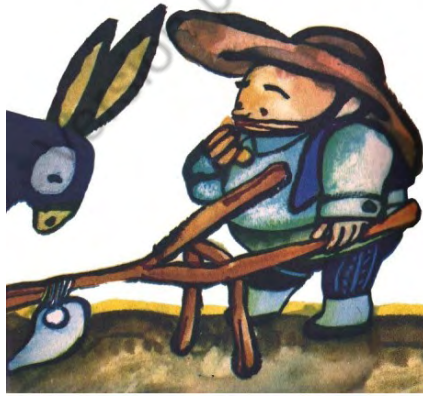
Imagen 27. Sin título. Aventuras de don Quijote. Edición homenaje Cuentos de Polidoro . Por Miguel de Cervantes Saavedra, adaptado por Cristina Gudiño Kieffer e ilustrado por Oscar Grillo, Ciudad Autónoma de Buenos Aires: Ministerio de Educación de la Nación, 2014, pág. 138.

Sancho sabe que extrañará las aventuras con su amo, pero se conforma con su mejor versión: ser un buen labrador. Es cierto que, en el momento de su reconversión, se señala que Sancho evalúa tanto buenos como malos