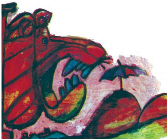
Imagen 12. Sin título. Aventuras de don Quijote. Edición homenaje Cuentos de Polidoro. Por Miguel de Cervantes Saavedra, adaptado por Cristina Guñiño Kieffer e ilustrado por Oscar Grillo, Ciudad Autónoma de Buenos Aires: Ministerio de Educación de la Nación, 2014, pág. 70.

Llama la atención, por otra parte, que el proceso de adaptación se aparte, en el empleo de animales para la fábula infantil, justo en aquella aventura en la cual, en el original cervantino un animal tiene un protagonismo notorio: el mono adivino de Maese Pedro. Y que, en la quinta entrega, la dedicada al gobierno de Barataria, las ilustraciones ambienten toda la trama en escenas donde perros y gatos acompañan a los humanos (imagen 13). Punto en el cual se advierte cómo la isotopía animal se mantiene, si el argumento del relato no lo facilita, en la serie icónica. Huelga precisar, finalmente, que en esta quinta entrega se clausurará el tiempo de la aventura en solitario por el acuerdo recíproco entre Sancho y su rucio (imagen 14) tal como, más adelante, se precisa.