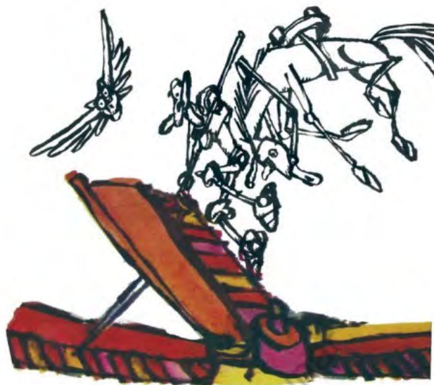
Imagen 4. Sin título. Aventuras de don Quijote. Edición homenaje Cuentos de Polidoro . Por Miguel de Cervantes Saavedra, adaptado por Cristina Gudiño Kieffer e ilustrado por Oscar Grillo, Ciudad Autónoma de Buenos Aires: Ministerio de Educación de la Nación, 2014, pág. 29.

Para la segunda entrega, titulada “La descomunal batalla de don Quijote”, se prioriza la recuperación de un eje temático básico de la fábula: la dinámica batalladora del personaje. Mas lo que asombra en este nuevo recorte es que no se revela limitada o constreñida por la concatenación de secuencias de los originales de 1605 y 1615 puesto que, ante la necesidad de seleccionar uno o dos combates que hagan emblemática la disposición a la lucha de don Quijote contra algún enemigo preciso, la adaptadora opta por abrir el relato con la batalla contra los rebaños de ovejas —de 1605— y cerrarlo con los pormenores de la aventura del Caballero de los Espejos —de 1615—. También importa destacar que, aunque no lo desarrolle como aventura, tal como sucede en el original, se glosará la anécdota del bálsamo devenido pomada mágica de Fierabrás (imagen 6).