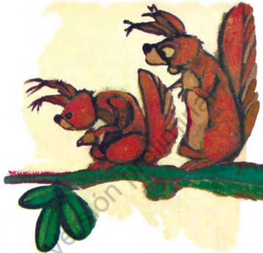
Imagen 8. Sin título. Aventuras de don Quijote. Edición homenaje Cuentos de Polidoro. Por Miguel de Cervantes Saavedra, adaptado por Cristina Gudiño Kieffer e ilustrado por Oscar Grillo, Ciudad Autónoma de Buenos Aires: Ministerio de Educación de la Nación, 2014, pág. 55.

-No te metas, estas son cosas de caballeros andantes. ¡Que se arreglen solos! (53)