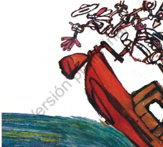
Imagen 38. Sin título. Aventuras de don Quijote . Edición homenaje Cuentos de Polidoro . Por Miguel de Cervantes Saavedra, adaptado por Cristina Gudiño Kieffer e ilustrado por Oscar Grillo, Ciudad Autónoma de Buenos Aires: Ministerio de Educación de la Nación, 2014, pág. 79.

Se constata, también, el respeto de la expectativa lectora infantil de que los protagonistas resulten visualmente únicos, de forma tal que en el caso de don Quijote siempre se reiterará su fisonomía avejentada junto con una combinación no siempre equilibrada de ingenuidad y desborde emotivo; mientras que, en el caso de Sancho, se recalca su rusticidad y, sobre todo, su sobrepeso. Estos datos persiguen, en las diversas ilustraciones, potenciar el carácter afable, simpático y bonachón del escudero, al tiempo que se refuerza la empatía por un protagonista cuya interpretación como un adulto infantilizado resulta plausible.