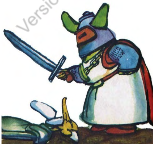
Imagen 37. Sin título. Aventuras de don Quijote. Edición homenaje Cuentos de Polidoro. Por Miguel de Cervantes Saavedra, adaptado por Cristina Gudiño Kieffer e ilustrado por Oscar Grillo, Ciudad Autónoma de Buenos Aires: Ministerio de Educación de la Nación, 2014, pág.