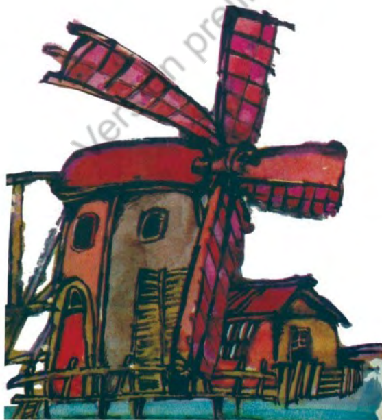
Imagen 3. Sin título. Aventuras de don Quijote. Edición homenaje Cuentos de Polidoro. Por Miguel de Cervantes Saavedra, adaptado por Cristina Gudiño Kieffer e ilustrado por Oscar Grillo, Ciudad Autónoma de Buenos Aires: Ministerio de Educación de la Nación, 2014, pág. 28.

Ahora bien, ¿cómo resultó reorganizado el Quijote para las seis entregas que el CEAL ideó para los Cuentos de Polidoro ? ¿Cómo se realizó la tarea de focalización de contenidos argumentales? El primer indicio lo brindan, con claridad, los títulos elegidos para cada entrega. El primero de ellos, “El mundo de don Quijote”, es evidentemente el más complejo puesto que, al realizar la presentación del personaje, los ejes básicos de su caracterización anímica, al igual que la de Sancho Panza, fuerzan a Gudiño Kieffer a optar por una de las múltiples aventuras que se podrían haber elegido para ejemplificar el proceder extraviado del protagonista. Y, como es de esperar, la atención narrativa recae en la aventura de los molinos de viento (imágenes 3 y 4). Cabe resaltar que para cohesionar el perfilado de paladín enamorado, la entrega cierra con una secuencia en la cual don Quijote sueña la carta que habrá de escribirle a su enamorada Dulcinea (imagen 5).