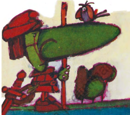
Imagen 40. Sin título. Aventuras de don Quijote . Edición homenaje Cuentos de Polidoro . Por Miguel de Cervantes Saavedra, adaptado por Cristina Gudiño Kieffer e ilustrado por Oscar Grillo, Ciudad Autónoma de Buenos Aires: Ministerio de Educación de la Nación, 2014, pág. 50.

refiere que Sancho participa de un banquete en casa de los duques, en el cual la duquesa trasunta seriedad y rigidez que refuerzan el recuerdo de la dignidad otra que la engalana (imagen 41), al tiempo que una señora gorda que interpela al escudero resulta grotescamente figurada y exacerbada en sus dimensiones (imagen 42).