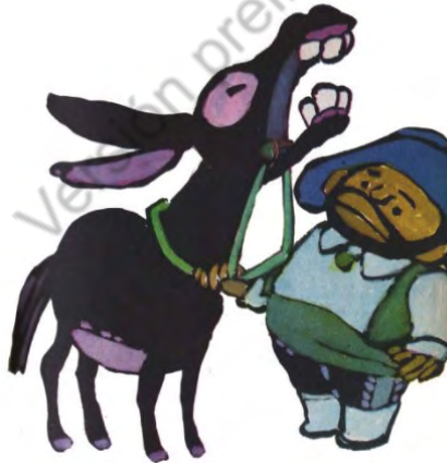
Imagen 14. Sin título. Aventuras de don Quijote. Edición homenaje Cuentos de Polidoro . Por Miguel de Cervantes Saavedra, adaptado por Cristina Gudiño Kieffer e ilustrado por Oscar Grillo, Ciudad Autónoma de Buenos Aires: Ministerio de Educación de la Nación, 2014, pág. 113.

Y esta misma sintonía entre humanos protagonistas y animales volveremos a encontrarla en la secuencia que habilitará la clausura de la gesta, puesto que el momento decisivo del postrer desafío del caballero de la Blanca Luna concitará la atención de todos los vivientes en derredor: