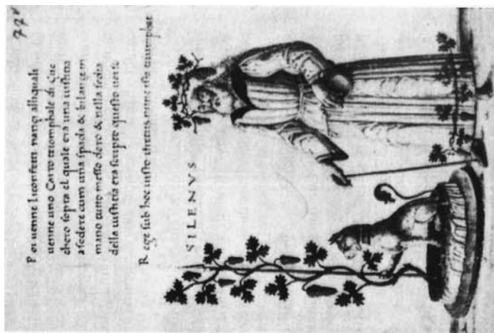
Figura 1. Baco. Cod. Vat. Urb. lat. 899. Reprodução tomada de Warburg 2013, 69.