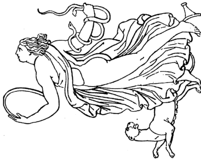
Figura 2. Ménade dançante de um baixo-relevo neo-ático. Reprodução tomada de Warburg 2004, 50.