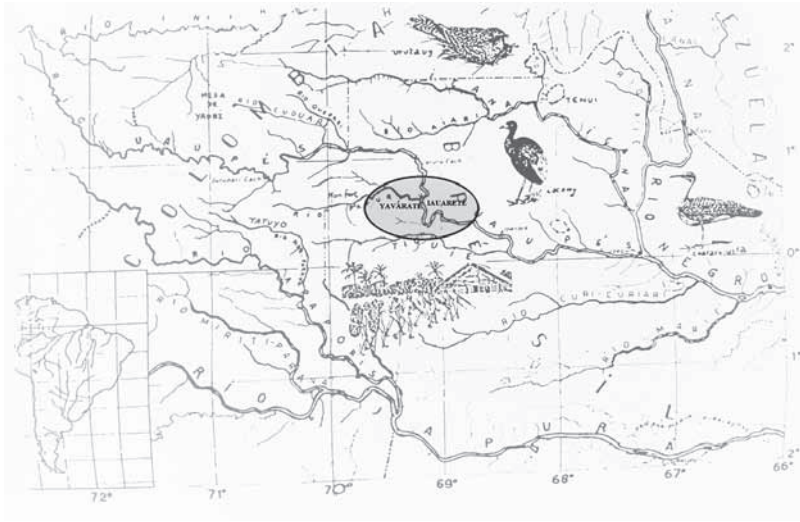
Figura 3. Medeiros 2002, 386. 15

(A mãe do protagonista de Rosa também é uma sereia amazônica, Iara; Toosa , o título do livro projetado e nunca publicado, acima mencionado, é também o nome de uma sereia mítica). Ainda poderiam ser enunciadas muitas outras coisas sobre esse mito deslumbrante, mas prefiro, por enquanto, dizer algo sobre os lugares da sua vigência (figura 3).