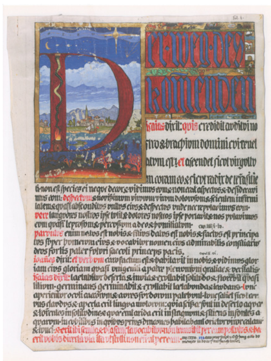
Figura 3. Carl Gustav Jung. El libro rojo . Liber primus. Fol. i, r.

El propio Jung lo catalogó como su trabajo más importante y es, por cierto, la obra medular de su pensamiento, en la que se encuentran los fundamentos de su trabajo teórico posterior (Nante 87). No obstante, cumpliendo con la voluntad de su autor, la familia de Jung lo mantuvo reservado de la esfera pública, hasta que en el año 2009 se decidió publicarlo por primera vez, en una edición facsimilar que reproduce el asombroso carácter del manuscrito original. 10