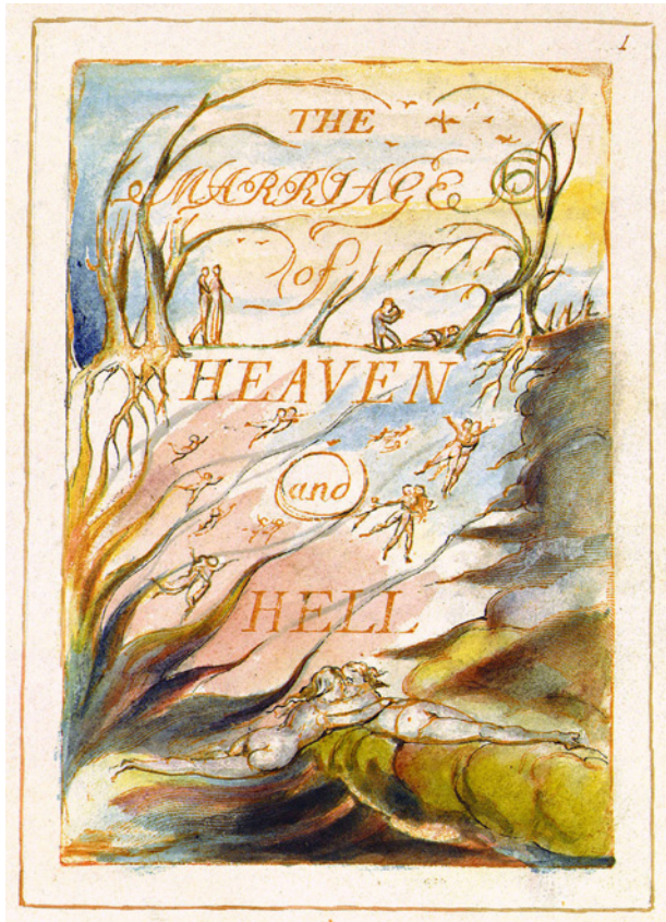
Figura 2. William Blake. El Matrimonio del Cielo y el Infierno , 1, 1790.

En este pasaje, el visionario asocia directamente la transmutación de la materia, concretamente de un metal, el cobre, con la transformación de la percepción en visión, vinculando estrechamente el proceso de ejecución artística con una experiencia interior, gracias a que la manipulación de los materiales se concibe como un vehículo de perfección del espíritu, como en una operación alquímica. El ejercicio de la imaginación, entonces, permite suprimir “la idea de que el hombre tiene un cuerpo distinto a su alma”; es decir, superar la oposición entre la materia y el espíritu, gracias a la actividad del grabador, que, al sumergir las planchas de cobre en el ácido, “borra las superficies engañosas” del metal y permite que emerja la “perfección latente” que “yace oscura” en la naturaleza.