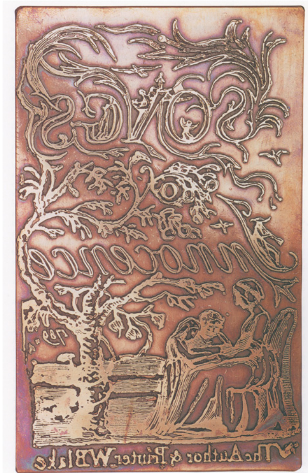
Figura 1. Reproducción de una plancha de cobre de la portada de los Cantos de Inocencia , de William Blake, realizada por Michael Phillips, 2015.

es: infinito. Pues el hombre se ha confinado a sí mismo hasta solamente poder ver las cosas a través de los estrechos resquicios de su caverna. (Blake, Libros I 105 ) 5