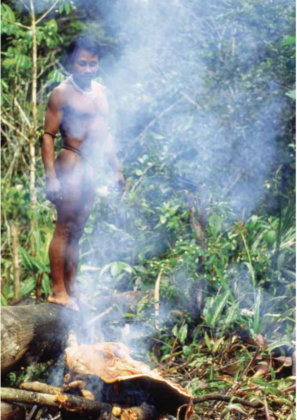
AHUMANDO CARNE DE DANTA.