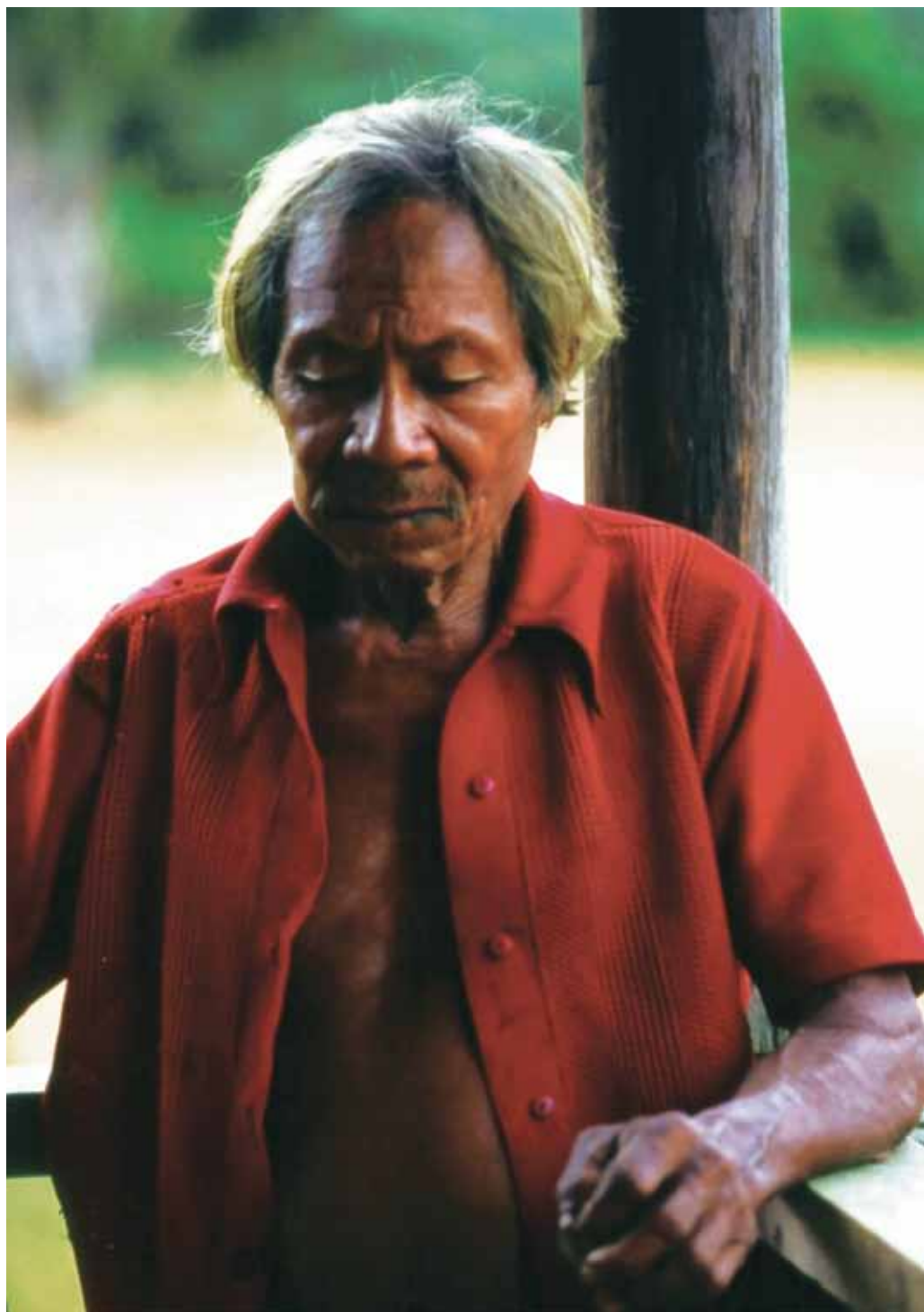
EL CHAMÁN RECORDANDO EPISODIOS MÍTICOS.