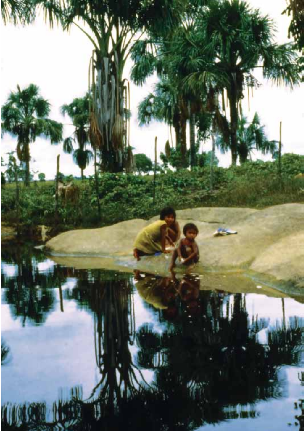
LOS NIÑOS QUE FULGURAN ENTRE LOS NEGROS RÍOS AMAZÓNICOS.