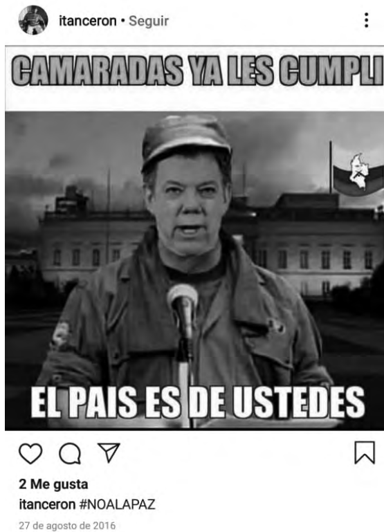
Figura 3. Captura de meme de Santos vestido como guerrillero diciendo “camaradas, el país es de ustedes”, hace referencia a la idea de que Santos le iba a “entregar el país a las FARC”