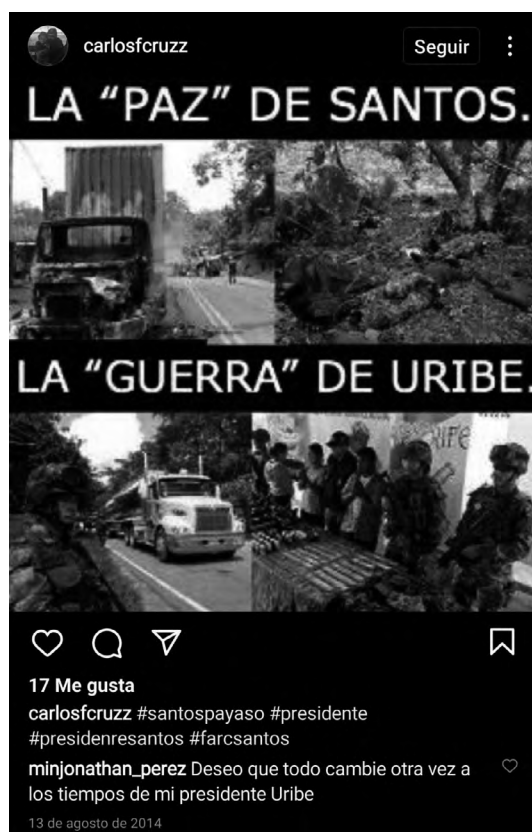
Figura 4. Captura de pantalla de un meme publicado en Instagram en agosto de 2014, dos años antes de la votación del plebiscito, pero a tan solo seis días después de haberse posesionado Santos para su segundo mandato

Este meme expresa los imaginarios de guerra y paz desde la perspectiva del uribismo.