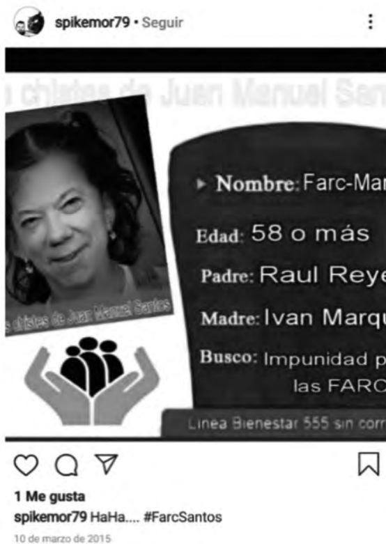
Figura 9. Meme que insinúa la pertenencia de Santos a las FARC