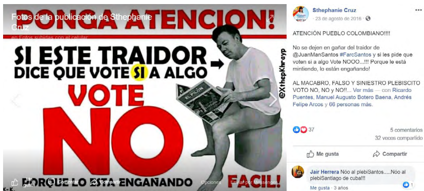
Figura 10. Captura de pantalla de un meme a favor del No

La imagen parece un instructivo o propaganda más tradicional que un meme.