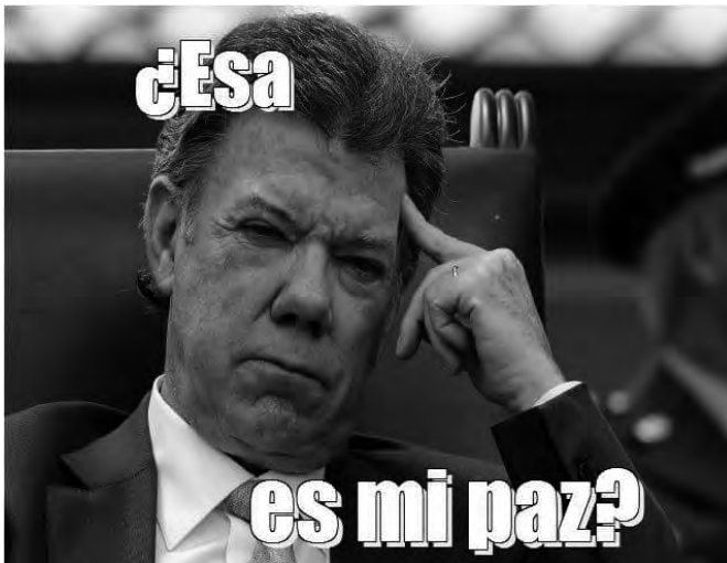
Figura 5. Meme compuesto por la foto de Juan Manuel Santos con cara pensativa y el texto “¿Esa” en la parte superior y “es mi paz?” en la parte inferior

Este meme hace referencia a la famosa frase del uribismo “¿Esta es la paz de Santos?” pregunta realizada de manera irónica como forma de crítica a la manera en la que se estaba llevando el proceso de paz.