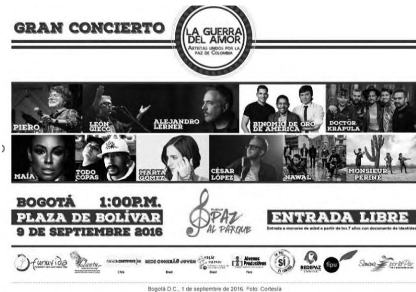
Figura 6. Cartel de un concierto por la paz llamado “La guerra del amor: artistas unidos por la paz de Colombia” publicado en la página de la Consejería para los Derechos Humanos de la Presidencia de la República el 1 de septiembre de 2016