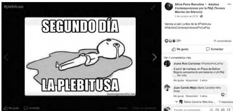
Figura 12. Captura de pantalla de un meme sobre la “plebitusa”