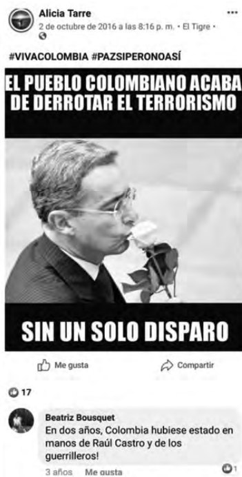
Figura 13. Captura de pantalla de una publicación propagandística sobre los resultados del plebiscito