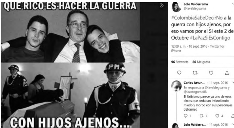
Figura 7. Meme compuesto de dos fotos distintas y dos líneas de texto, una arriba y otra abajo

La foto de de arriba muestra a Álvaro Uribe Vélez con sus dos hijos y el texto encima de su fotografía dice: “que bonito es hacer la guerra”. En la fotografía de abajo, la cual se compone de un velorio militar, el texto debajo dice: “con hijos ajenos”.