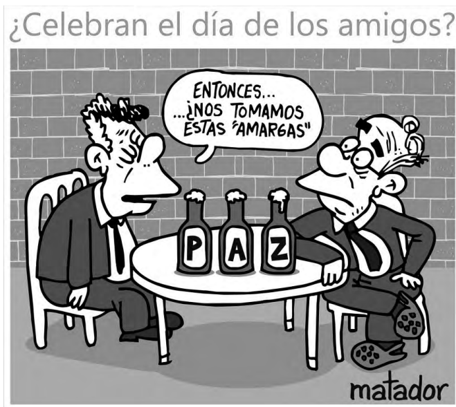
Figura 8. Caricatura política del famoso artista Matador