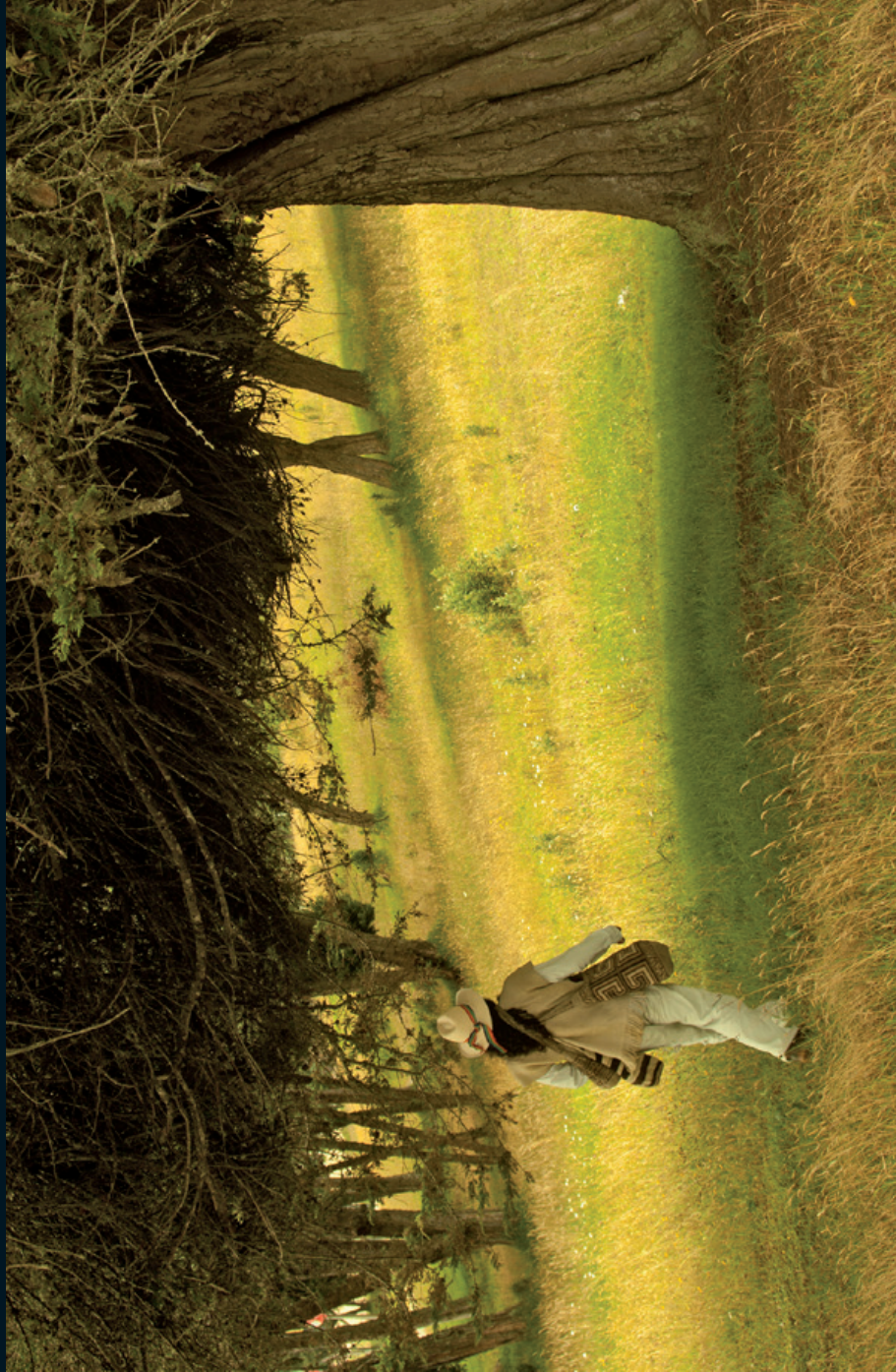
Fotografía 20. Entrega de pagos en el Valle de Saquenzipa, Boyacá