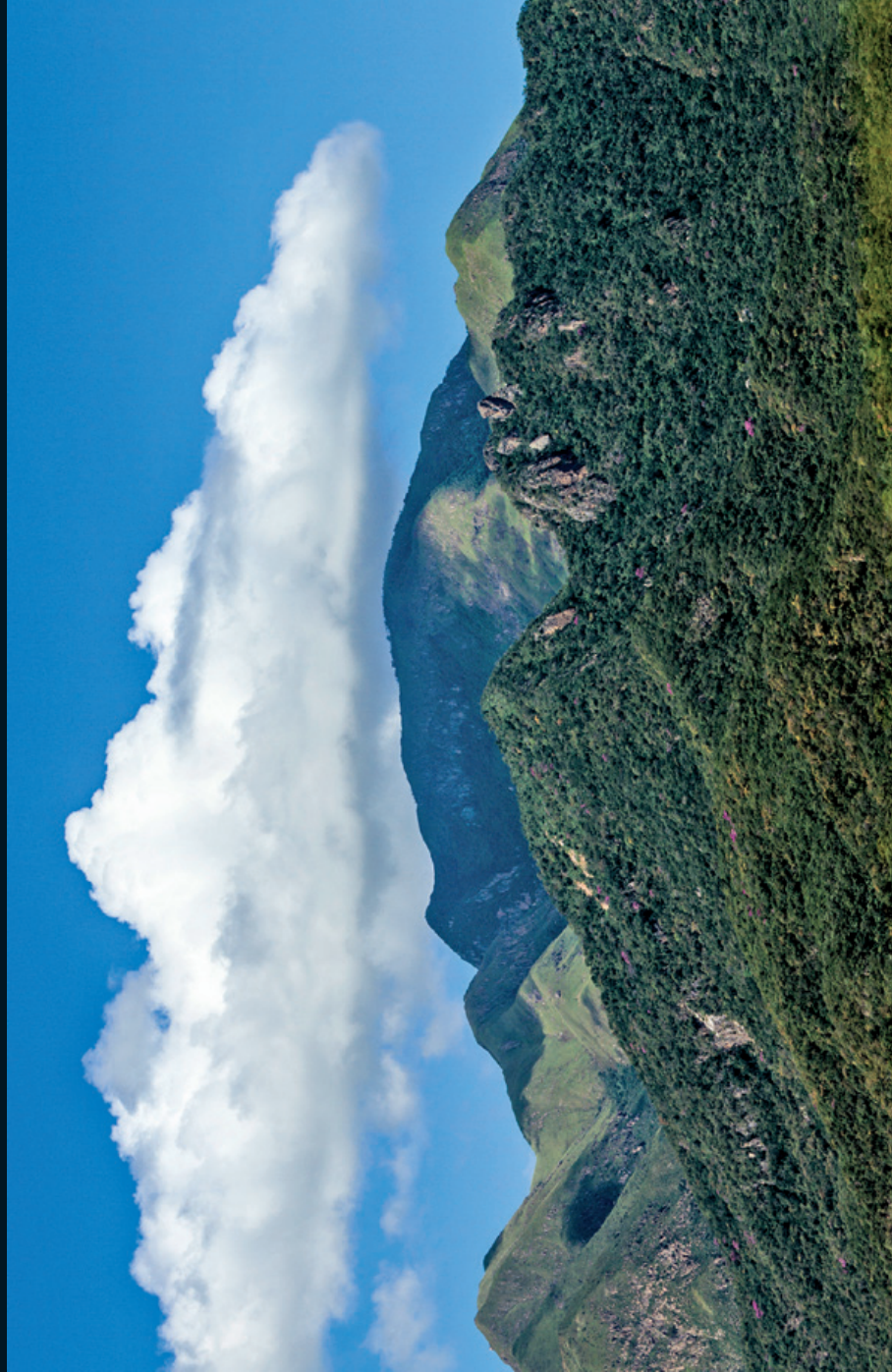
Fotografía 3. Cerro sagrado en el frente oriente de la Sierra Nevada de Santa Marta, Cesar