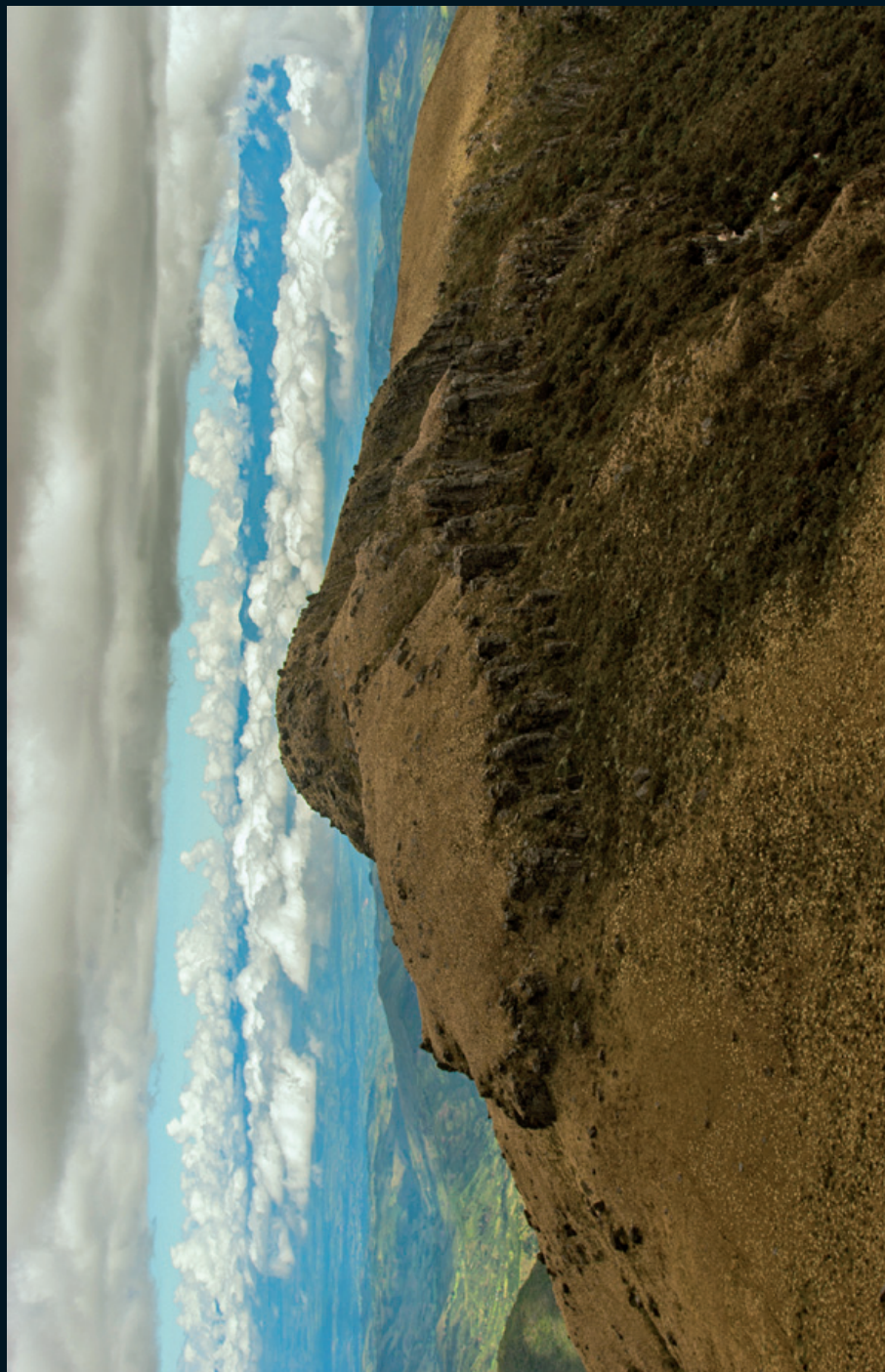
Fotografía 6. Vista al cerro más alto del territorio de Guambía, Cauca