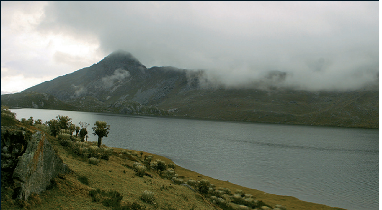
Fotografía 13. Laguna Grande de Los Verdes. Sierra Nevada de Guicán Cocuy, Boyacá