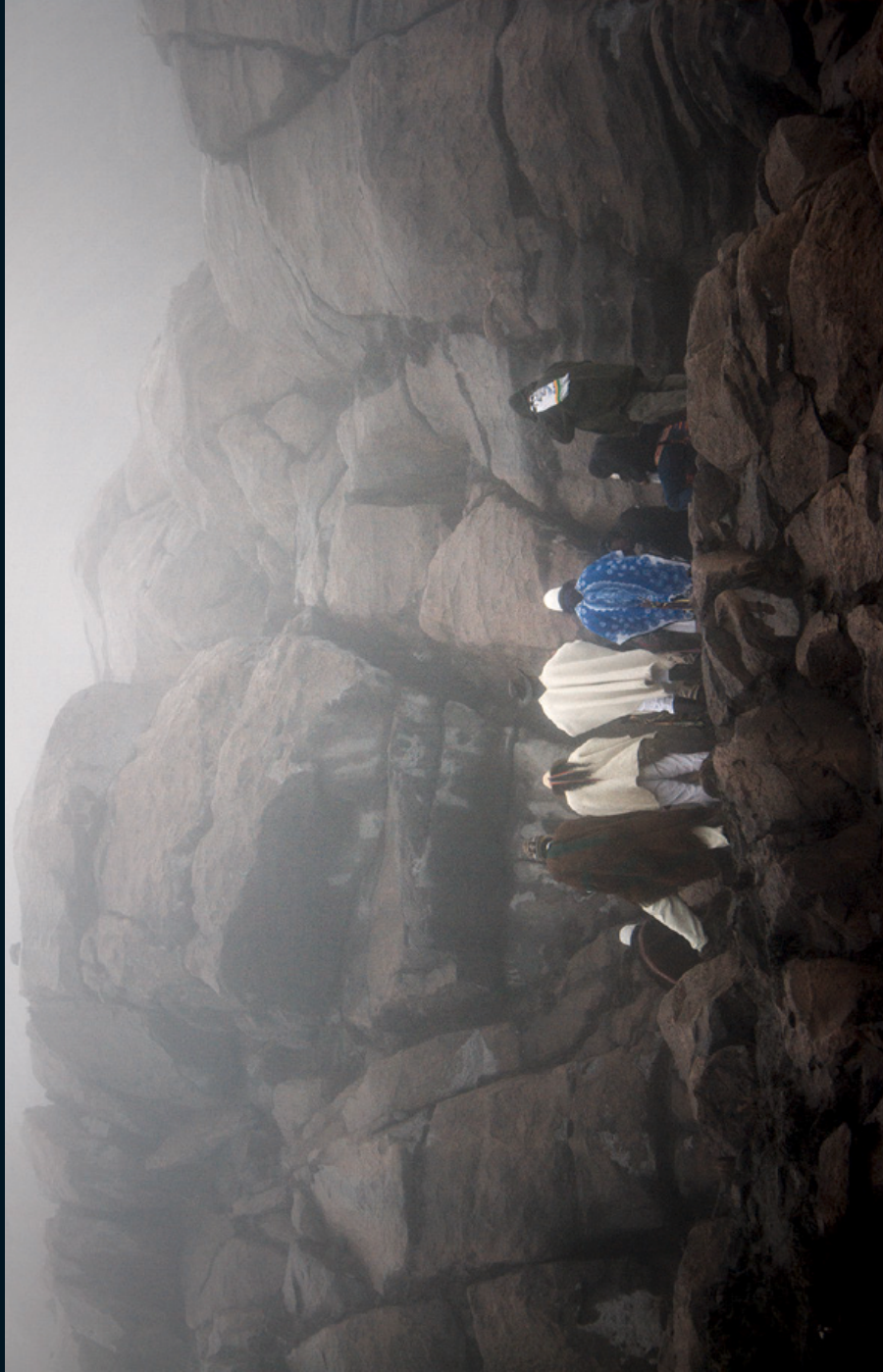
Fotografía 8. Ritual de sanación del territorio. Nevado del Ruíz (Kumanday), Caldas