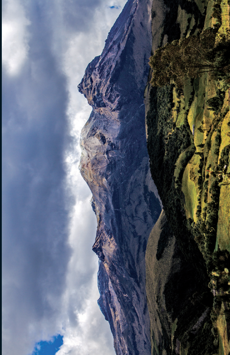
Fotografía 9. Vista al volcán Cumbal, desde el reguado indígena de Panan, Nariño