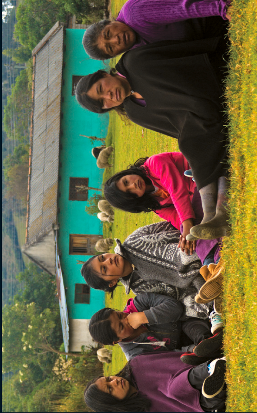
Fotografía 10. Familia del pueblo indígena de Los Pastos participando de un círculo de la palabra. Panan, Nariño