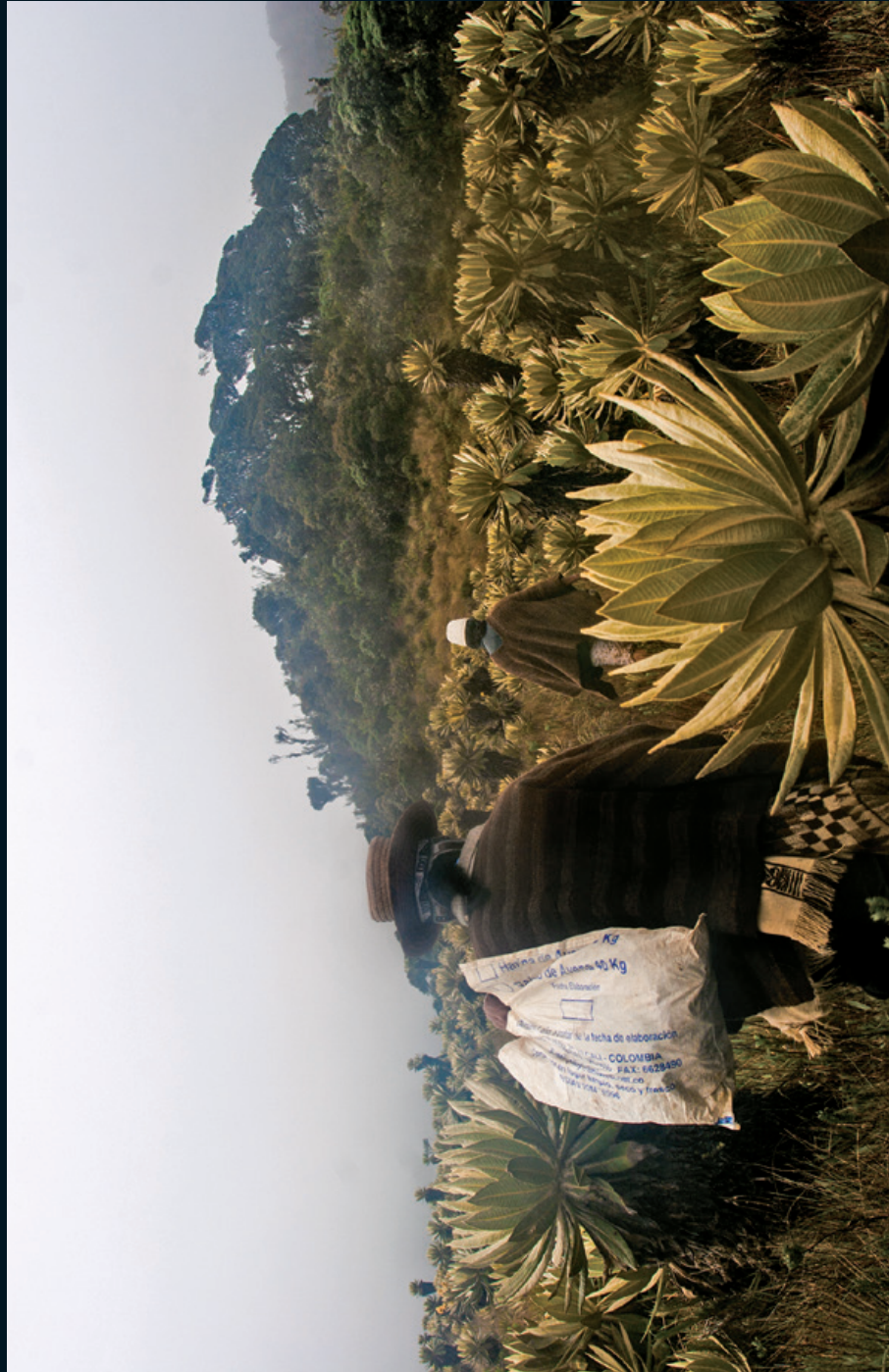
Fotografía 4. Entrega de pagos. Laguna San Rafael, Estación Tálaga, Huila