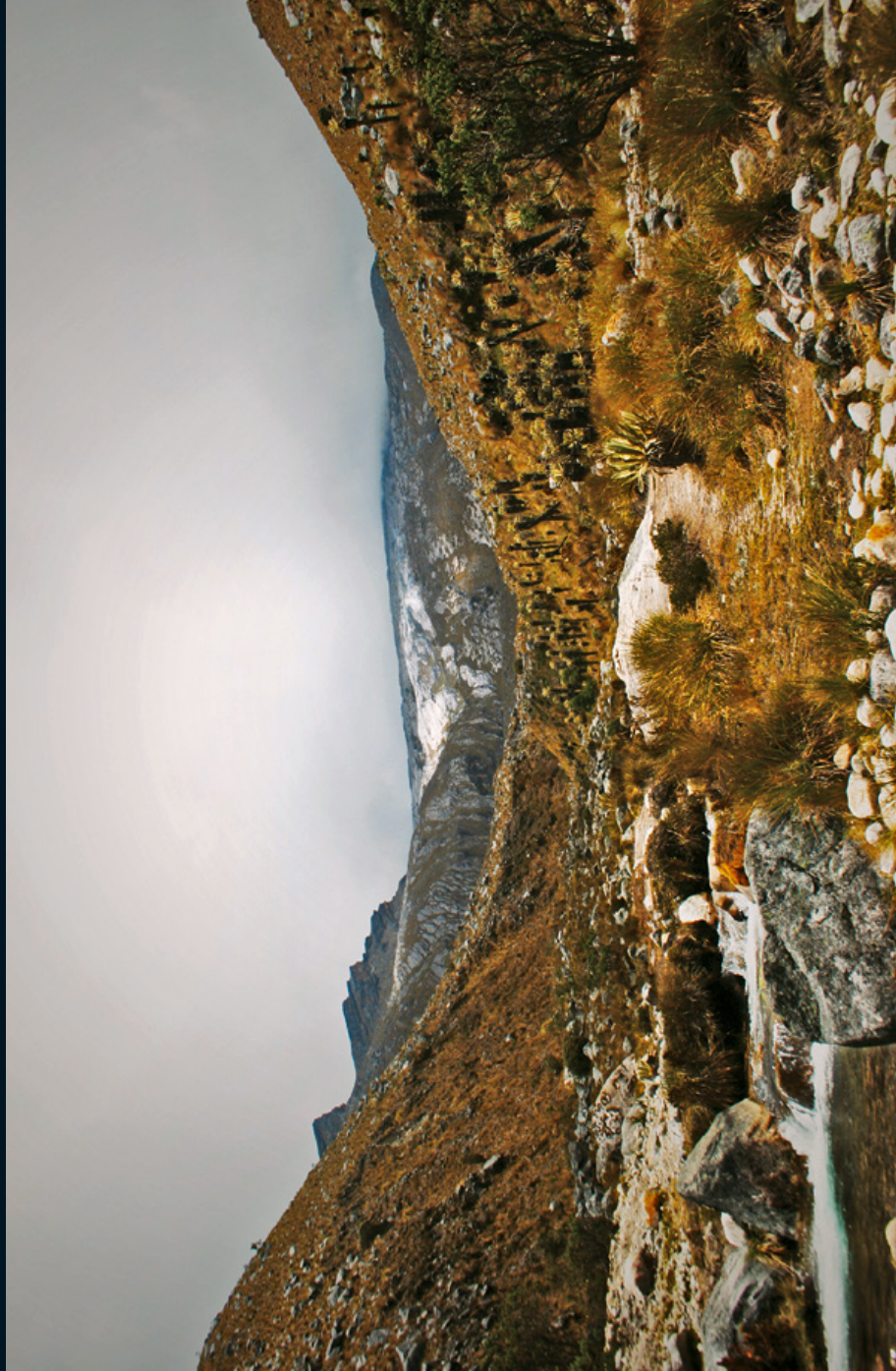
Fotografía 18. Vista del frente norte de la Sierra Nevada de Guicán Cocuy, Boyacá