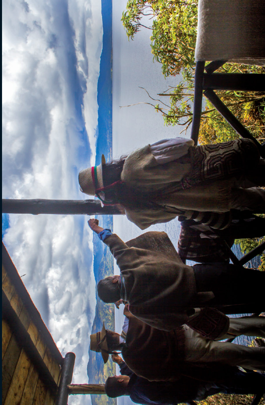
Fotografía 25. Ritual de sanación del territorio en la Laguna de La Cocha, Nariño