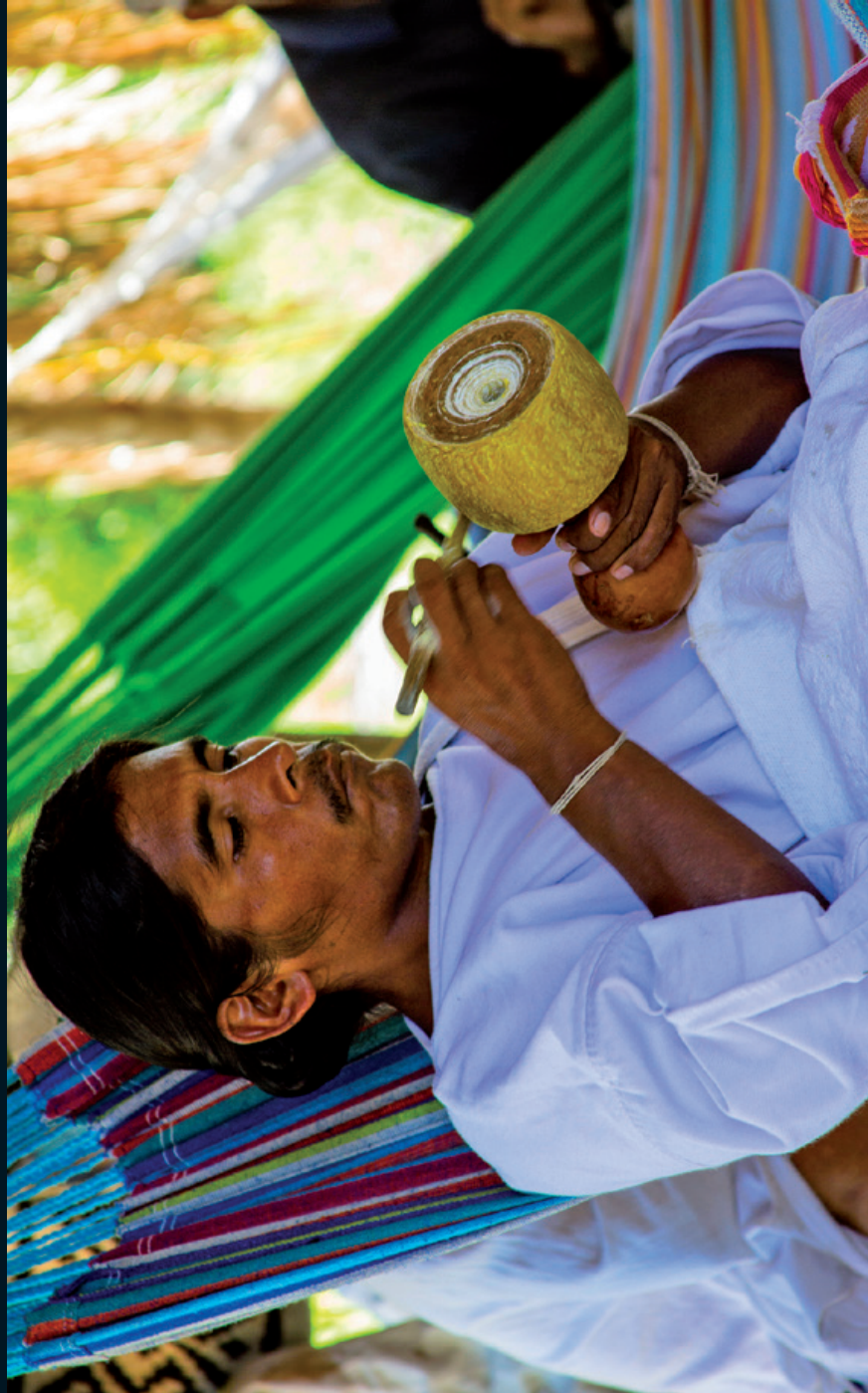
Fotografía 17. Mamo wiwa en círculo de la palabra. Frente norte de la Sierra Nevada de Santa Marta, Guajira