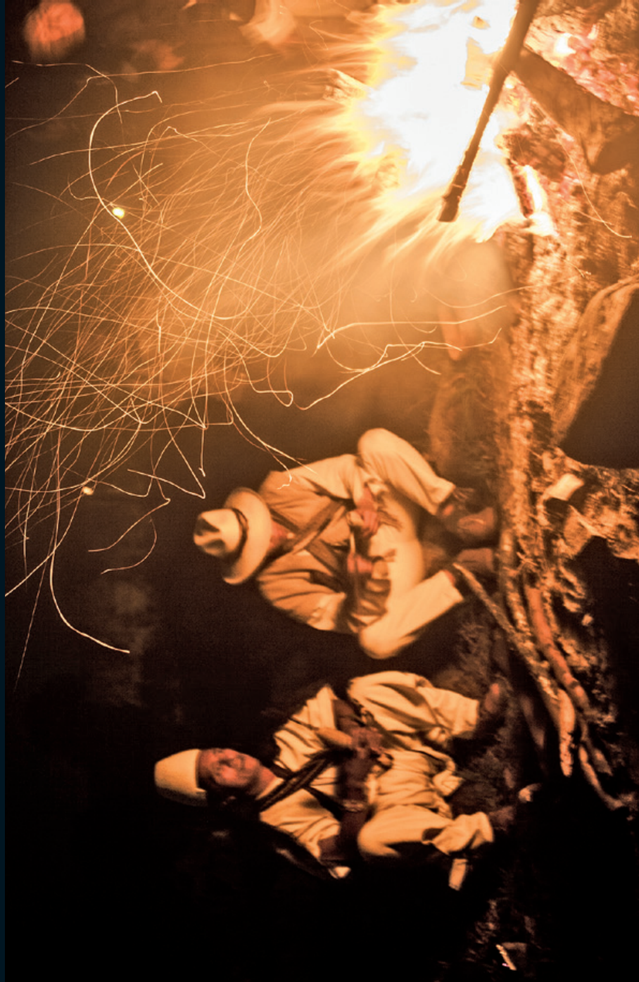
Fotografía 11. Círculo de la palabra. Valle de Saquenzipa, Boyacá