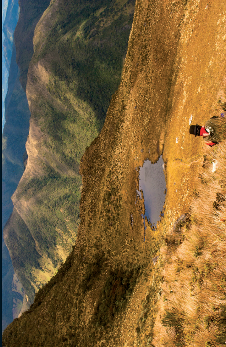
Fotografía 7. Entrega de pagos en la Laguna El Abejorro. Guambía, Cauca