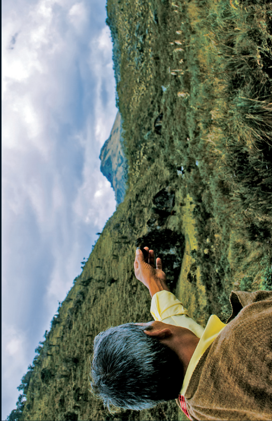
Fotografía 2. Entrega de pagamentos. Tierradentro, Huila