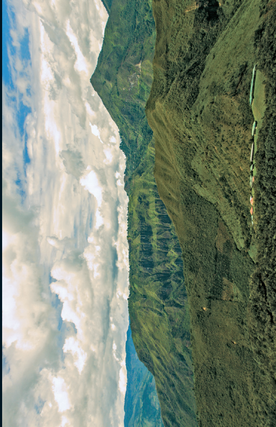
Fotografía 21. Vista de los hipogeos y cerro sagrado de Tierradentro. Inzá, Cauca