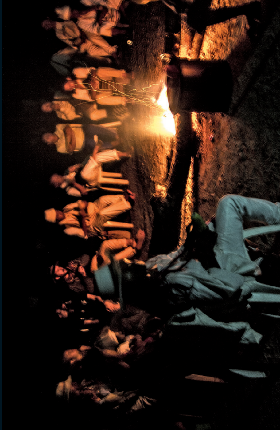
Fotografía 26. Círculo de la palabra. Sierra Nevada de Santa Marta, Guajira