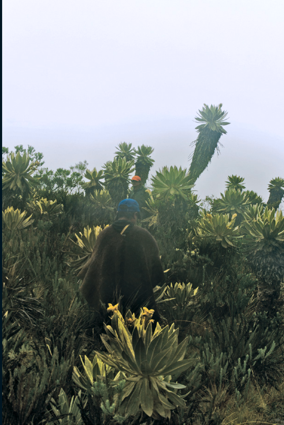
Fotografía 23. Huarjayos u'wa, camino a la Laguna San Rafael. Estación Tálaga, Huila