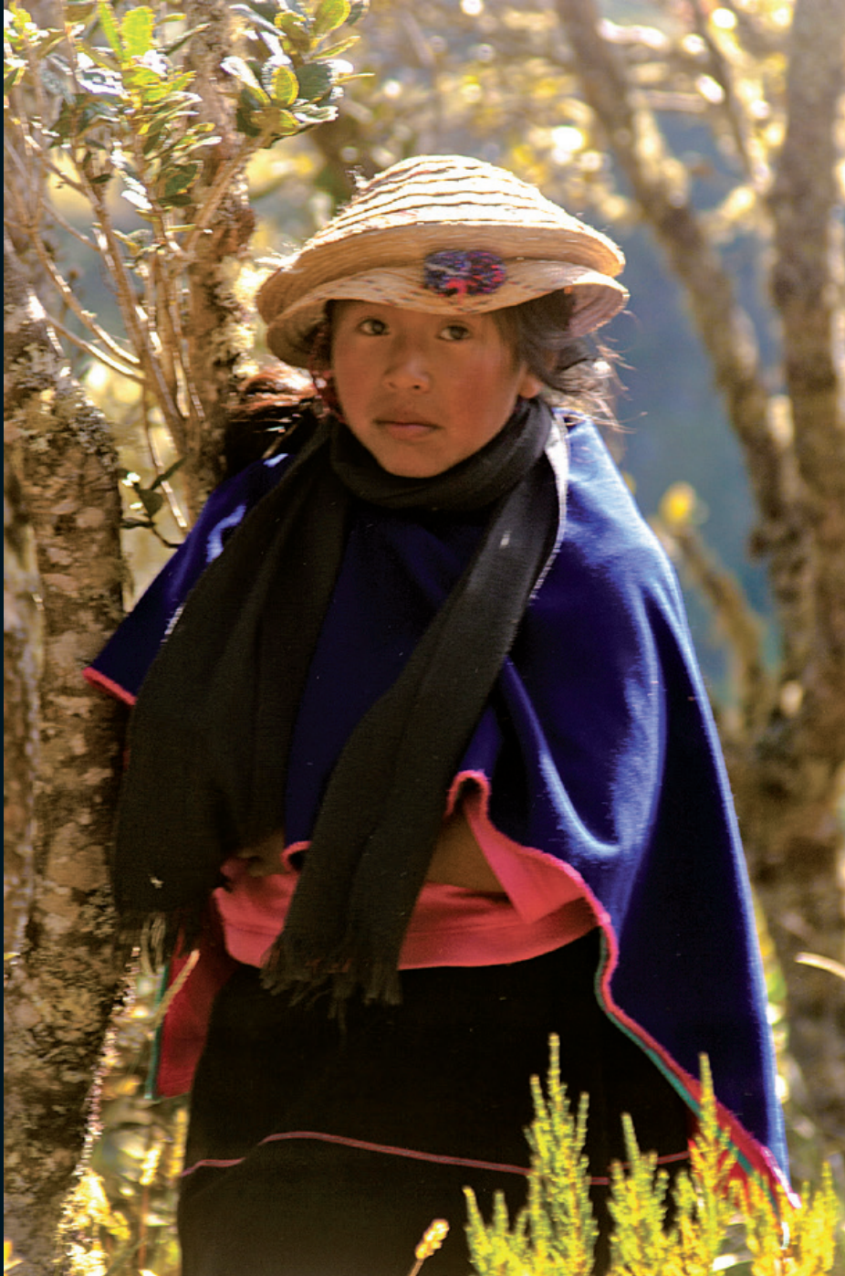
Fotografía 22. Niña guambiana rumbo a la Laguna El Abejorro. Guambía, Cauca