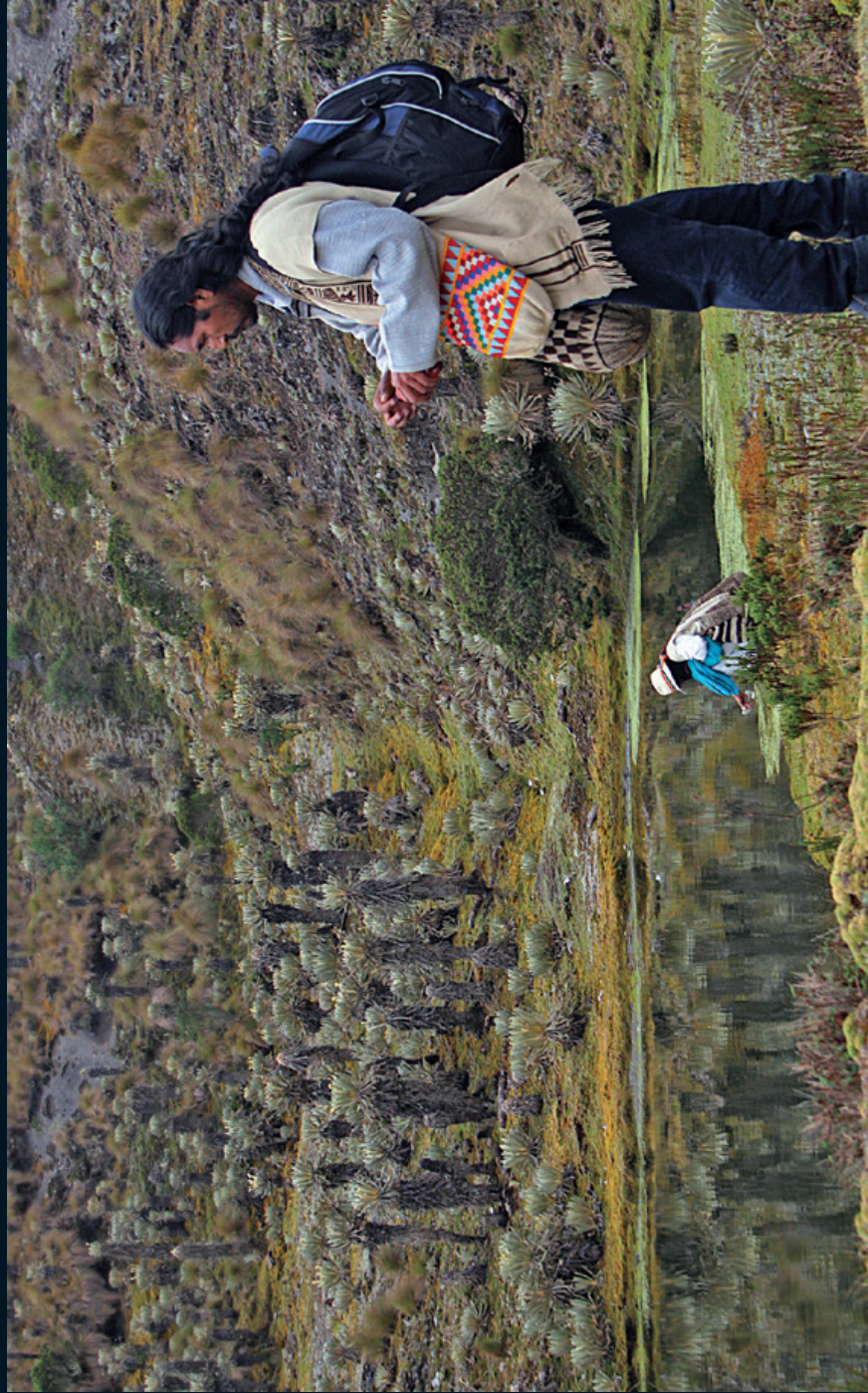
Fotografía 5. Entrega de pagos en el camino hacia la Laguna Grande de Los Verdes. Sierra Nevada de Guicán Cocuy, Boyacá