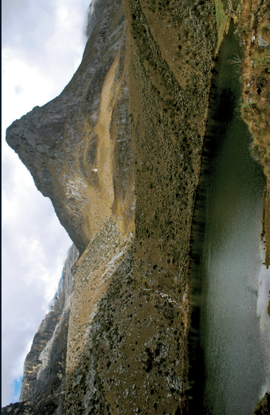
Fotografía 24. Vista de Lagunillas. Sierra Nevada de Guicán Cocuy, Boyacá