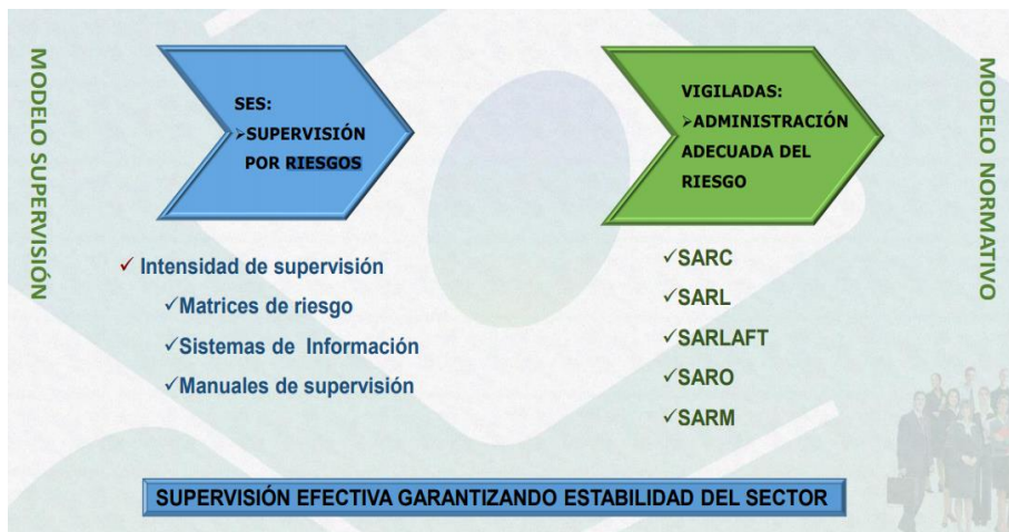
Figura 1. Retos supervisión basada en riesgos.

Solidaria Dr. Héctor Raúl Ruiz Velandia, en el encuentro solidario realizado en la ciudad de Manizales el 27 de octubre de 2017, da a conocer uno de los pilares principales de Supersolidaria, en donde informa el paso de una supervisión de cumplimiento a una supervisión basada en riesgos, y enfatiza en los sistemas de administración que las entidades de economía solidaria deberán cumplir por normativa, para que la supervisión y la entidad supervisada tengan todo reglamentado de acuerdo al modelo de supervisión como se muestra en la Figura No. 1.