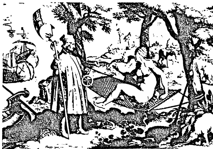
Theodor Galle: Desembarco de Américo Vespucio en América Grabado en cobre, según la obra de Johannes Stradanus (1534-1616)