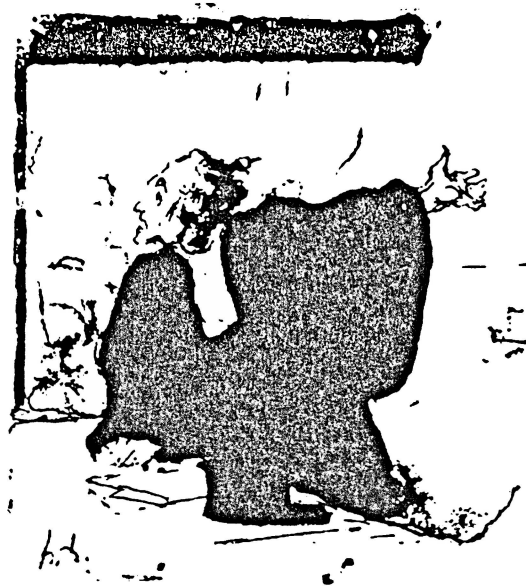
Un Gran Gesto, 1843 - 1846, Daumier.

Analíticos: Enlace de sujeto y predicado es pensado con identidad. "Todos los cuerpos son extensos". Son de tipo explicativo.