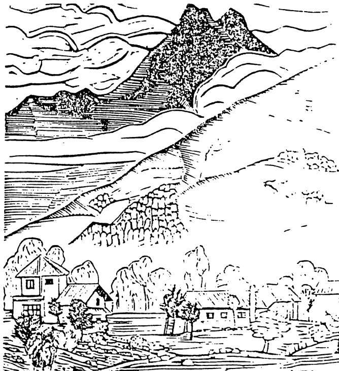
Paisaje de Fusagasuga, 1934, Gonzalo Ariza

No quiero decir que visiones humanistas hayan estado o estén por completo alejadas del discurso de la ciencia económica, pero, por ejemplo, Hirschman o Schumacher no son precisamente los autores obligados en los cursos de teoría