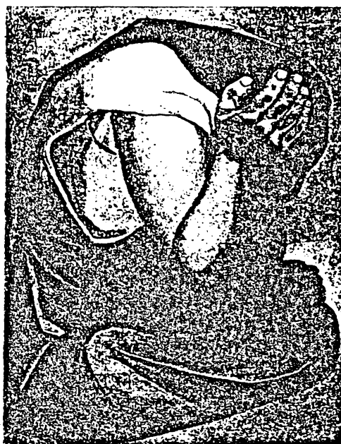
Llanto, Eduardo Kingman

Ya en nuestro siglo, Gadamer señala a Heidegger como renovador de la hermenéutica, el cual enfocará el problema de la comprensión hacia la "existencia", que es la comprensión del ser. Para Heidegger la hermenéutica no significa tanto "arte interpretativo," como el intento de determinar la esencia de la interpretación a partir de la "hermenéutica de la existencia", la cual se interpreta a sí misma en el mundo y en la historia.(8)