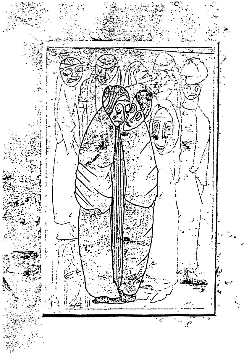
Grabado de la Mesquita, Bruno Ernst

Además, mientras el escolar tenga el mismo conocimiento que su intérprete, no requiere del arte de la interpretación, por la confianza depositada en él, pero a medida que aumenta el caudal de conocimientos