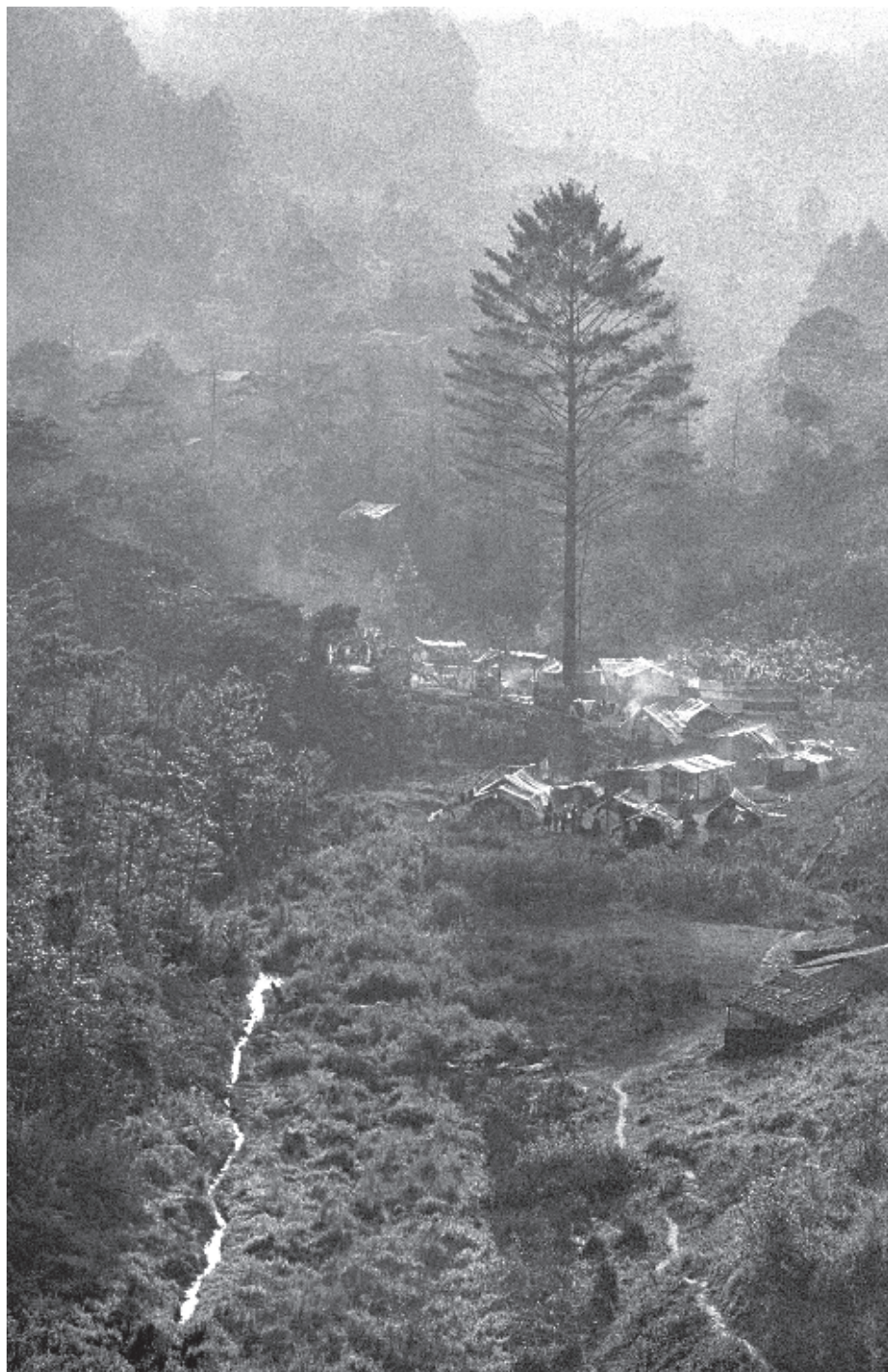
SEBASTIÃO SALGADO, Campamentos de indígenas desplazados en Polhó . Chiapas, México 1998. Cortesía de FOTOMUSEO—Bogotá.