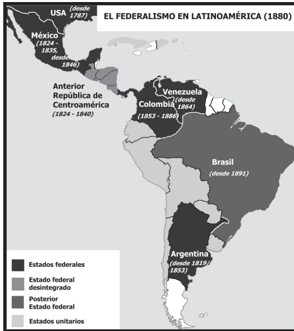
Img. 5 117

Hasta entonces se ha presentado el caso de Colombia como un ejemplo de la política de descentralización del alto liberalismo de la generación de 1848 en Hispanoamérica. Del mismo modo, todas las otras repúblicas del continente que adoptaron el liberalismo radical, introdujeron o profundizaron el federalismo. La república vecina de Venezuela