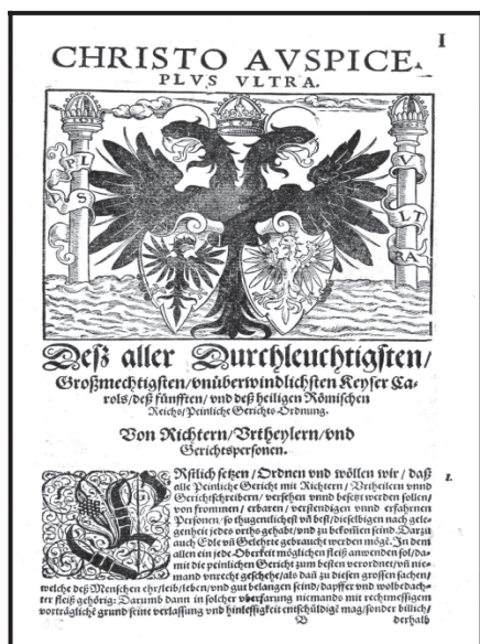
La Constitutio Criminalis Carolina de 1532 según una impresión de 1577 41 .

La base para evaluar la calidad jurídica de los procesos de brujería que tuvieron lugar, entre 1678 y 1680, en el condado imperial de Hohenems-Vaduz, fue la Constitutio Criminalis Carolina de 1532, es decir, la ley penal y procesal del Sacro Imperio Romano Germánico. Aunque esta ley criminalizó la hechicería, no se trató de un mero texto oscuro, sino también de la ley penal más moderna de la Europa de esta época con un alto grado de sistematización, un buen nivel dogmático y una multitud de garantías para la seguridad de los involucrados. Un buen ejemplo de la modernidad relativa de la Constitutio Criminalis Carolina , puede reconocerse en el delito de adulterio, donde se rompió con