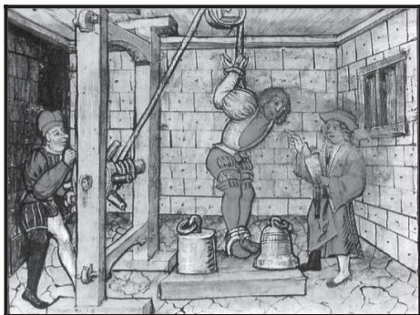
La tortura en el proceso penal 46 .

el proceso inquisitorio del Antiguo Régimen no aceptó ninguna condena en la mera base de indicios, sino requirió la confesión del delincuente como la reina de las pruebas, pues la verdad debía ser evidente para todos 47 . Por supuesto, esto fue nada menos que la cuadratura del círculo: la simbiosis estrecha entre una especie de estatalidad de derecho y su antítesis, la tortura.