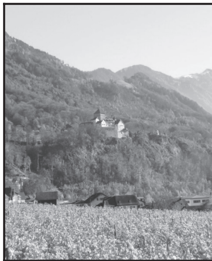
El castillo de Vaduz en Liechtenstein fue la sede de gobierno del condado de Hohenems-Vaduz 12 .