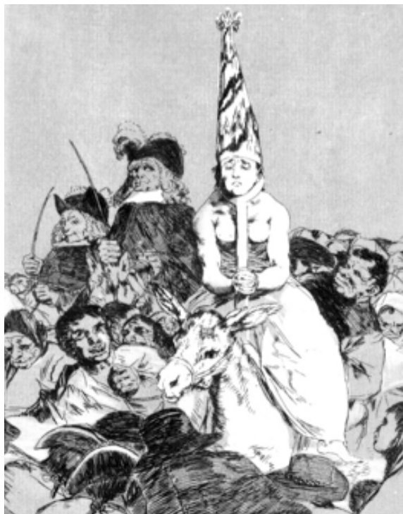
Figura 16. Una condenada del Tribunal del Santo Oficio con coroza y sambenito. El paseo en el burro subrayó la vergüenza pública 124 .

En perspectiva comparada, las cifras señaladas parecen moderadas y muy por debajo de la dimensión de las víctimas penales en los procesos de brujería efectuados en la Europa no mediterránea, en el lado norte de los Alpes, tanto en la parte católica como en la protestante 125 . La mayor intensidad se dio entre 1560 y 1690, cuando se condenó a alrededor de 60 mil mujeres y hombres por el reproche de haber causado daños a través de la magia negra en complicidad con el diablo. Para citar un ejemplo: de 1678 a 1680, el pequeño condado vasallo de Hohenems-Vaduz, ubicado en la zona alpina del Sacro Imperio Romano, investigó a 122 presumidos brujos y brujas y ejecutó a 54 de ellos 126 , es decir, en solo tres años un micro-territorio no superior a 30 kilómetros de longitud mató judicialmente a más enemigos de la fe que la extensa inquisición hispanoamericana en los 250 años transcurridos de 1570 a 1820. En este sentido, es adecuado indicar que