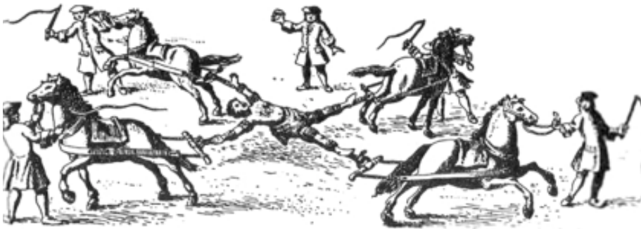
Figura 7. La muerte pública del líder rebelde peruano José Gabriel Condorcanqui —el autoproclamado Rey neoincaico Túpac Amaru II— en el Cuzco en 1781 65 .

Por su parte, el rebelde Julián Apaza, quien dirigió una sublevación de las clases subcampesinas del Alto Perú bajo el seudónimo de Túpac Katari, con tendencias al terror genocida contra todo estamento superior, incluyendo caciques incaicos, recibió la siguiente sentencia de muerte en 1781: