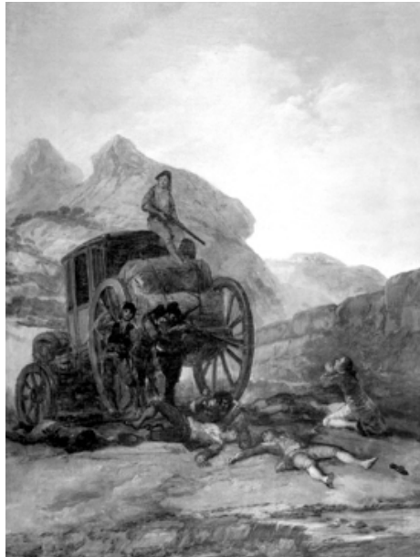
Figura 8. Asalto de bandidos a una diligencia a finales del siglo XVIII 72 .