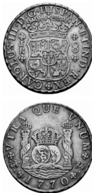
Figuras 1-2. La América virreinal: a la izquierda, se ve la subdivisión territorial de Hispanoamérica en 14 distritos de la jurisdicción suprema, es decir, en reales audiencias, en el siglo XVIII. A la derecha, se ve la identidad del Estado en un medio de pago: un real de a 8 acuñado en 1770 en la ceca de Potosí —con el respectivo sello PTS entrelazado—. La parte delantera presentó al monarca Carlos III como el “Rey de las Españas y de las Indias”, mientras la parte de atrás mostró los dos hemisferios del globo, con el hispanoamericano en el primer plano 15 .