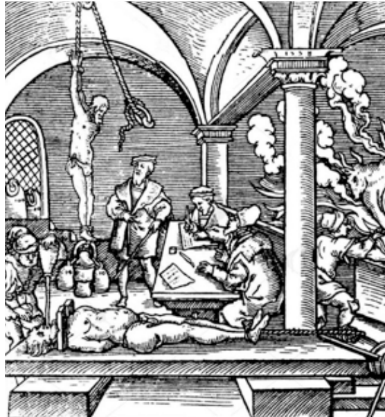
Figura 9. Tres métodos extendidos de la pregunta dolorosa del derecho procesal del Renacimiento y Barroco: la garrucha, el tormento de agua y el potro 76 .

Según el conocimiento de hoy, la tortura procesal debe ser vista como un método probatorio irracional, pues promovió que el interrogado confirmara, debido al dolor irresistible, lo que el interrogante quiso escuchar con base en la evaluación previa de la autoridad, pero la justicia penal del confesionalismo renacentista y barroco partió de la necesidad de la pregunta dolorosa para liberar al malhechor del poder negador del demonio que, supuestamente, había ocupado su alma. En general, la confesión fue mitificada religiosamente, pues el catolicismo creyó en la fuerza purificadora de la comunicación explícita de los pecados. De todos modos, también es cierto que el Antiguo Régimen se caracterizó por una escasez estructural de otros medios probatorios, pues no dispuso de las posibilidades de las ciencias forenses de la era industrial posterior: nadie pudo imaginarse la fotografía criminal, la dactiloscopia, la balística, la trazología, la fonética, la entomología, la genética, la toxicología, la medicina forense, etcétera.