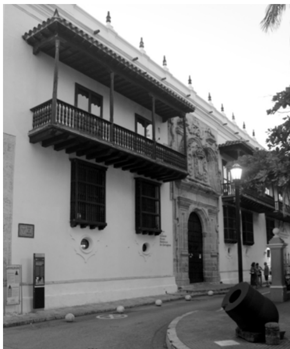
Figura 11. El Palacio de la Santa Inquisición en Cartagena de Indias, construido en 1770 al estilo barroco 90 .

última instancia. El liderazgo de los tribunales mostró una cierta fluctuación con la élite arzobispal-obispal de los virreinos.