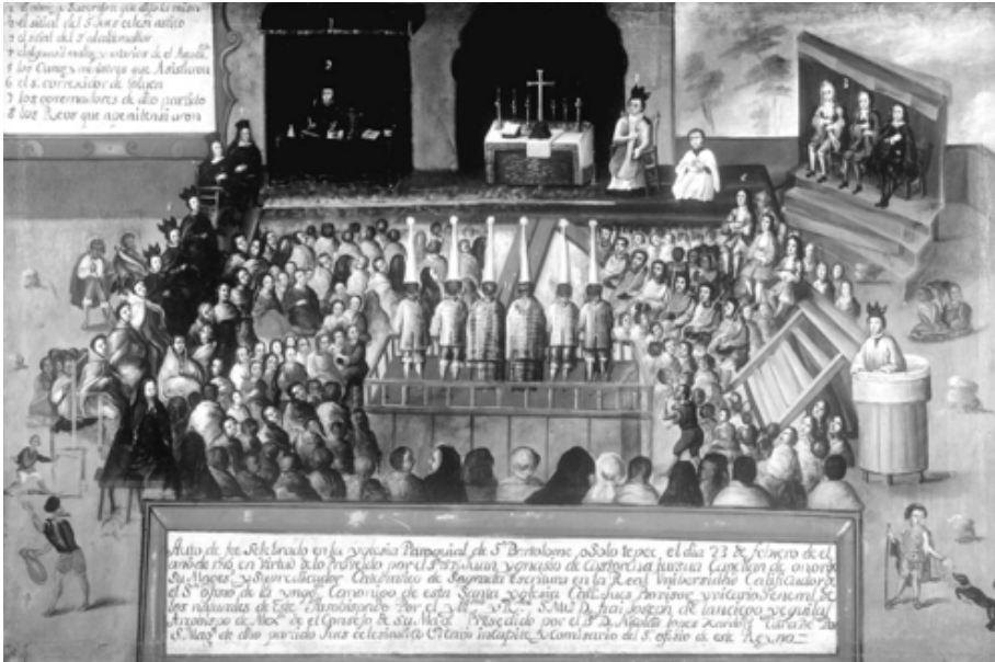
Figura 10. El auto de fe público de la Inquisición novohispana en el pueblo de San Bartolomé Oztolotepec en 1716. En el centro del ritual judicial se ubican los seis reos vestidos como penitentes con corozas y sambenitos de infamia 87 .

A partir de la respectiva Real Cédula de Felipe II de 1569, actuaron los Tribunales del Santo Oficio de la Inquisición en las dos capitales virreinales de Lima y México 88 , y, desde la Real Cédula de Felipe III de 1610, también en el puerto caribeño de Cartagena de Indias, con la competencia territorial para las reales audiencias de la Nueva Granada, Panamá y Santo Domingo 89 . En su tarea de proteger la pureza dogmática del monoconfesionalismo católico sin permitir desviaciones, reemplazaron la inquisición episcopal que se había practicado en los decenios anteriores. Como tribunal de apelación sirvió, debido al privilegio papal y la delegación apostólica, el Consejo de la Suprema Inquisición, presidido por el Inquisidor General de la Santa Sede para Castilla y Aragón, lo que sustituyó zonalmente la Rota Romana de la capital papal como tribunal de