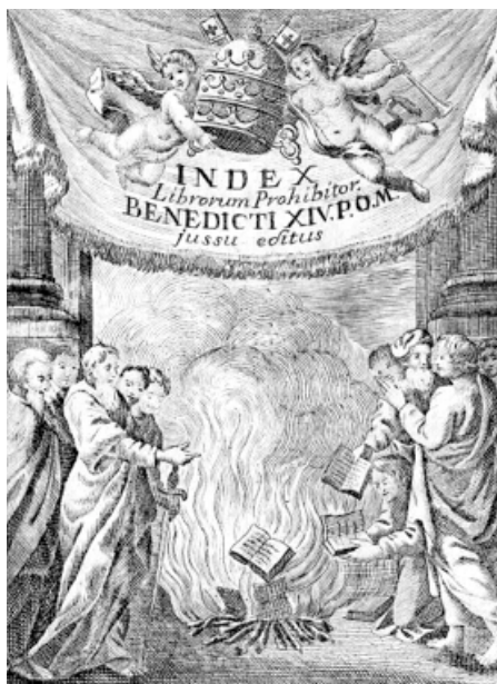
Figura 14. La quema de libros herejes en nombre del papa Benedicto XIV en la portada del Index Librorum Prohibitorum , según la edición de 1764 108 .

la élite educada, para revisar si eran compatibles con los dogmas oficiales de la Iglesia papal o no. Como referencia sirvió el Index Librorum Prohibitorum , que la Santa Sede actualizó permanentemente en múltiples ediciones a partir de 1559. Esta larga lista de libros considerados herejes y contrarios a la fe católica tenía fuerza de ley y la mera lectura era amenazada con penas eclesiásticas. De modo excepcional, fue posible recibir una licencia para leer libros prohibidos, especialmente si el solicitante era clérigo. En la segunda mitad del siglo XVIII, la inquisición novohispana condenó una variedad de libros a la hoguera y quemó, en particular, la Historia del pueblo de Dios y L'Encyclopédie . Hay que reconocer un totalitarismo intelectual en el papel de la antítesis de la libertad Gacto F., Enrique. El delito de bigamia y la inquisición española. Anuario de Historia del Derecho Español, 1987, n.º 57, Madrid, Ministerio de Justicia, pp. 465-492. de conciencia, expresión, prensa y ciencia, que la posterior civilización ilustrada aprendió a estimar como derecho natural 107 .