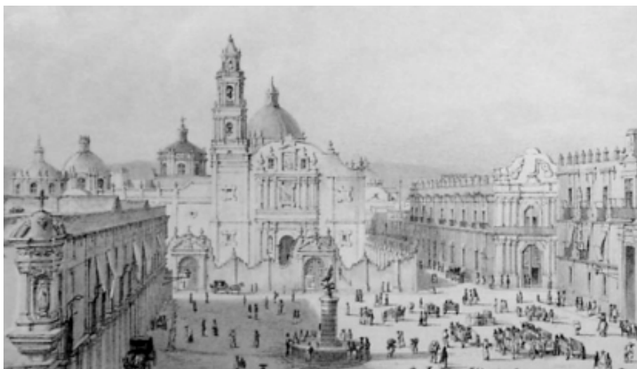
Figura 15. En la ciudad de México, el palacio de la Santa Inquisición, construido de 1732 a 1736, se ubicó directamente en el lado sur (a la derecha) del convento dominico 112 .