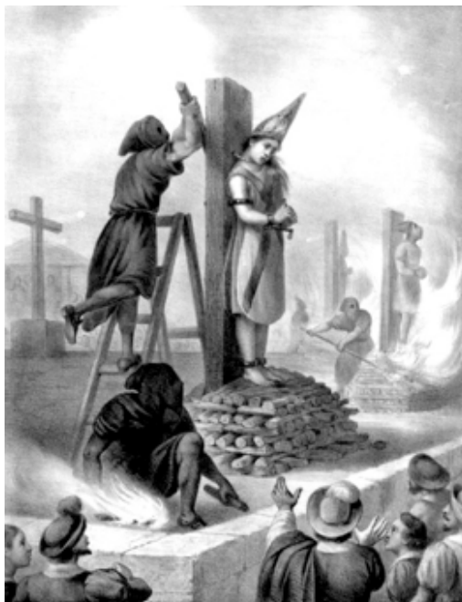
Figura 12. La pena de muerte de la supuesta judaizante Mariana de Carvajal en la hoguera de México de 1601, con el privilegio del estrangulamiento previo 93 .