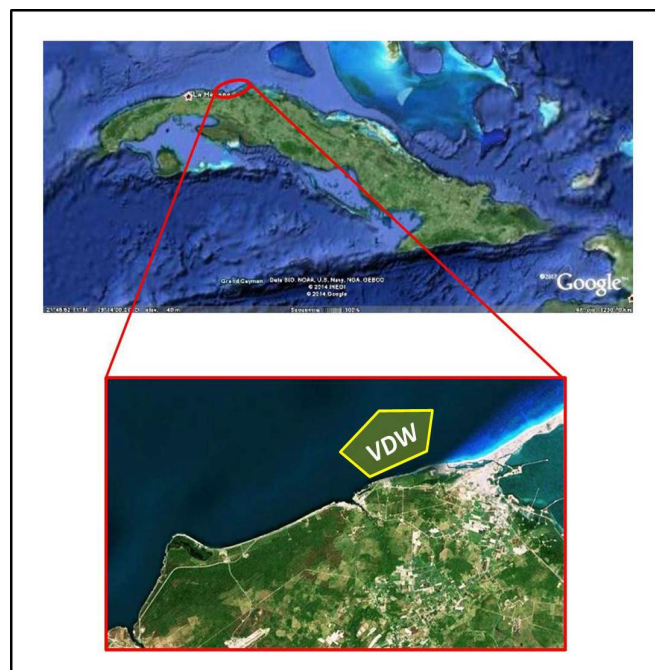
Figura 1. Ubicación geográfica esquemática de la zona de estudio.

La investigación partió de la interpretación de las propiedades de reservorio: volumen de arcilla (VCL), porosidad efectiva (PHIE) y saturación de agua (SW) en los pozos del área de estudio, para los que se calculó el COT y se les realizó la corrección de la porosidad. Para ello se visualizaron los registros compuestos y se confeccionaron gráficos de propiedades cruzadas.