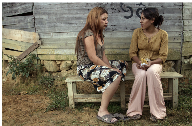
Figura 2. Fotograma de la película La mujer del animal .

Una de las filmaciones más destacadas es La sangre del cóndor (Óscar Sanjinés 1969), en la que se muestra a una comunidad quechua de Bolivia recibiendo atención médica por parte de una agencia estadounidense denominada Cuerpo del Progreso, cuyo objetivo es esterilizar forzosamente a las mujeres indígenas a través de la eugenesia. Cuando los bolivianos toman conciencia de ello atacan a los estadounidenses que reprimen a la población local mediante fusilamientos.