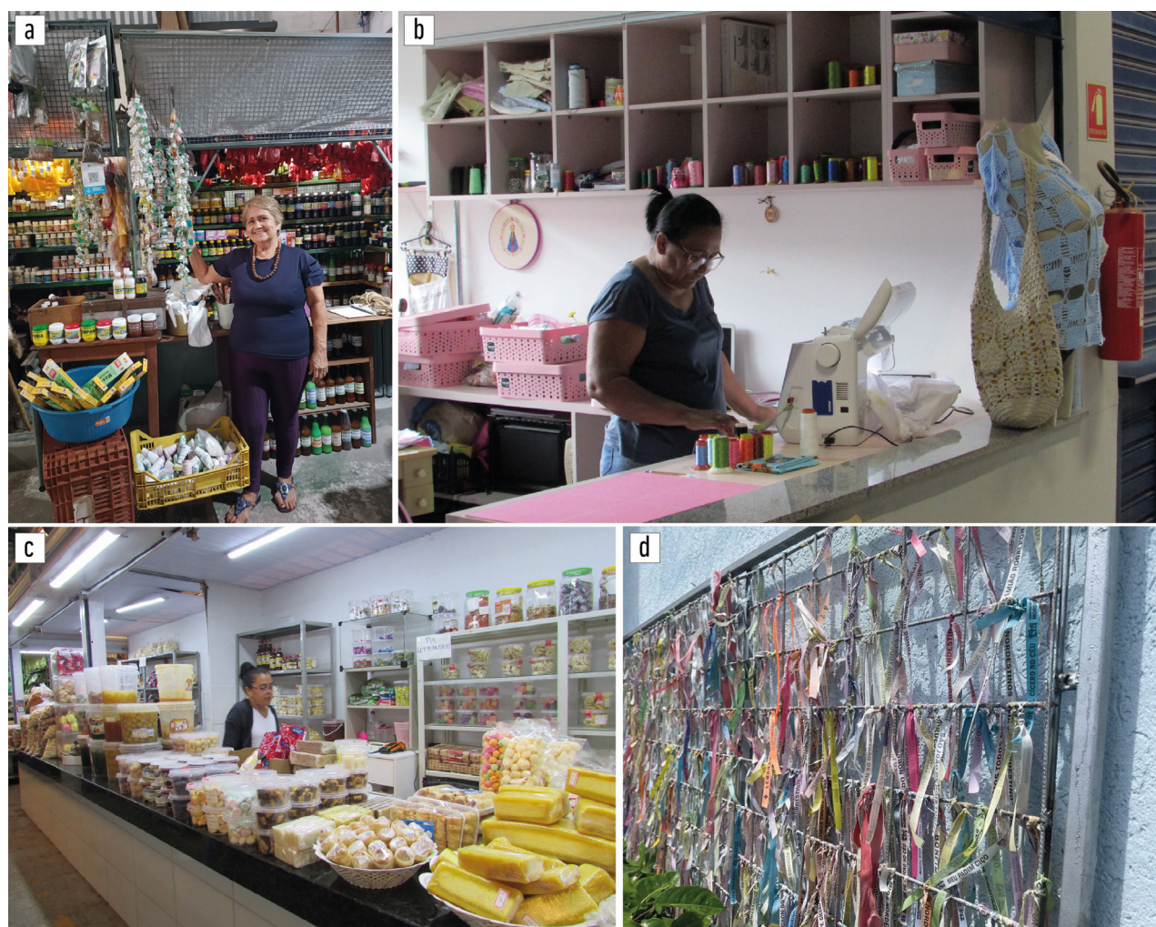
Figura 7. Variables de conexiones territoriales afectivas: sincretismo religioso y mujeres en puestos de los mercados.

o establecimientos del DF y SP, analizada como ausente o en riesgo . En el Núcleo Bandeirante, la mencionada VCTA además del riesgo , se encuentra estigmatizada , es asociada a la informalidad por algunos feriantes. “Las personas que gritan sus productos son los ambulantes, ¿sí?, la gente intenta impedir, pues incomoda” (Feriante W). En el PA, el argot/pregón es vivido y percibido por los sujetos de ambas las ferias, especialmente en el Ver-o-Peso. “Aquí se grita por todos los lados, es mucha gente, todo tipo de sonidos. Incomoda mucho. Es el Ver-o-Peso” (Feriante D).