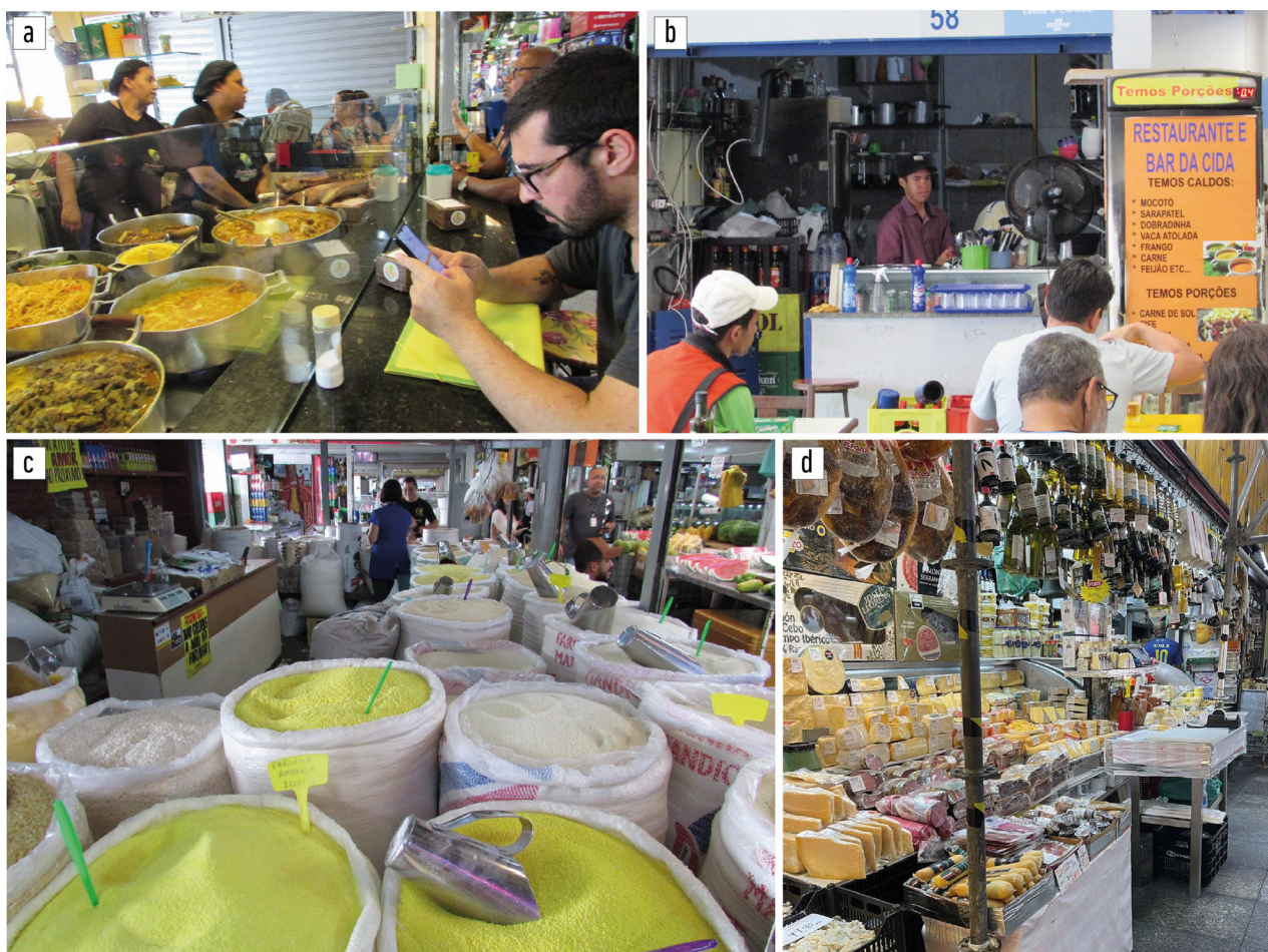
Figura 6. Patrimonio-territorial: comida tradicional en puestos de los mercados.

de Tradiciones Nordestinas desde su fundación, el 1991” (Feriante C). En el PA, la VCTA linaje es vivida en las dos ferias; sin embargo, está en riesgo en São Brás, pues los locatarios demuestran poco interés de transmitir el oficio a las futuras generaciones y buscan mejores oportunidades de empleo y condiciones de vida.