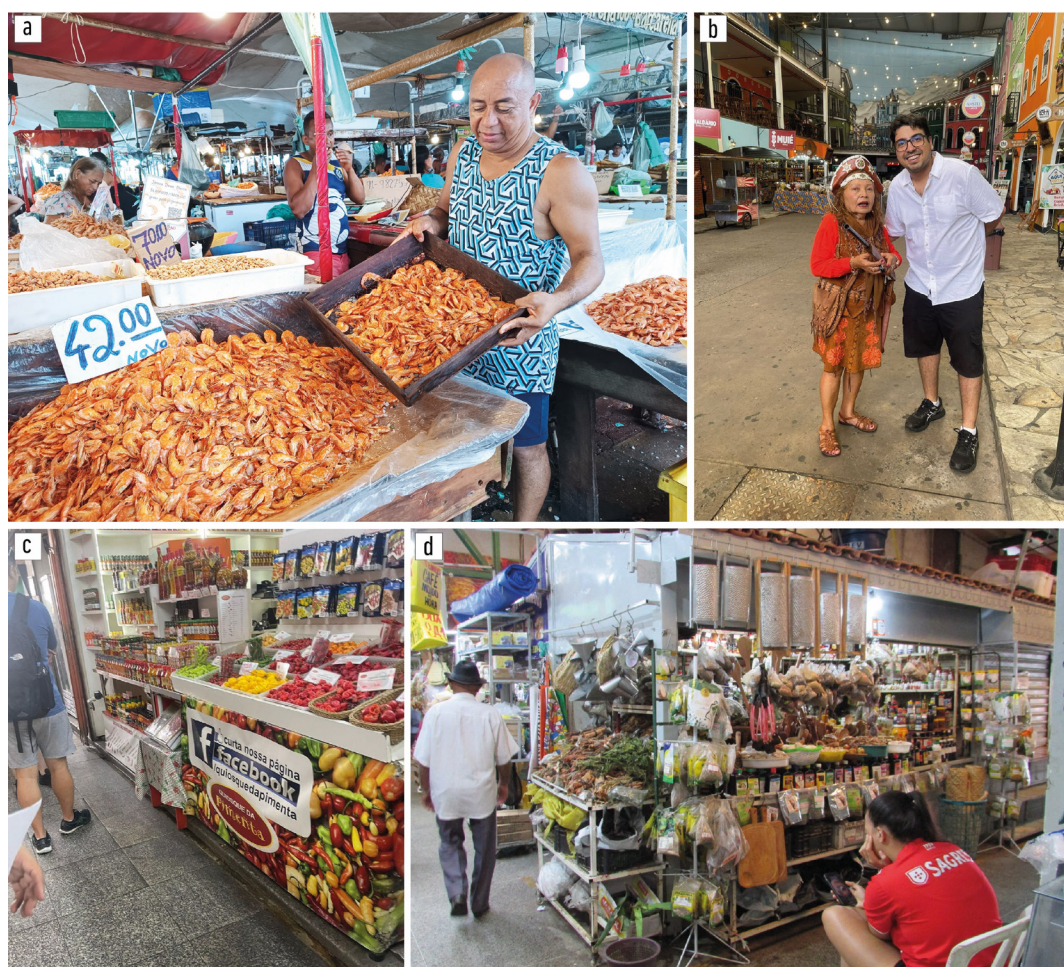
Figura 5. Patrimonio-territorial: expresiones originarias nordestinas en puestos de los mercados.

DF. La VCTA informalidad —actividad comercial popular/tradicional sin vínculo con los derechos laborales, que conduce a los sujetos hasta los mercados y sus alrededores para sobrevivir— contribuye para la interacción interior-exterior de las ferias del DF y del PA, siendo percibida y vivida en Ceilândia, Centro de Tradiciones Nordestinas, Ver-o-Peso y São Brás; ausente y estigmatizada en el Núcleo Bandeirante. En São Paulo, ambos establecimientos desalientan o toleran en menor medida la informalidad, excepto cuando esta forma parte de la fuerza laboral familiar. Generalmente, se establecen vínculos con quienes participan formalmente en los mercados, pero no con quienes ocupan el espacio exterior.