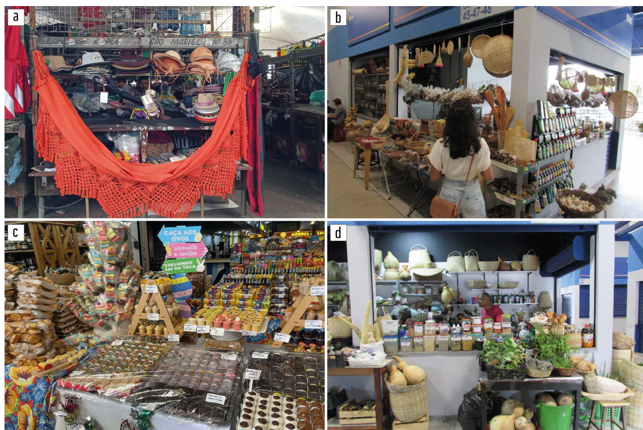
Figura 4. Variables de conexiones territoriales afectivas: símbolos migratorios nordestinos en puestos de los mercados.