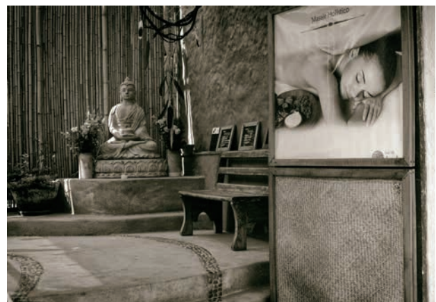
Figura 7. Tepoztlán, turismo holístico e hibridación cultural, 2017.