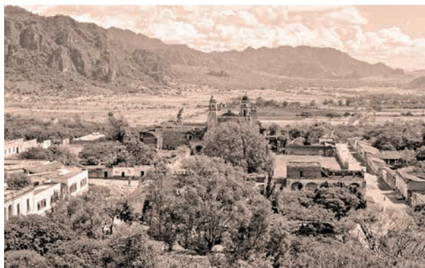
Figura 5. Panorámica del centro de Tepoztlán, Morelos, 1947.

Estos cuestionamientos sobre la capacidad de la cultura tradicional para asimilar los cambios de la modernidad son centrales para la definición de la identidad, si bien Lewis no cuestionaría en ningún momento el modelo industrial-capitalista, al que veía inexorablemente como un destino manifiesto, sin imaginar que con el paso del tiempo se generaría un movimiento social a escala internacional en donde Tepoztlán se convertiría en actor estelar.