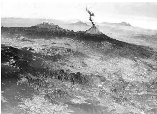
Figura 2. Foto aérea de Tepoztlán. Instituto Nacional de Estadística y Geografía. Fuente: imagen cortesía del Instituto Nacional de Estadística y Geografía (INEGI 2011).