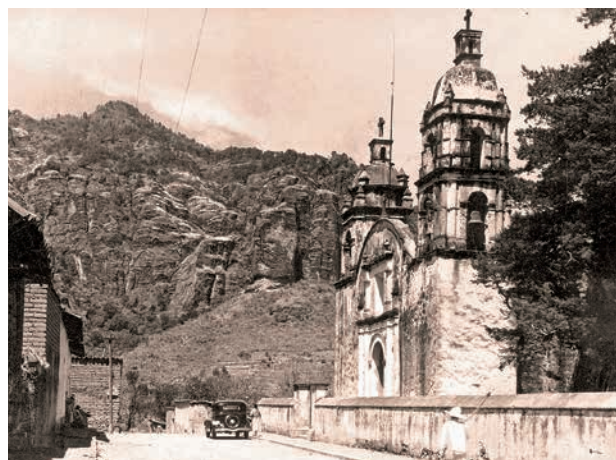
Figura 3. Vista desde la iglesia de Santo Domingo, Tepoztlán, Morelos, 1947.

En una primera revisión acerca de los estudios antropológicos sobre Tepoztlán, se destacan los trabajos seminales de Robert Redfield (1930) y de Oscar Lewis (1951, 1960), que mediante una aproximación etnográfica intentan reconstruir los imaginarios culturales de Tepoztlán a partir de una aproximación etnográfica. Si bien dichos autores lograron hacer radiografías de momentos particulares en la historia del lugar —por medio de un discurso ligado al folk-urbano y a la criticada “cultura de la pobreza” de Lewis—, no alcanzaron a capturar los catalizadores del cambio cultural.