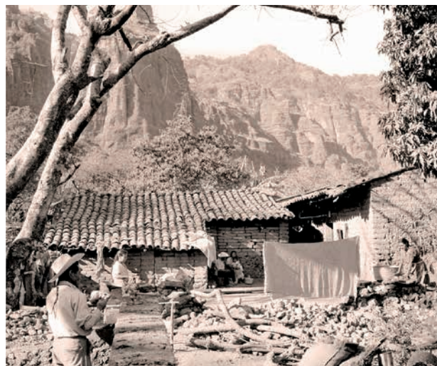
Figura 4. Vista desde una vivienda rural, Tepoztlán, Morelos, 1948.

Efectivamente, si bien es en dichos factores donde se encuentran las claves de la cohesión social, Oscar Lewis aportaría el análisis del entorno socioeconómico y de la personalidad misma de los habitantes, como elementos faltantes para entender las dinámicas sociales. A este respecto, es necesario destacar que también se ha cuestionado su visión determinista al referir a los habitantes como una población “carente de una ambición o determinación hacia el mejoramiento personal”, con una naturaleza conformista, pasiva y supersticiosa, elementos que perfilarían más adelante su teorización sobre la “cultura de la pobreza”. De acuerdo con Lewis, el mundo y la naturaleza representan amenazas continuas de calamidades y peligros potenciales que generan ansiedad y miedo generalizado. Su diagnóstico se extendía a la población en su conjunto, a quienes consideraba “potencialmente hostiles y peligrosos, además de que su reacción habitual era estar a la defensiva” (Lewis 1960, 87). No obstante, Lewis percibiría en los tepoztecos una ausencia de frustración, ansiedad o culpa, por lo que su aproximación es hasta cierto punto condescendiente y paternalista, lo que descalificaría la naturaleza contestataria de los tepoztecos así como el papel de lo sacro dentro de la vida cotidiana de la comunidad.