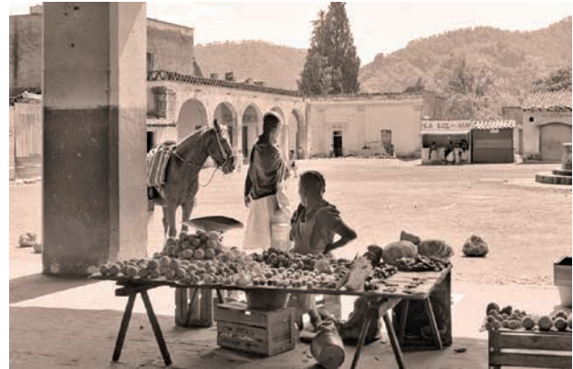
Figura 6. Vendedora de fruta en los portales, Tepoztlán, Morelos, 1949.

intervenciones gubernamentales tiene su origen en los numerosos despojos de tierras que ha sufrido la población, lo cual la llevaría a ser una de las primeras localidades de Morelos en unirse al levantamiento Zapatista al inicio de la revolución (Redfield 1930). Al respecto, Warman recuerda que “los Zapatistas no solo habían peleado por la tierra, sino también por ejercer el dominio sobre el territorio a través de una comunidad libre” (1978, 117).