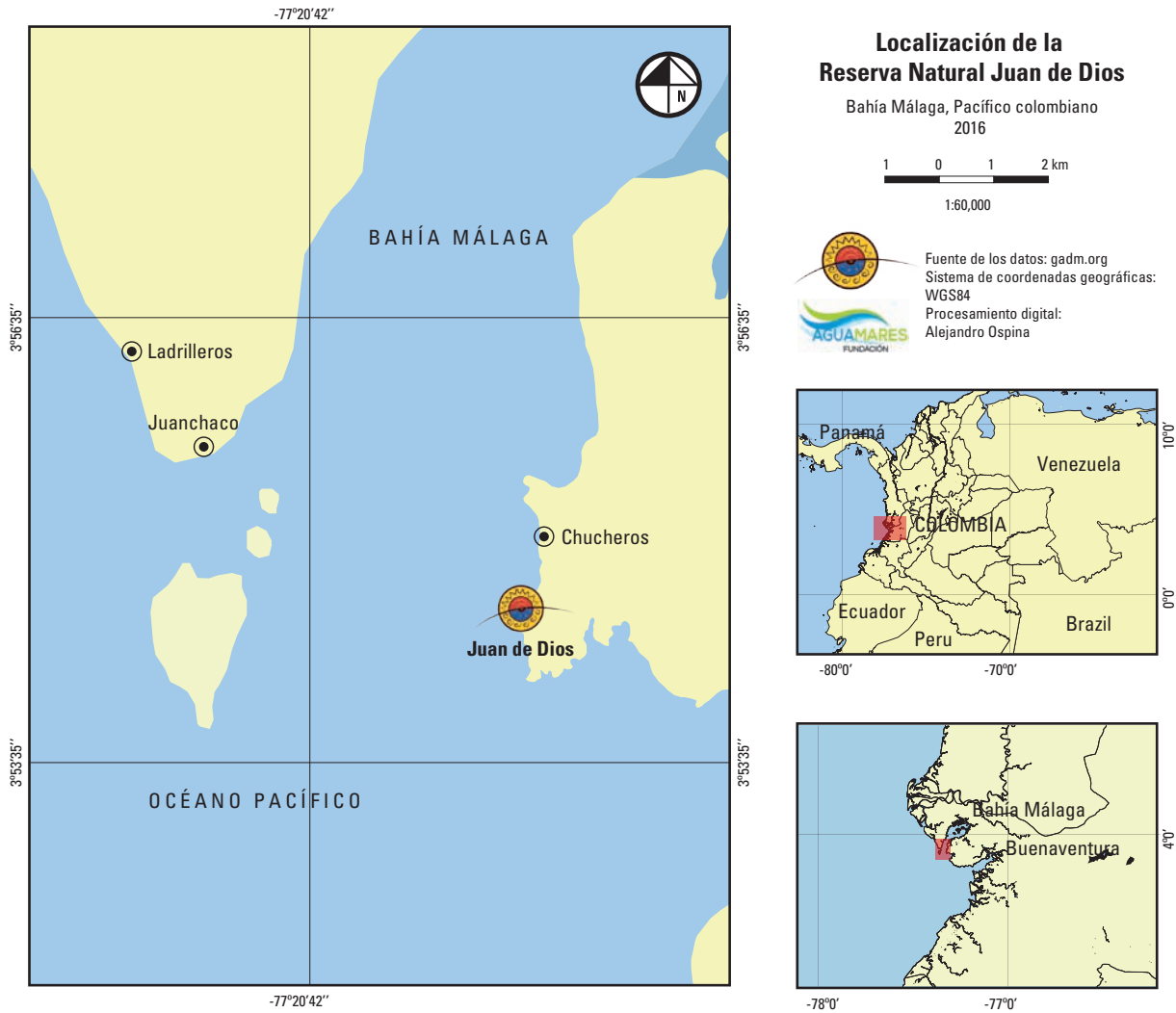
Figura 1. Localización de la Reserva Natural Juan de Dios. Datos: Global Administrative Areas sf.

Para llevar a cabo la investigación se estableció como unidad de análisis el territorio de la Reserva Natural. Como población objeto de estudio se tuvieron en cuenta múltiples y diversos actores —muchos de los cuales no viven en el lugar analizado—, quienes tienen relación con la transformación del paisaje y la construcción del territorio turístico; de este modo, las personas con las que se recolectó información representan actores tanto en el lugar (habitantes, turistas) como fuera de él (voluntarios, visitantes recurrentes). Adicionalmente se realizó un trabajo de campo específico durante una semana, sumado a lo cual está la permanencia previa de numerosas semanas en el sitio.