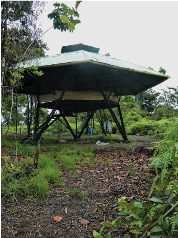
Figura 10. Eco-arquitectura (Bohío Om Tara). enero del 2014.

De cualquier forma, desde un escenario denominado turismo natural, turismo en espacios naturales o ecoturismo, el tema turístico puede ser considerado desde la categoría ambiental. Un análisis de este tipo —que conjuga las aristas tanto sociales como naturales, con un enfoque cultural—, puede tener mejores bases para profundizar en un estudio de caso determinado que