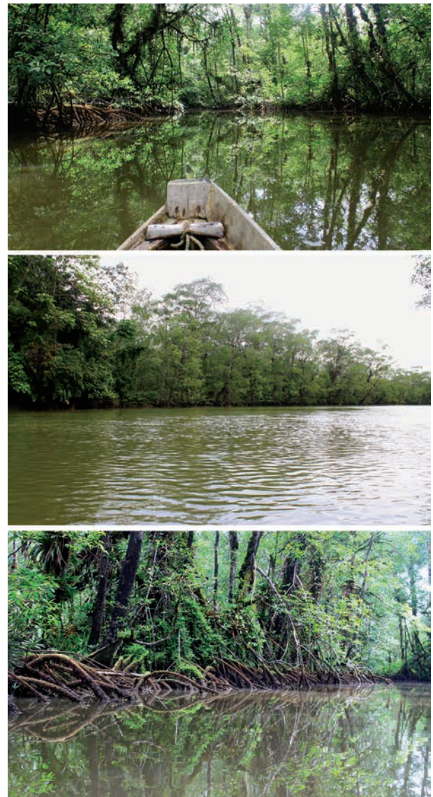
Figura 2. Ecosistema de manglar. Fotografías del autor, junio del 2013 y enero del 2014.

El manglar, junto con la playa y el bosque húmedo tropical son los tres ambientes naturales predominantes en la naturaleza del paisaje turístico de Juan de Dios.