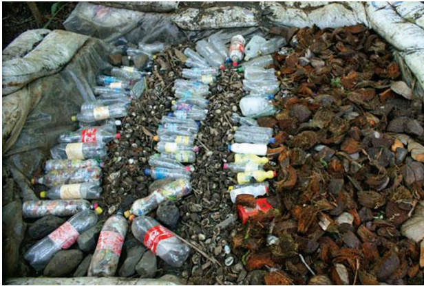
Figura 9. Manejo de residuos sólidos.