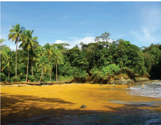
Figura 4. Ecosistema de playa (Playa Dorada). enero del 2014.

Ello hace que la Bahía de Málaga, donde se ubica Juan de Dios, disfrute de una riqueza y diversidad biológica excepcionales. Para poner un ejemplo, se han contabilizado más de 230 especies de peces y 12 de mamíferos acuáticos (Díaz 2007). De estos últimos vale la pena destacar, no solo por su valor biológico sino cultural —y por ende turístico—, la presencia de la ballena jorobada o yubarta: