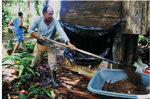
Figura 7. Manejo de residuos: baño seco compostero.

de la lógica de la permacultura 16 tales como la recolección de agua lluvia, saneamiento de aguas servidas, uso de baño seco compostero, siembra, ahorro de energía, manejo de residuos sólidos y bio-construcción o eco-arquitectura (figuras 7 a 10). Todo esto en concordancia con la dinámica turística de recibir visitantes, que es el eje y la principal actividad de la playa.