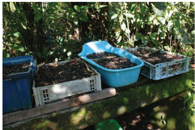
Figura 8. Siembra.