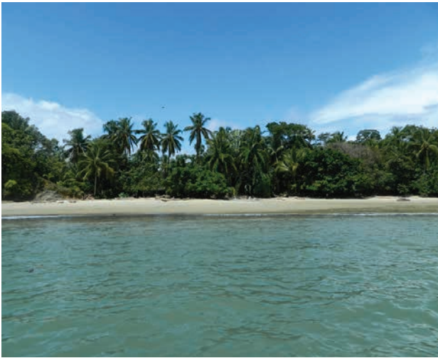
Figura 3. Ecosistema de playa (Playa Juan de Dios). Fotografía de Yessenia Naranjo, enero del 2014.